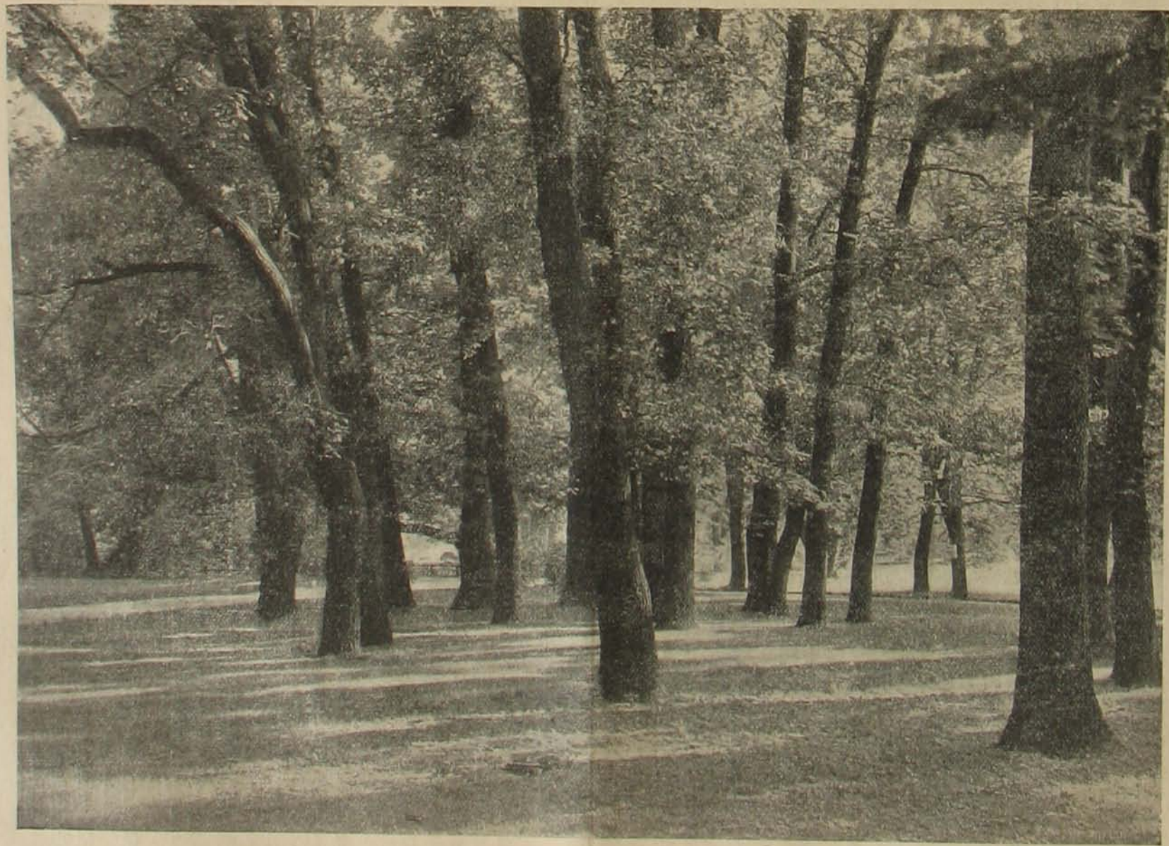
A Margitszigetről. — Arany János tölgyei