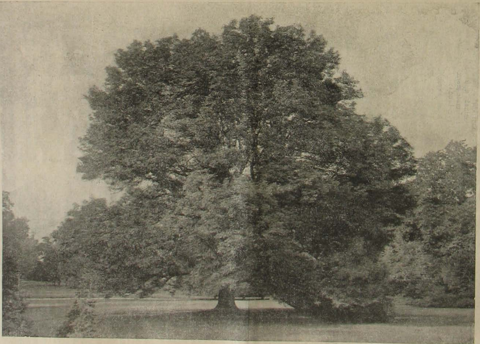
A Margitszigetről. — Óriás kőrisfa a víztorony mellett.