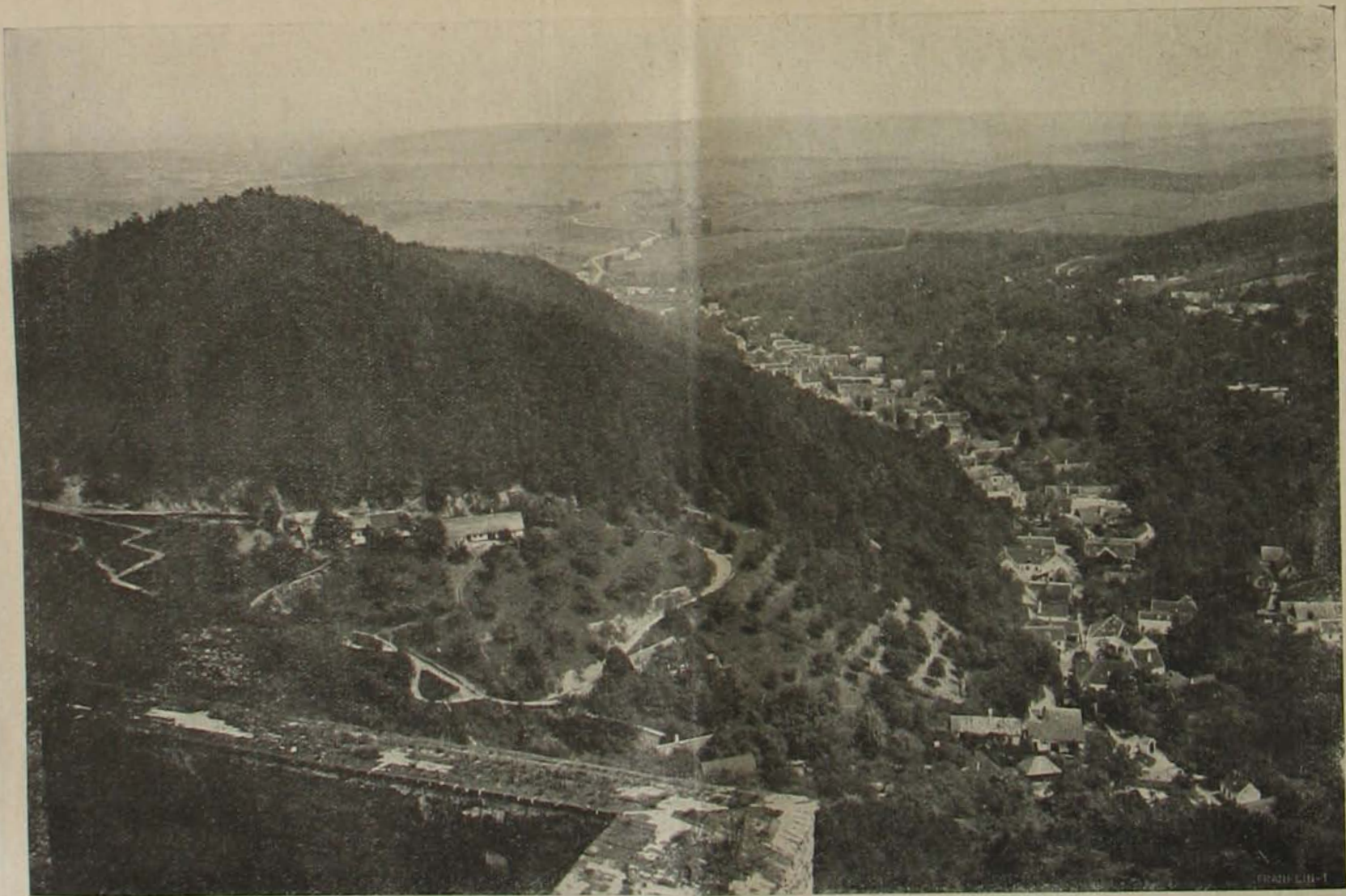
Kilátás Fraknó várából.