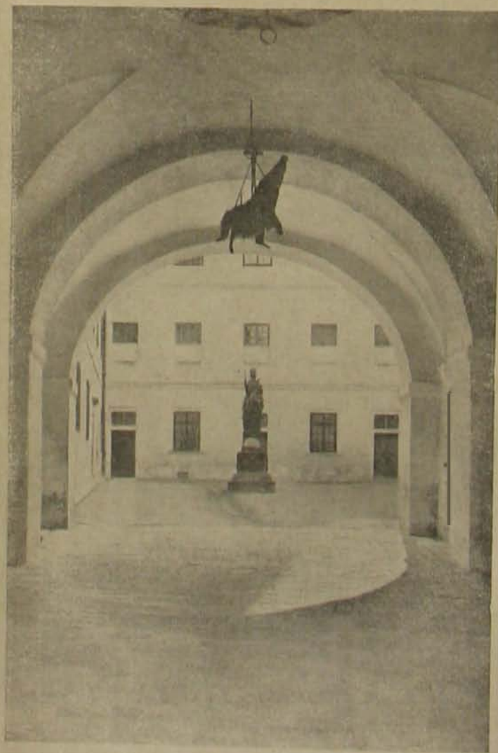
Fraknói képek. — A vár főkapuja a granátos őrséggel. — A felső várudvar.