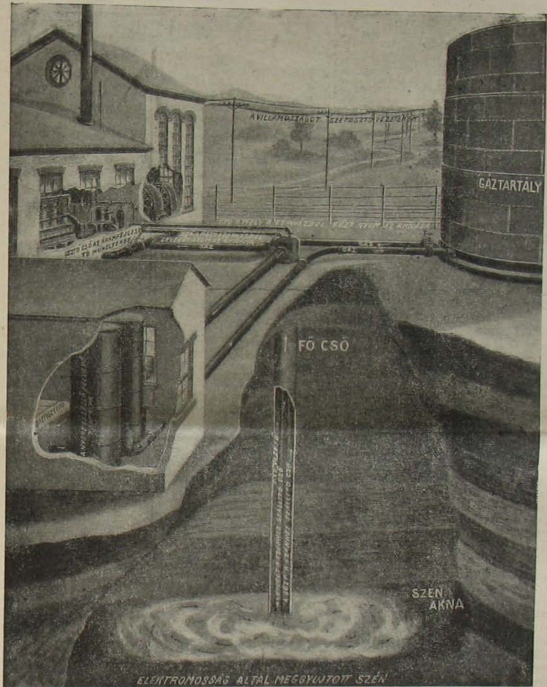
Sir William Ramsay, hírneves angol természettudós terve: a szén a bányában elégetni, az így fejlődő gázt csöveken fölvezetni, gépek segítségével villamossággá változtatni és mindenfelé elvezetni.

títja őket, úgy hogy egész gyalogságunkból nem állíthatunk ki két zászlóalj egészséges legénységet, a lovaságból pedig négy svadront. Ezek közt is napról-napra újabb megbetegedések fordulnak elő. A tegnapi ütközetben és csatározásban is annyi elpusztult, hogy alig van körülbelül 800 gyalogos és három svadron lovas — mindent összeszámítva.