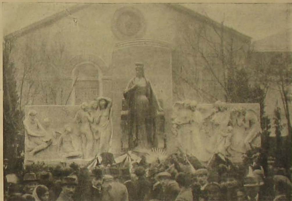
Erzsebet királyné új szobra Triestben. (Scifert bécsi szobrász műve.)