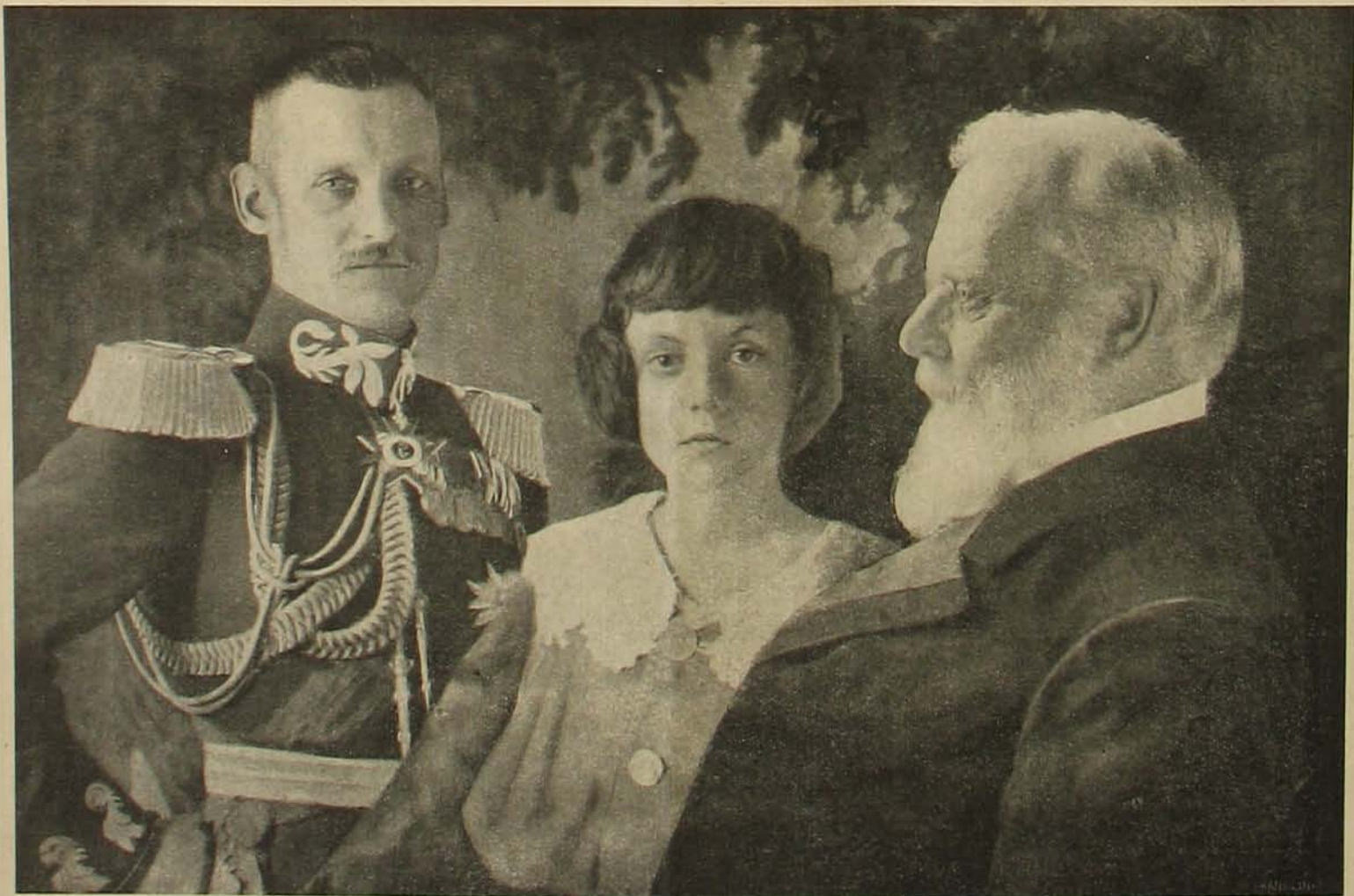
Lajos, az új bajor regens-herceg, fia, a trónörökös és unokája a trón várományosa.