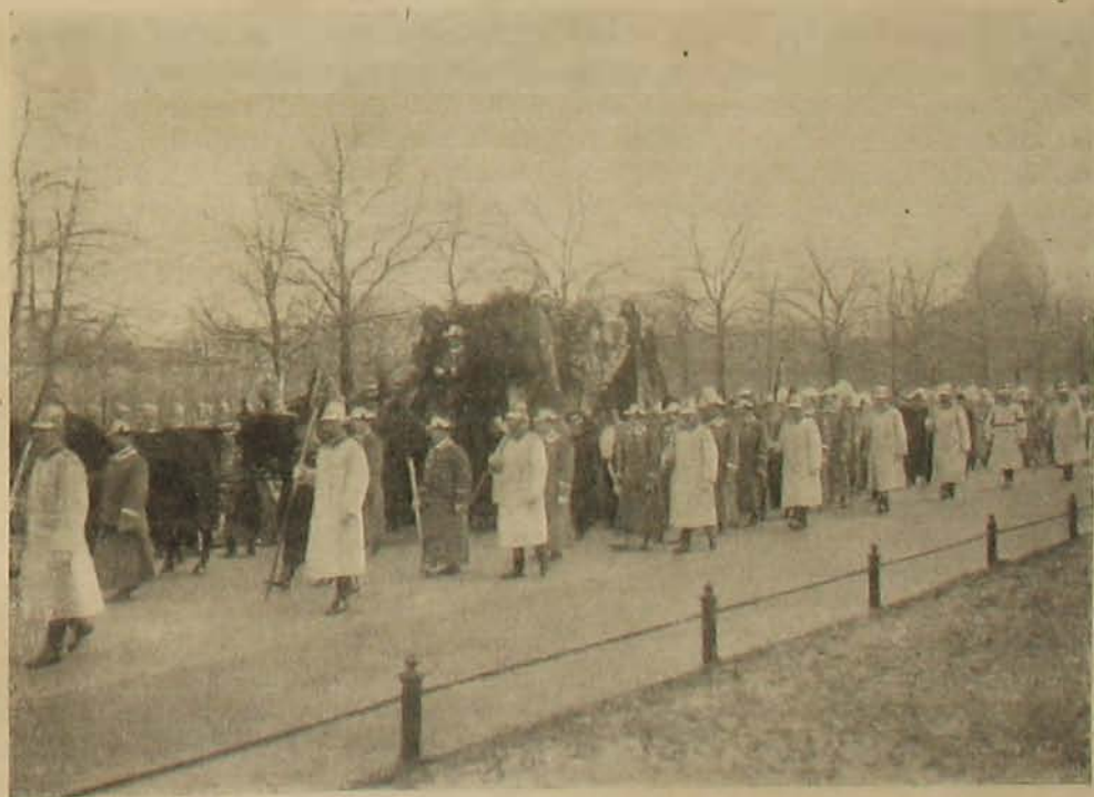
Luitpold bajor regensherczeg temetése.