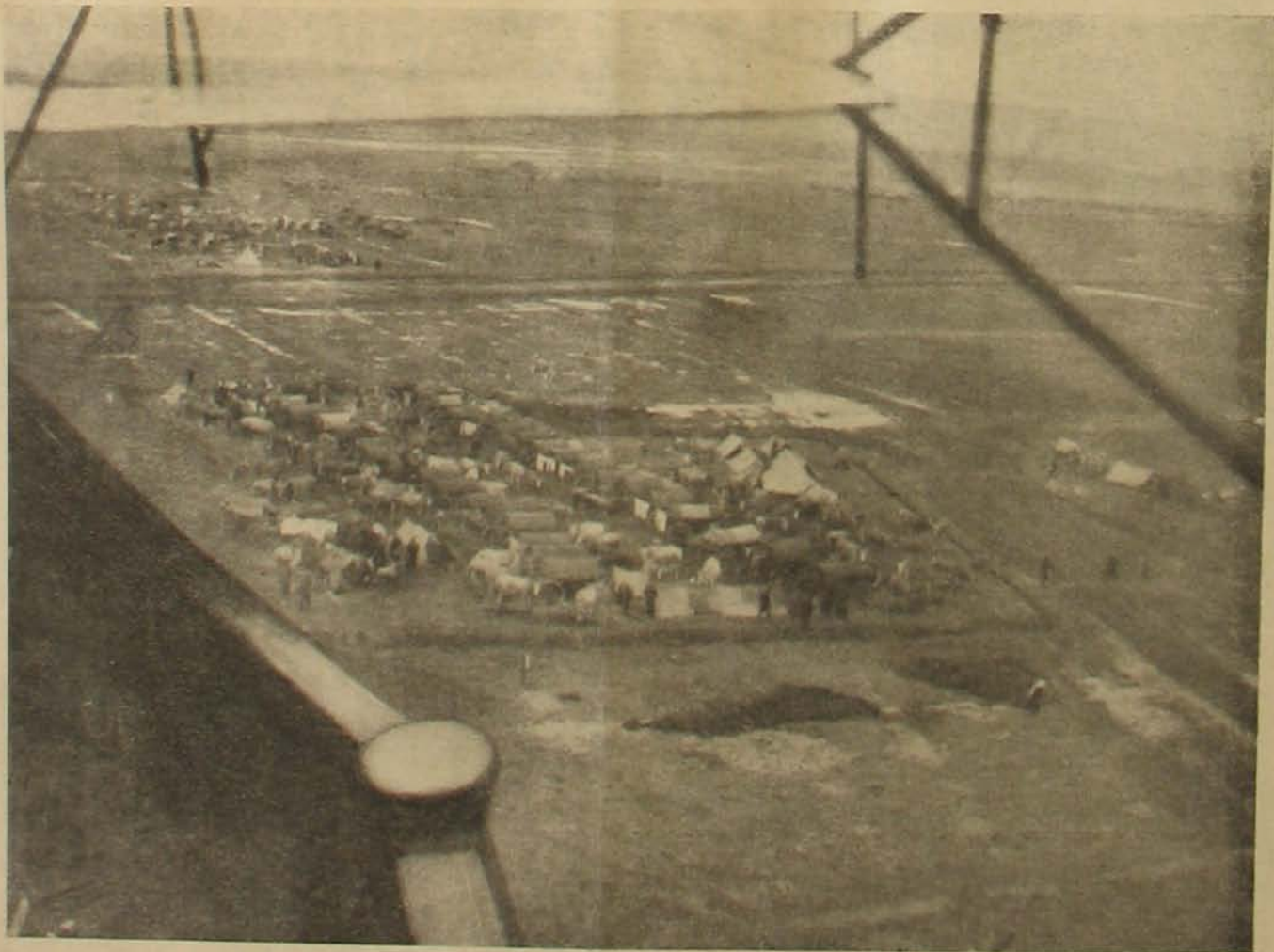
Bolgár tábor repülőgépről fényképezve.