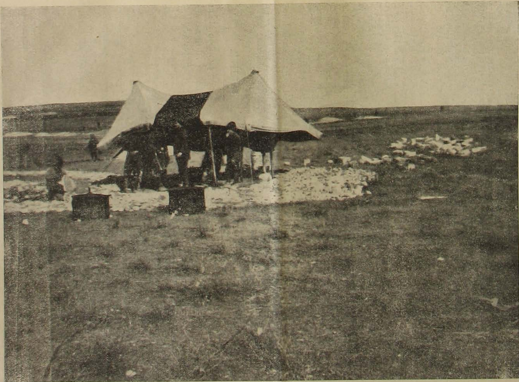
Órállomás a csatáldzsai harcvezonalon.