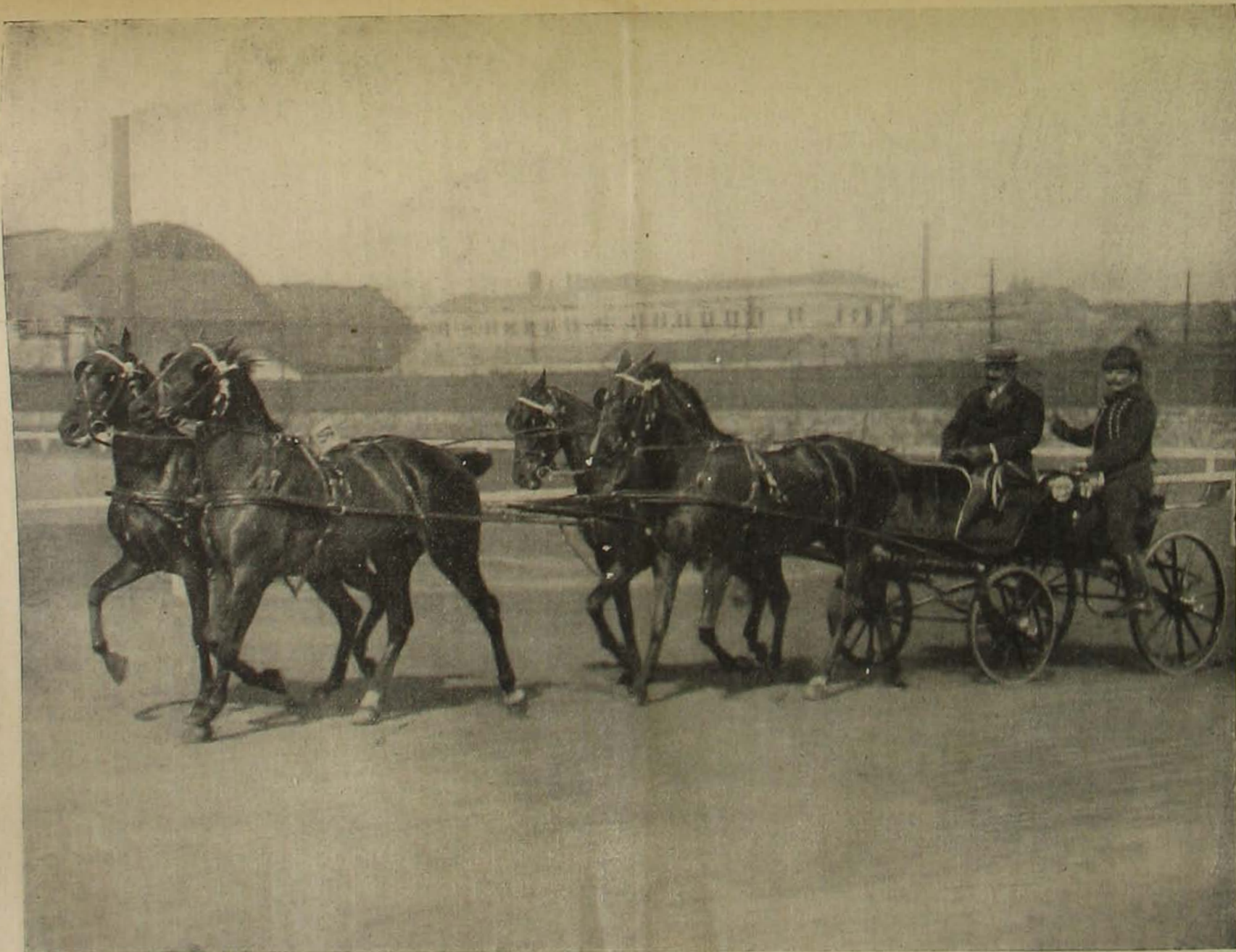
Négyesfogat. — A Tattersallban rendezett luxus-lóvásárról.