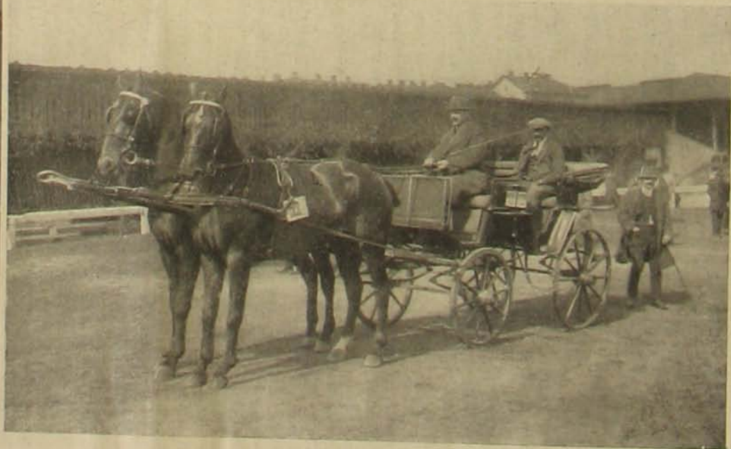
A budapesti Tattersalli luxus-lóvásáron díjat nyert fogatok és háttaslovak.