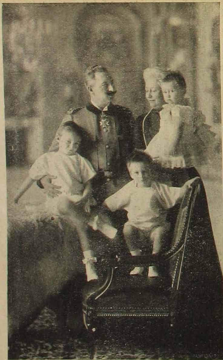
A császár és császárné unokáikkal.