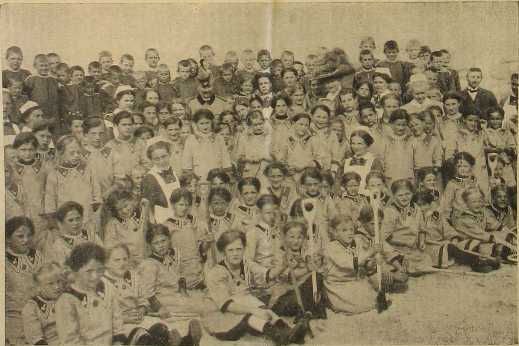
A császár és császárné az aalbeckeri gyermektáborban.