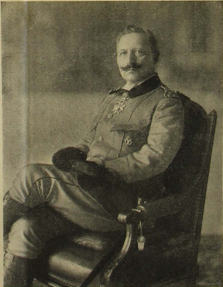
A császár legújabb fényképe vadásztibában.