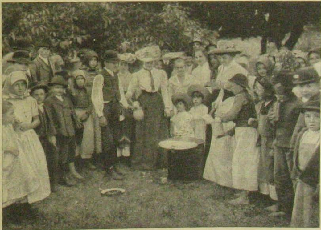
Aratóünnep. — A házi kisasszony kiosztja az ételt.