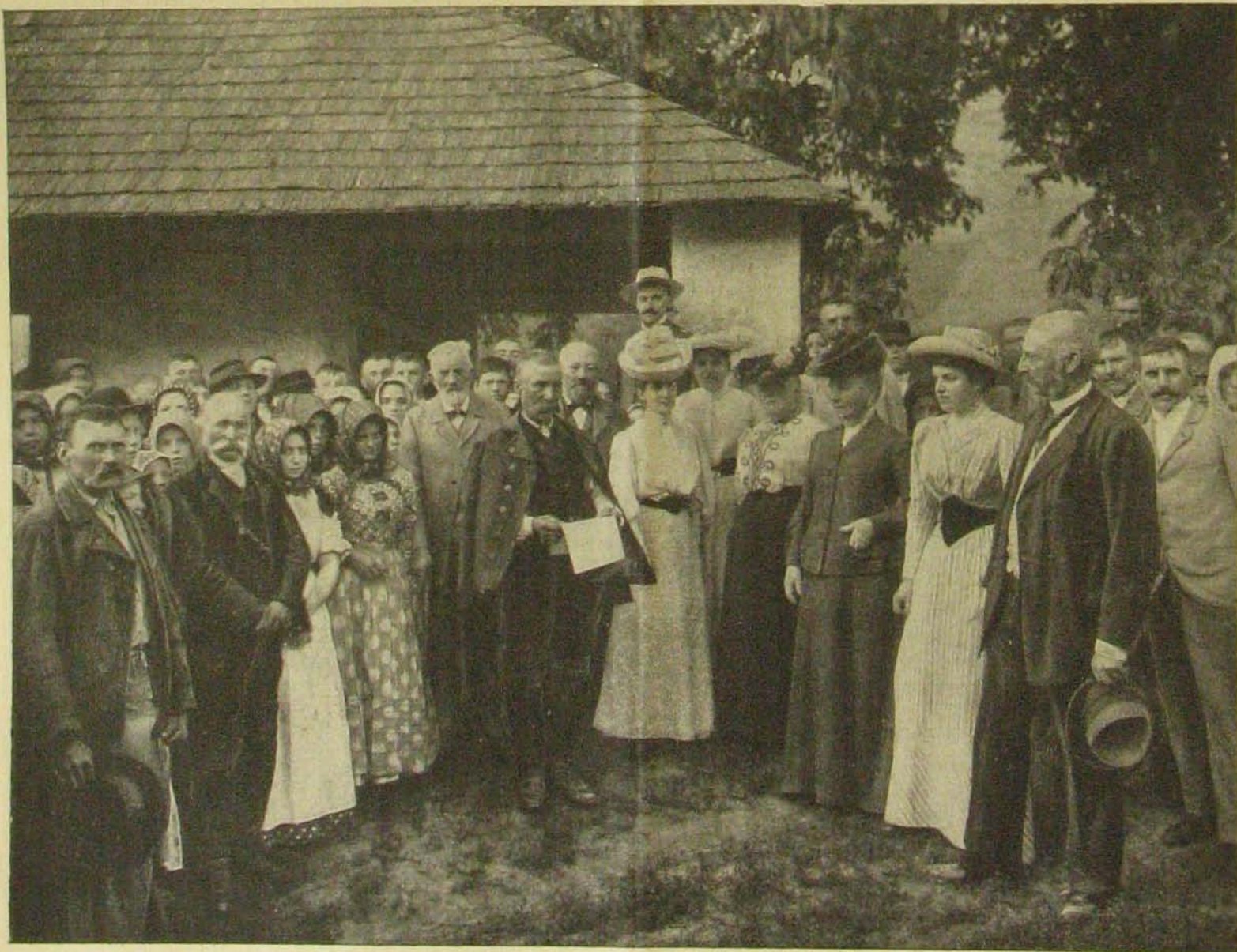
Arató-ünnep. — A bandagazda felolvassa a rígmusos felkösztöt.