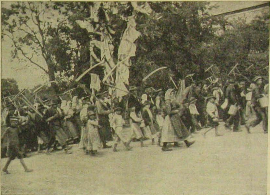
Az aratók felvonulása.