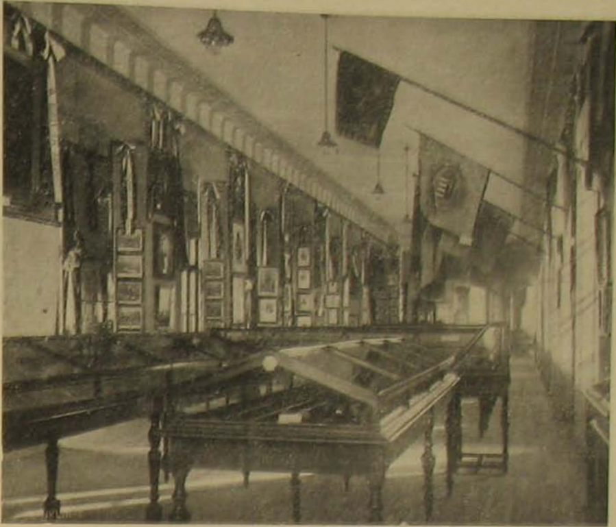
Az aradi kulturpalota, melyet most október 26-án avattak föl. — Az éreklje-muzoum nagy terme.

keresztül rá lőtt, de lövése nem talált. Thoma őrmester a merénylet ellen ismétlőpisztolyból szintén egy lövést intézett, mely azt jobb halántékon találva, halálosan megsebesítette.