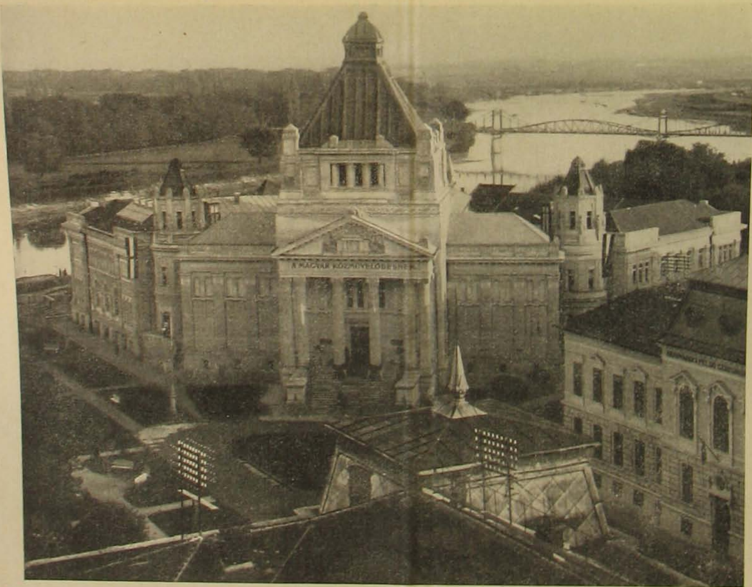
Az aradi kulturpalota, melyet most, október 26-án avattak föl.