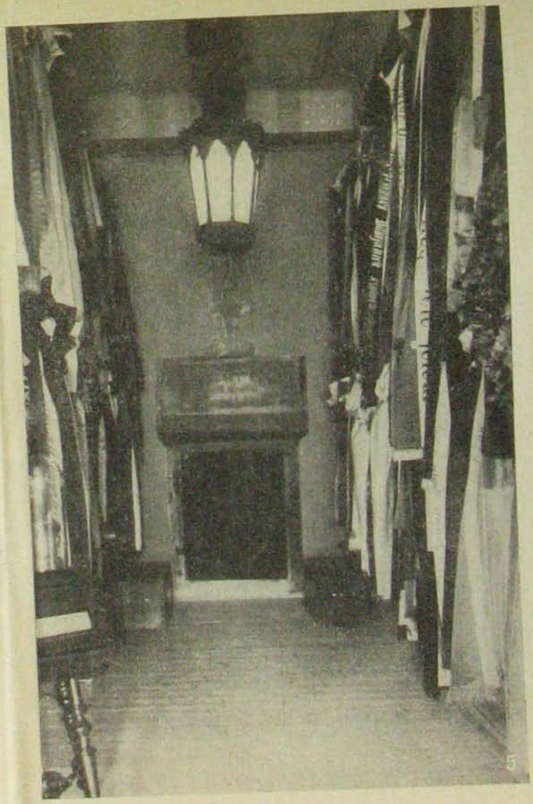
4. A Fábrián Gábor-szoba. — 5. Az aradi múzeum egyik fülkéje, melyben Vécsey tábornok az aradi régi temetőből áthozott kriptájának ajtaja és sírfelirata van elhelyezve. A két oldalon levő kis ládákhban vannak Schweidel és Lázár tábornokok most feltalált csontmaradványai.

Az aradi kulturpalota, melyet most október 26-án avattak föl.