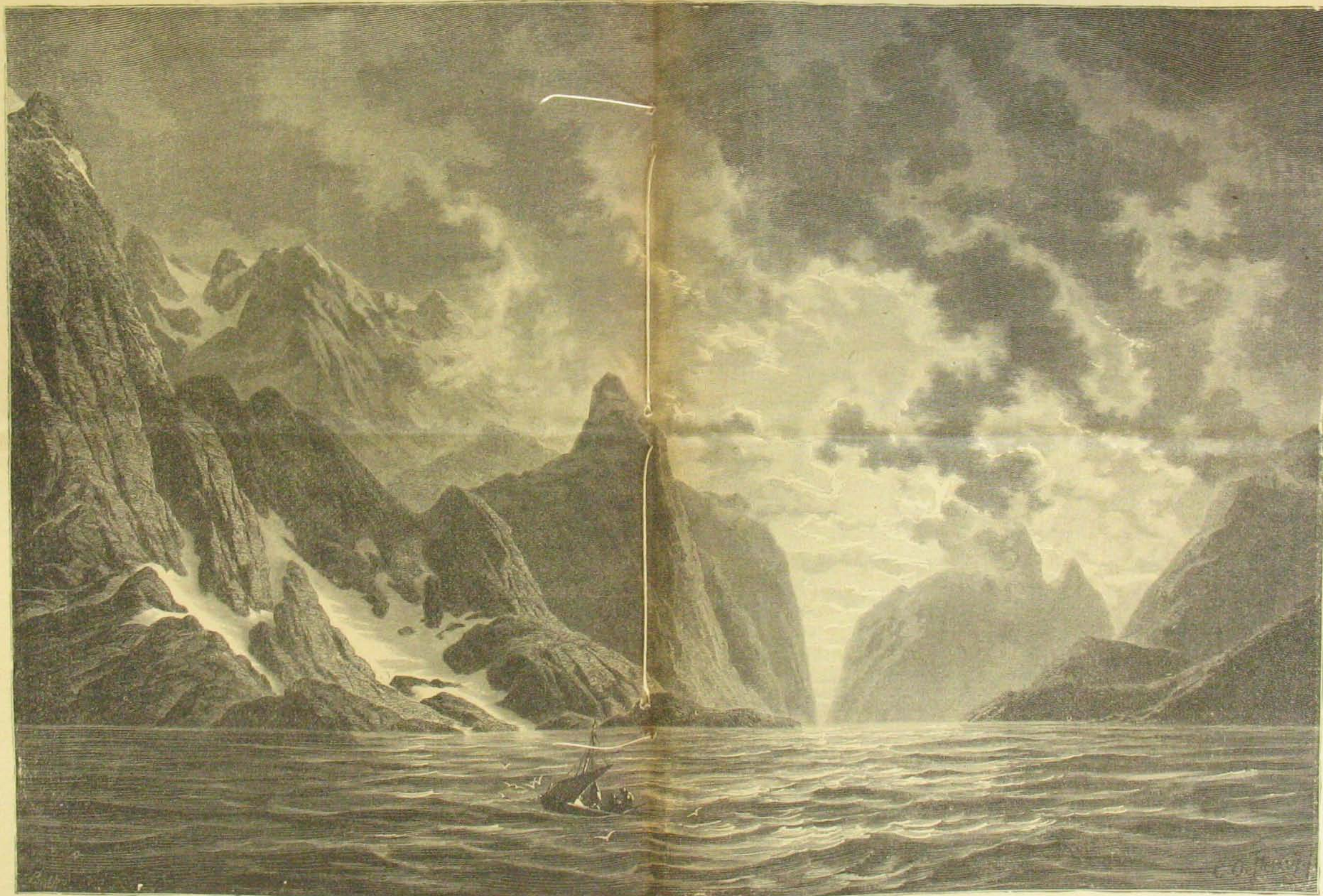
Az éjféli nap a lofodi szigeteknél.