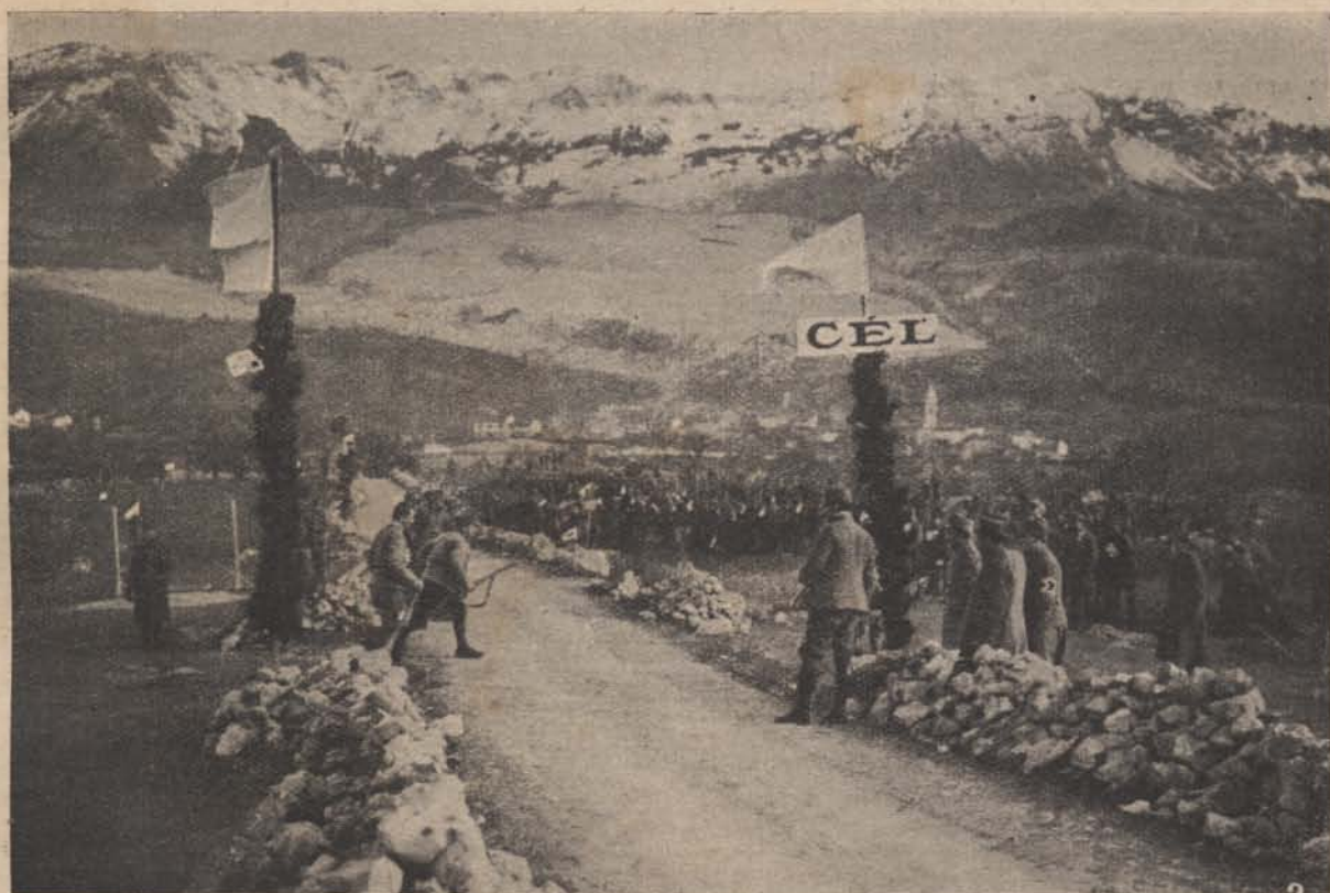
39-es bakáink sportolnak a front mögött. — 1. Futás kőmezőn. — 2. A távgyaloglás résztvevői.