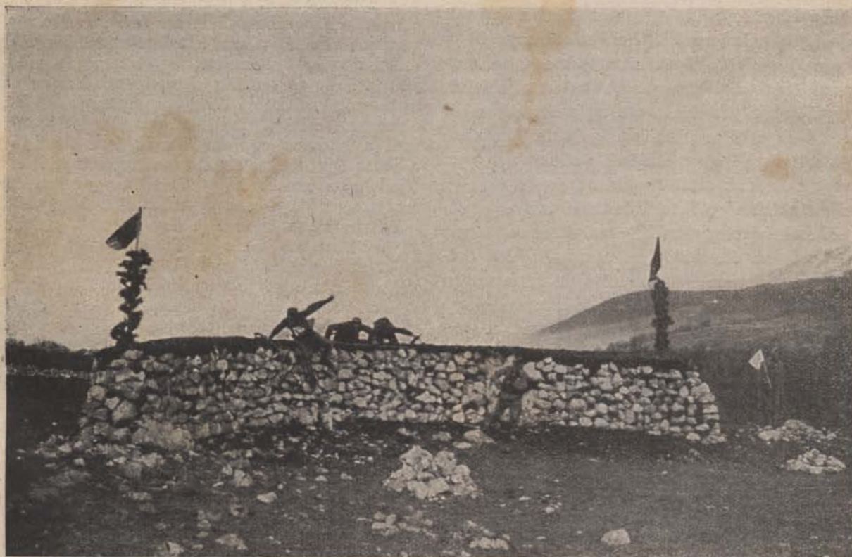
39-es bakáink sportolnak a front mögött. — 1. A lovasjáték résztvevői. — 2. Akadályverseny.