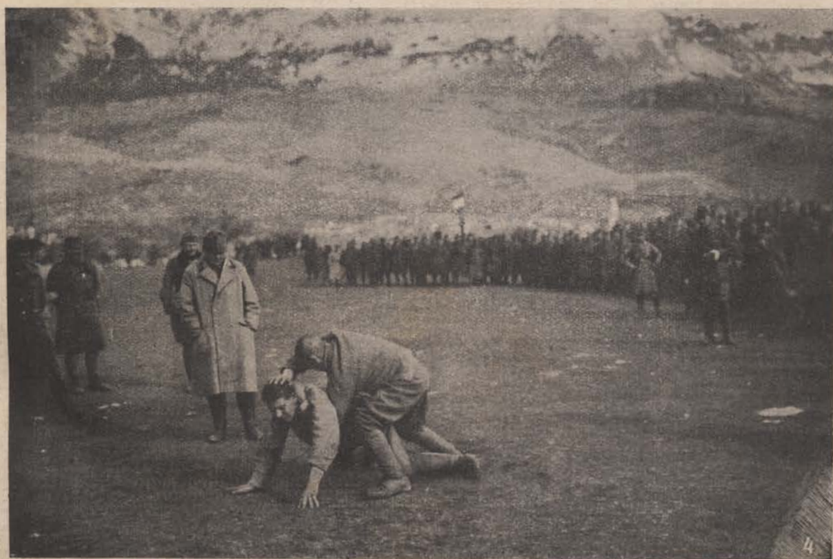
39-es bakáink sportolnak a front mögött. — 3. Magasugrás. — 4. Dijbirkózás.