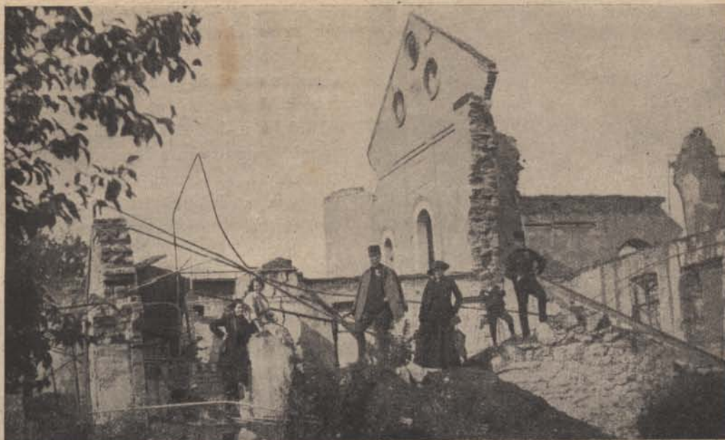
A zborói zsidó fürdő és templom romjai.

Mit volt tehát mást tennie, ő is beállt a harcosok sorába, elővette Manlicher fegyverét, s azzal szedegette le a muszkát. Ezen lövöldözés közben észlelte, hogy saját csapatunk egyik szárnya elöretör. A harc hevében észre sem vették ezt társai, s a sűrű ködben és félhomályban mozgó alakokra azt hitték, hogy azok az ellenség katonái. Fegyvereiket tehát ezek felé irányították, s a tüzelést ezen irányban folytatták. Szerencsére tábori csendőrünk észrevette a tévedést, kiugrott a lövészárokból, s jóllehet feléje az ellenség is lövöldözött, saját felelősségére társainak a «tüzet szüntess»-t vezényelt. A parancsnok álmélkodva kérdezte, hogy miért teszi ezt. Tábori csendőrünk feltárta a tévedést, s a valóságról való meggyőződés végett kiküldött járőrök tényleg észlelték, hogy az ellenségnek nézett alakok a szárnyunkról előnyomuló saját katonáink voltak, kik így a tábori csendőrnek köszönhatték, hogy saját csapatunk tüzelése el nem pusztította őket.