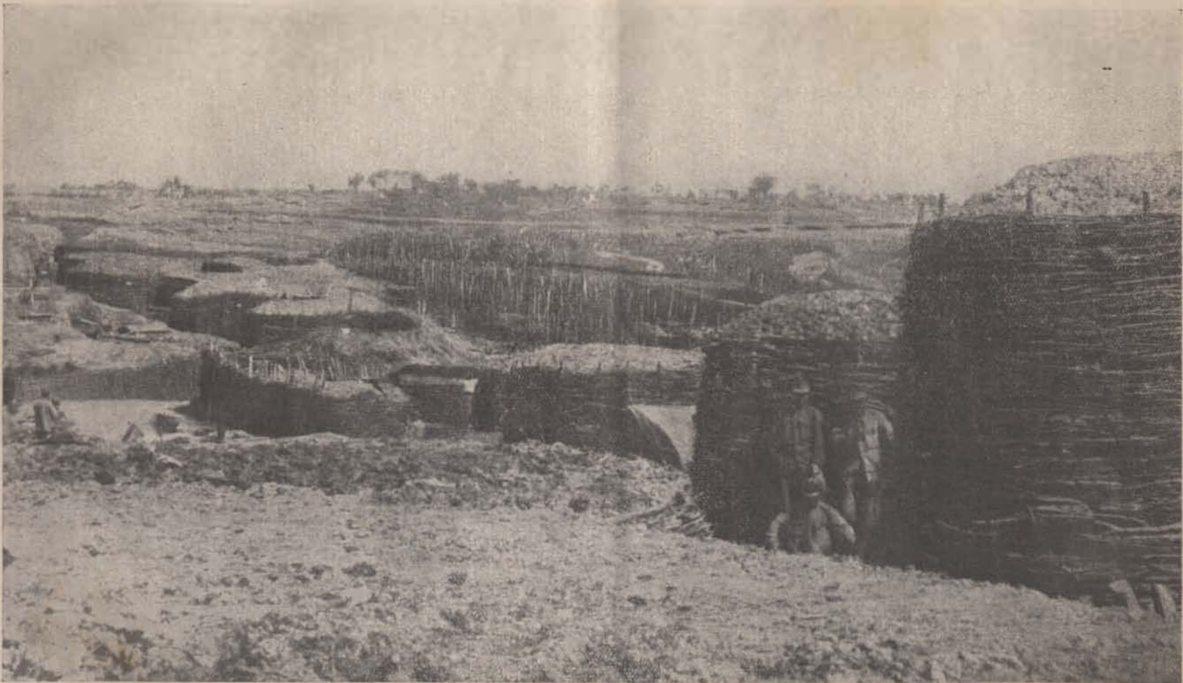
Az olasz harcterről. — Lövész- és futóárkok moesarak között.