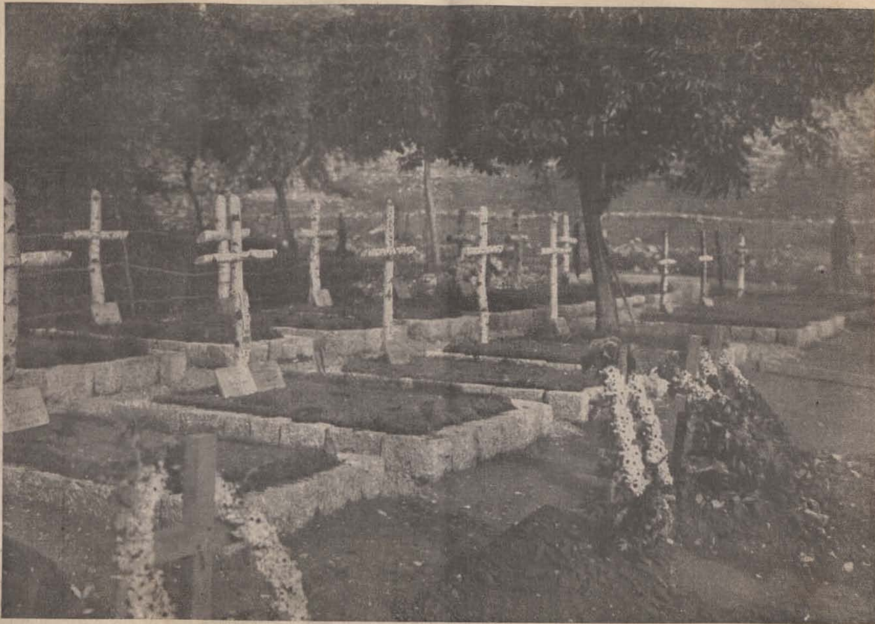
Az olasz harcztérről. — Temető a Plava tővében.