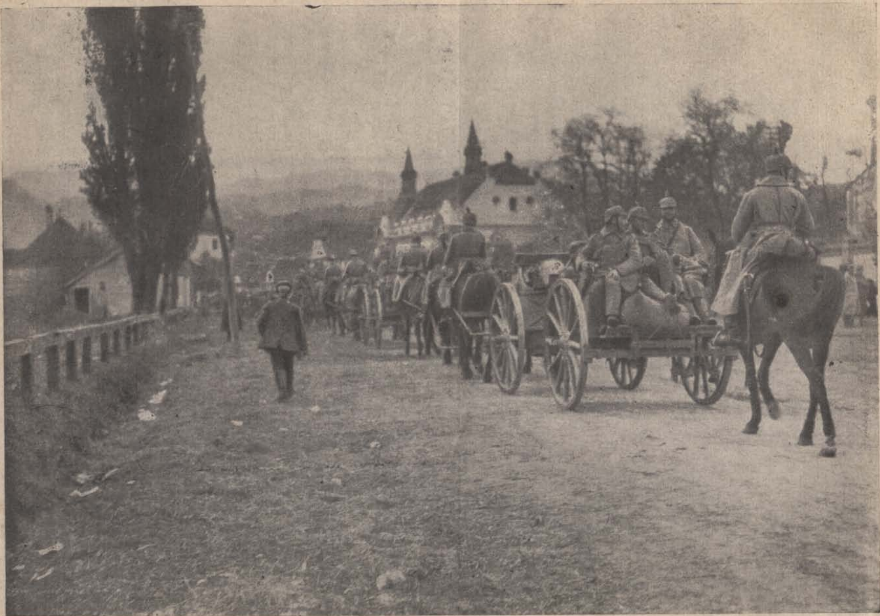
A románok kiűzése Erdélyből. — Német tüzérség bevonulása Brassóba.