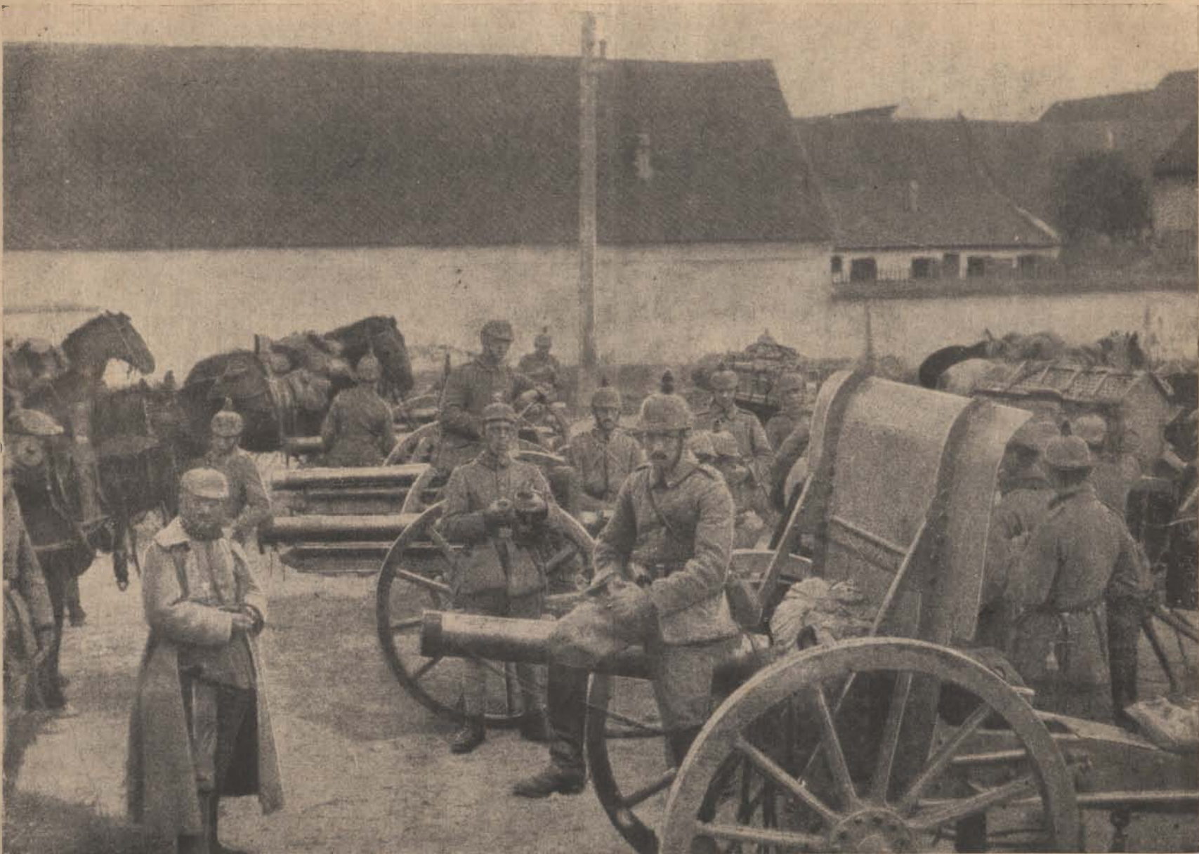
A románok kiűzése Erdélyből. — A brassói harcokban zsákmányolt román ágyuk.