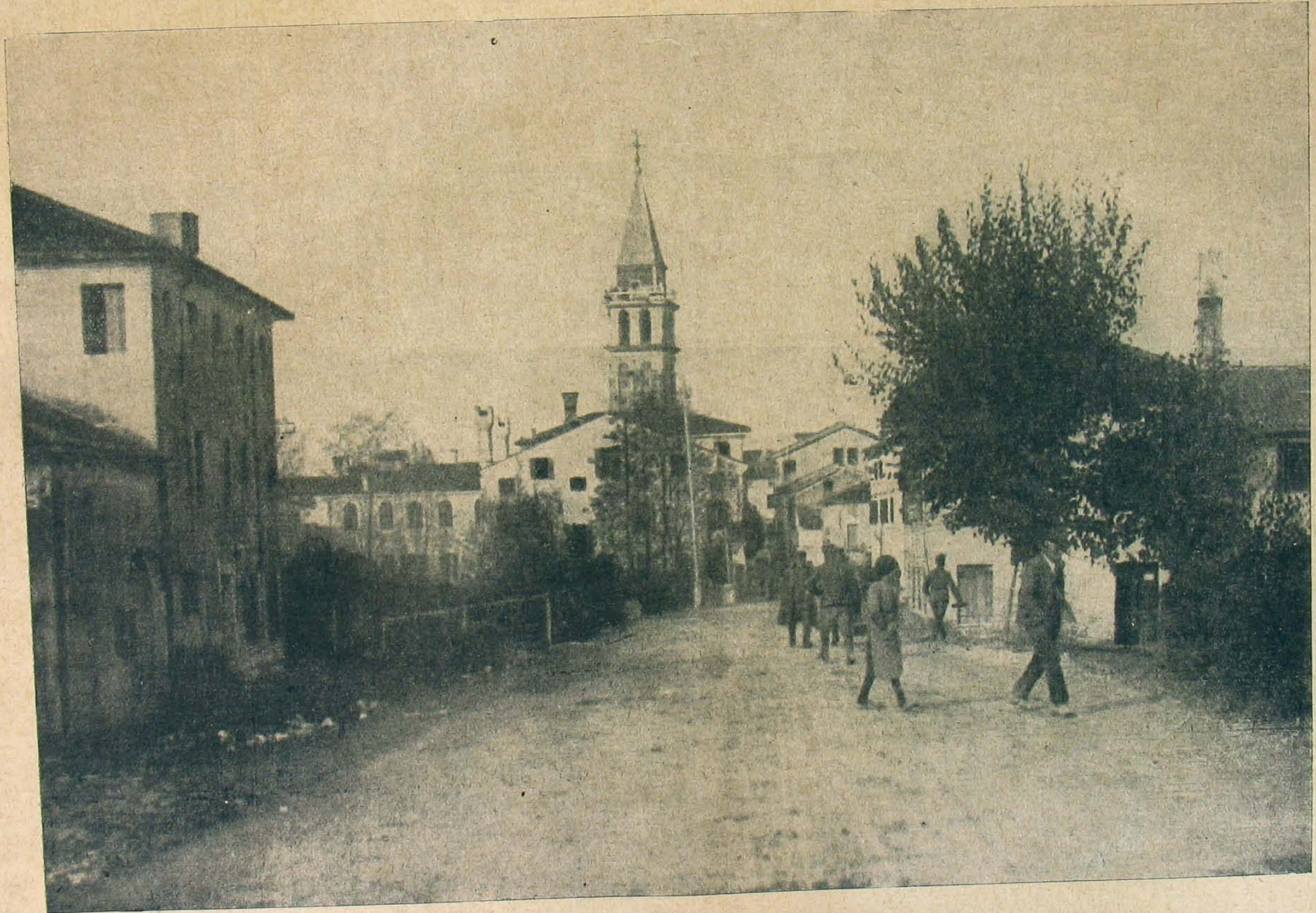
Az aquilejai harangtorony, a melyből az olasz király Triesztet szokta volt nézni.