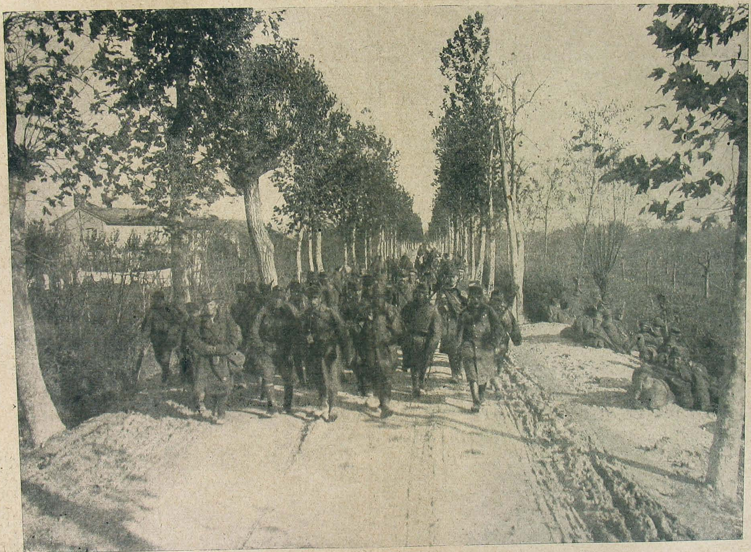
Magyar bakák a velencei síkságon.