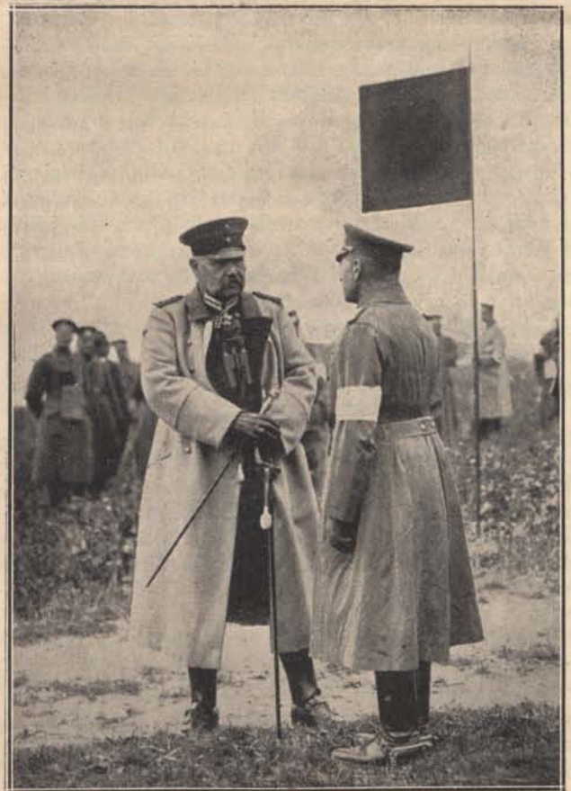
A német hadgyakorlatokról: Hindenburg birodalmi elnök a főhadiszálláson.

A múlt század közepe óta már a bűnügyi nyomozóeljárás alatt a nyomozók részéről a bűncselekménnyel gyanúsítottakkal vagy a tanúkkal szemben tanúsított ke-