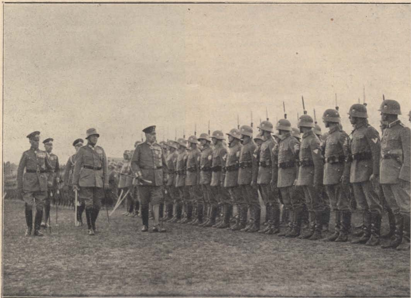
A német hadgyakorlatokról: Hindenburg birodalmi elnök megszemléli a csapatokat.

gyetlen bánásmódot szigorúan büntették, már amennyiben az tudniillik napvilágra került. Mert ez elég ritkán következett be, a nyomozóközegek gondosan örködték azon, hogy egymást el ne árulják, a köznép köréből pedig nagyon nehéz volt ilyesmire tanukat állítani. Arthur Griffiths említi fel azt az esetet, hogy 1855-ben a kalkuttai bíróság érzékenyen megbüntetett egy darogah -t (nyomozóeljárás vezetőjét) és ennek embereit, akik egy szerencsétlen gyanúsítottat oly módon iparkodtak rábírní beismerő vallomásra, hogy a kezeit a háta mögött összekötötték, majd a csuklójánál fogva kötéllal felhúzták a háztetőnek egy gerendájára. Természetesen a boldogtalan a rettenetes kínok alatt vallott, mint a parancsolat, ámbár, mint aztán kiderült, semmi legkisebb része sem volt a reá erőszakolt bűncselekményben. Egy másik ilyen darogah meg azért nyerte el méltó büntetését, mert egy jobb sorsra méltó — valójában teljesen ártatlan — gyanúsítottnak a kezeit és lábait együvé kötöztette, aztán a térdei alá egy erős fabotot húzatott keresztül s az így teljesen tehetetlen és összekucorodott embert, a fabot két végét egy-egy rendőr tartva, teljes erővel a falhoz csapkodtatta.