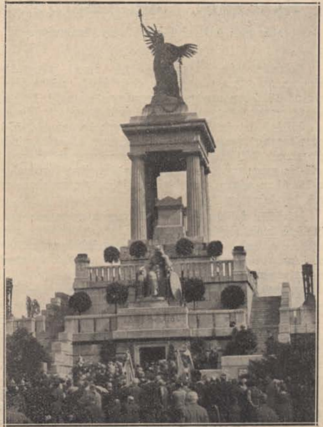
Ünnepség Kossuth Lajos mauzóleuma előtt születésnapjára. Lord Rothermere is elküldötte koszorúját.

Az elméleti alapon dolgozó és a kriminalisztikát is lélekkutató módszerrel kezelő tudósok azonban nem elégszenek meg ezzel a magyarázattal. Mint ahogy az elemi grafológiában is a grafológusok az írásról alkotott összbeművelés mellett analizisüket az írásforma, az íráskép dültése és kiterjedtsége, a betűk árnyékolása és kapcsolása, az írássebesség és folytonosság, a térbeosztás és egyes betűk jellemző vonásai alapján állítják fel, úgy szeretnék a bűnözők írásait is valamilyen formában csoportosítva, beskatulyázva együtt látni. A drezdai államrendőrség bűnügyi osztályán évek