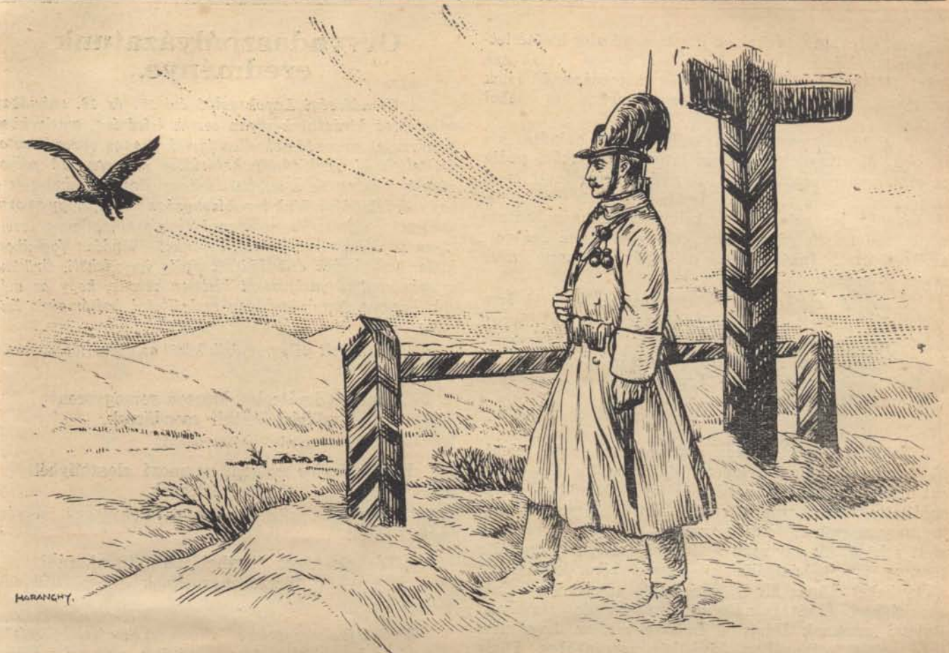
Mikor megyünk már?!...