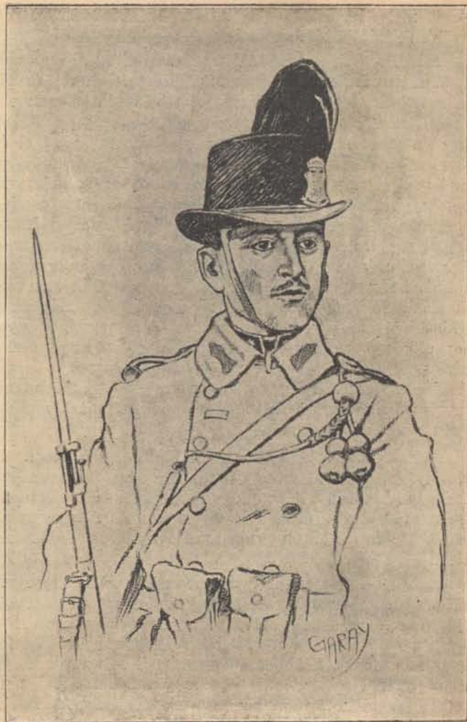
Magyar csendőr. (Garay Akos rajza.)

Közöltem Tellerrrel, hogy előadása gyanús és felszólítottam, hogy az állítólagos szarvas agancsát mutassa meg nekem. Felszólításomra előadta hogy az