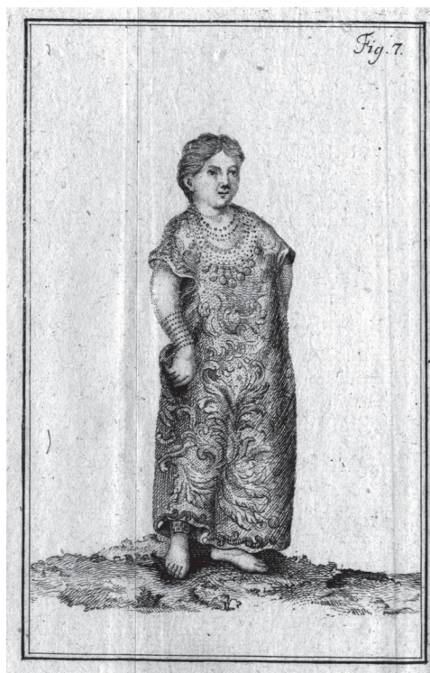
Baure indián nő Éder Ferenc Xavér rajzán.

Ahogy Éder Xavér Ferenc eredeti könyve sem latinul, sem magyarul nem jelent eddig meg. Talán azért, mert nem ivott az örök élet italából? Talán azért, mert mi nem ittunk belőle.