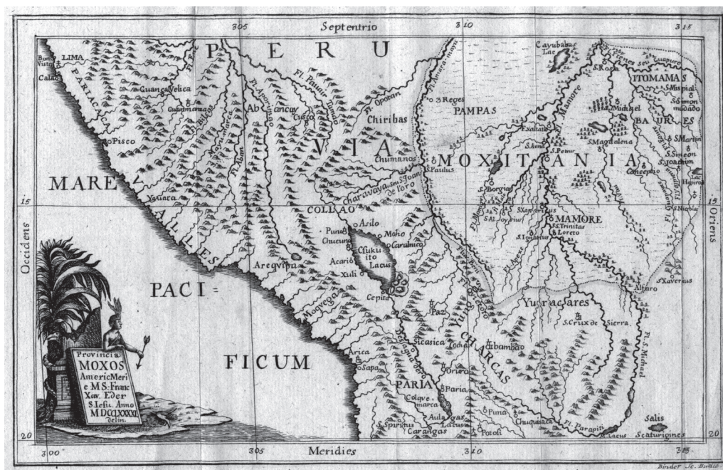
Az Éder Xavér Ferenc által rajzolt térkép

Ahhoz azonban, hogy ezt az egyetlen utazást megértsük, két másik atyával is meg kell ismerkednünk. Az egyikük Zakarjás János, aki az említett hajóval, 1750. október 12-én Cádizból együtt utazott Éder Xavér Ferencsel az Újvilágba. Panamán átkelve, 1751-ben érkeztek meg Peruba, s ezen utazás alatt jó barátságot kötöttek. Ám, míg Éder Xavér Ferencsel a rendtartomány főnöke közölte, hogy az Andok keleti oldalán elterülő Moxitániának nevezett vidékre kell mennie, a Mamoré folyó középső szakasza mentén élő mojo indiánok közé, addig Zakarjás még sokáig Lima környékén maradt. A két barát, Éder és Zakarjás között a kapcsolat ezután sem szűnt meg, s míg Éder megismerte a mojo, a more, az itonama és a chiriguano indiánok világát, megrajzolta Moxitania tartomány térképét, Zakarjás barátságot kötött nála idősebb atyákkal, például Réz Jánossal, és szoros levelezést folytatott a Magyarországon maradt Bartakovics Józseffel és Kéri Ferencsel. Ezek alatt az évek alatt alakította ki sajátos titkosírását, amikor is latin szövegekbe rovásírással magyar mondatokat szőtt.