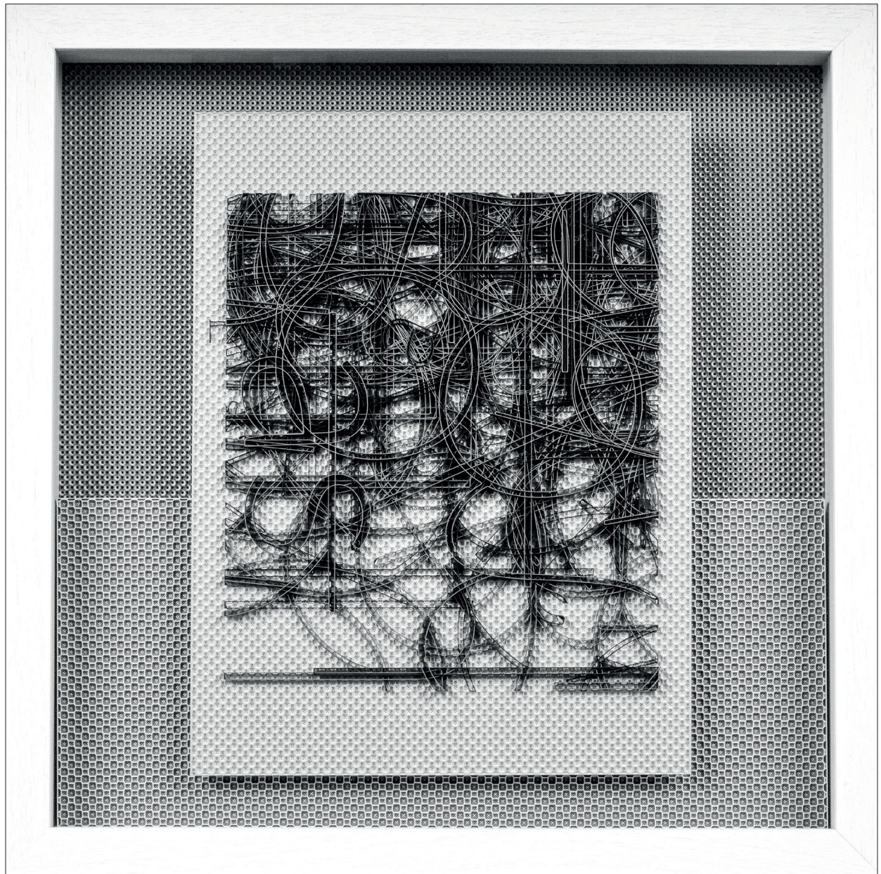
Szegedy-Maszák Zoltán: Vigyor macska nélkül 3D nyomat, PLA, 2024, 50x50x7cm