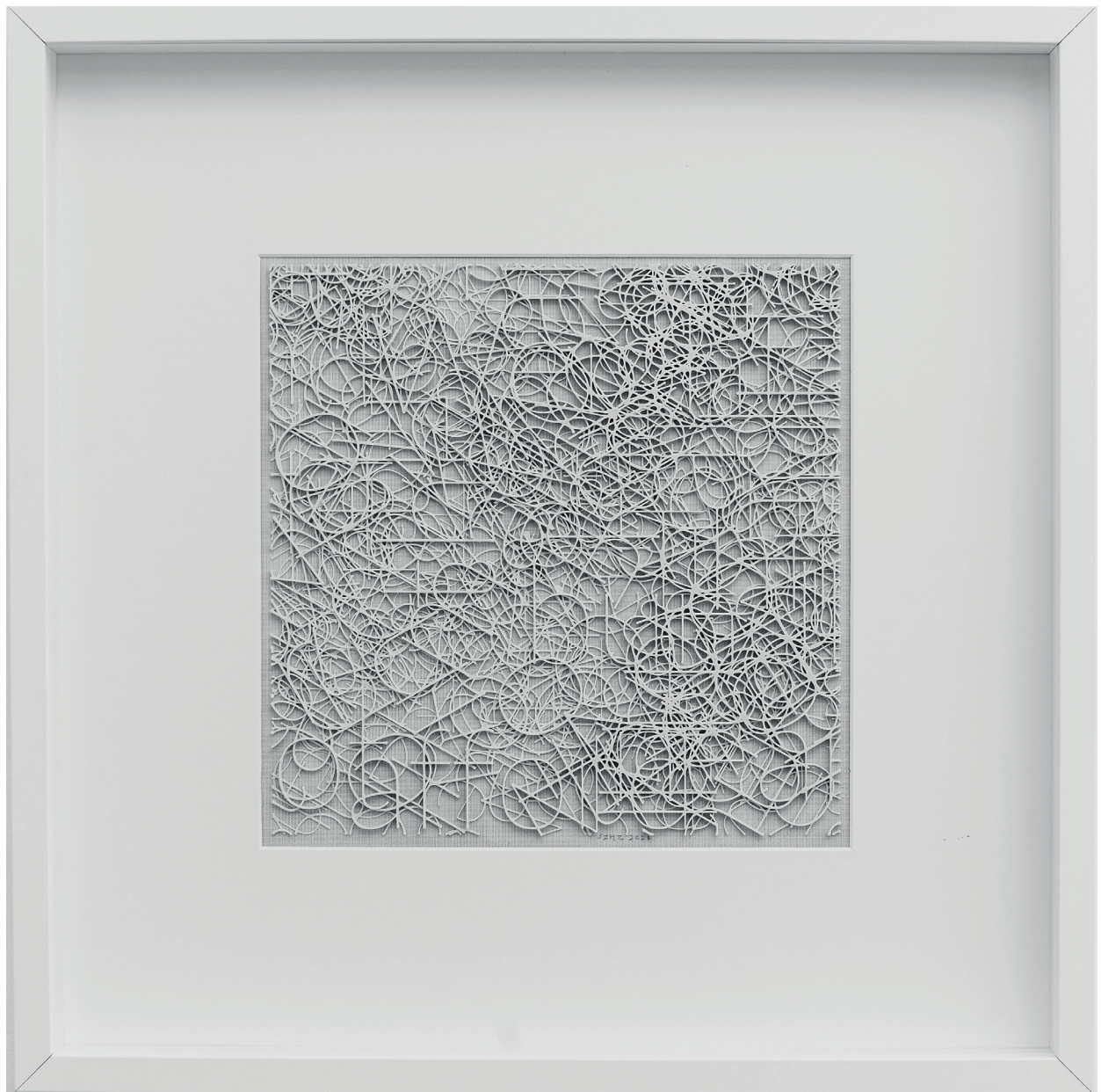
Szegedy-Maszák Zoltán: Nehezen olvasható mű 3D nyomtatás, PLA, 2020, 50x50cm