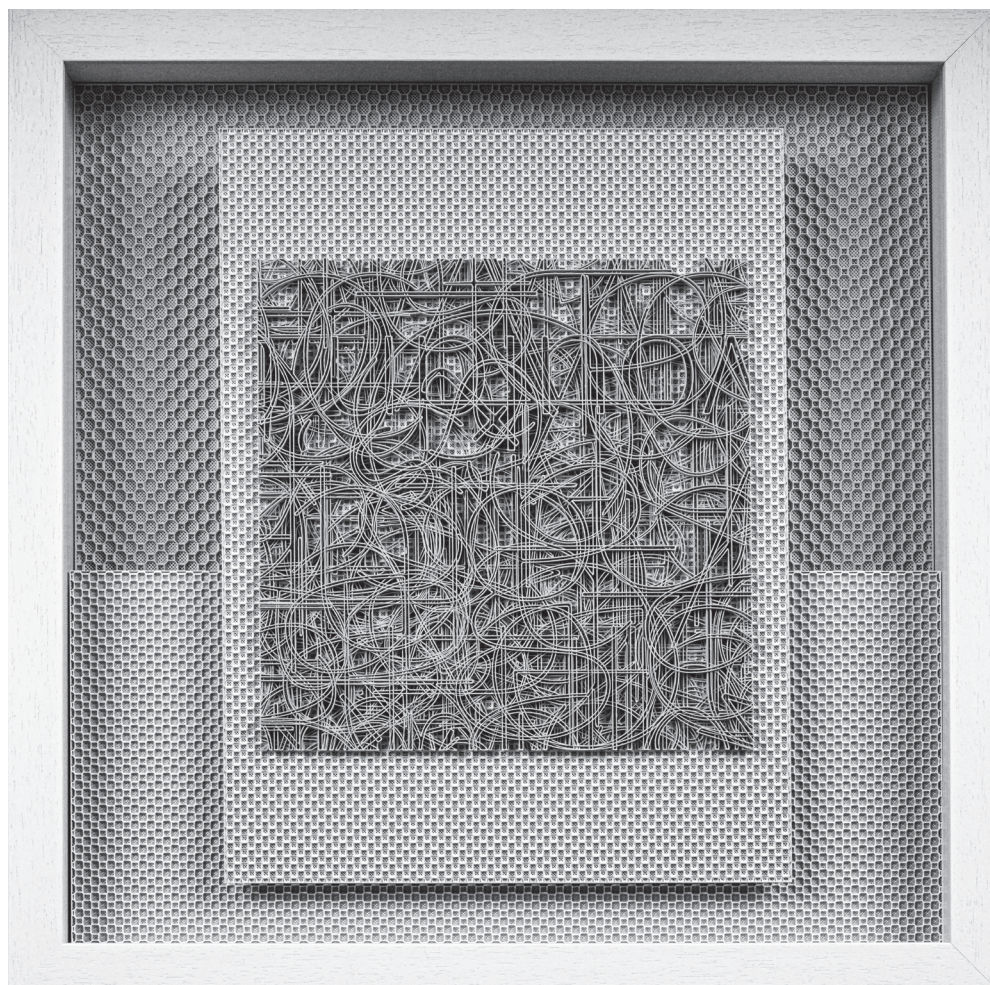
Szegedy-Maszák Zoltán: Vigyor macska nélkül 3D nyomtat, PLA, 2024, 50x50x7cm

Swift Gulliverjének vonatkozó szövegrésze korábban a Vizuális kommunikáció – Jonathan Swift tiszteletére [2008/2018] című interaktív installáció alapjául szolgált. De míg a Vizuális kommunikáció ban az absztrakt, kódokat rejtő „képeket”, azaz a QR kódokra emlékeztető geometrikus ábrákat egy kamera segítségével olvassa a számítógép háromdimenziós virtuális képekké, addig a Nehezen olvasható műveknél az „olvasás” eredménye egy olyan másolási folyamat, melyben az algoritmusok szövegolvasása nyomán a betűkből álló fizikai tárgyat a 3D nyomtató állítja elő. Mindkét helyzetben a kódolás – dekódolás kérdésének tere nyílik meg, de a két eltérő eljárás során két teljesen eltérő alkotás jön létre. Az számítógépbe betáplált utasításoknak megfelelően, a nyomtató a szövegben szereplő egyes szavakat morfológiai és hangtani szempontok szerint vastagabb vagy vékonyabb réteggént, kisebb vagy nagyobb méretben, horizontális vagy vertikális, esetleg átlós helyzetben nyomtatja ki, miközben a szöveg egyes részei átfedésbe kerülnek. A számítógépes nyelveket is lehetővé tevő, logikán alapuló kód, mely az algoritmusokat