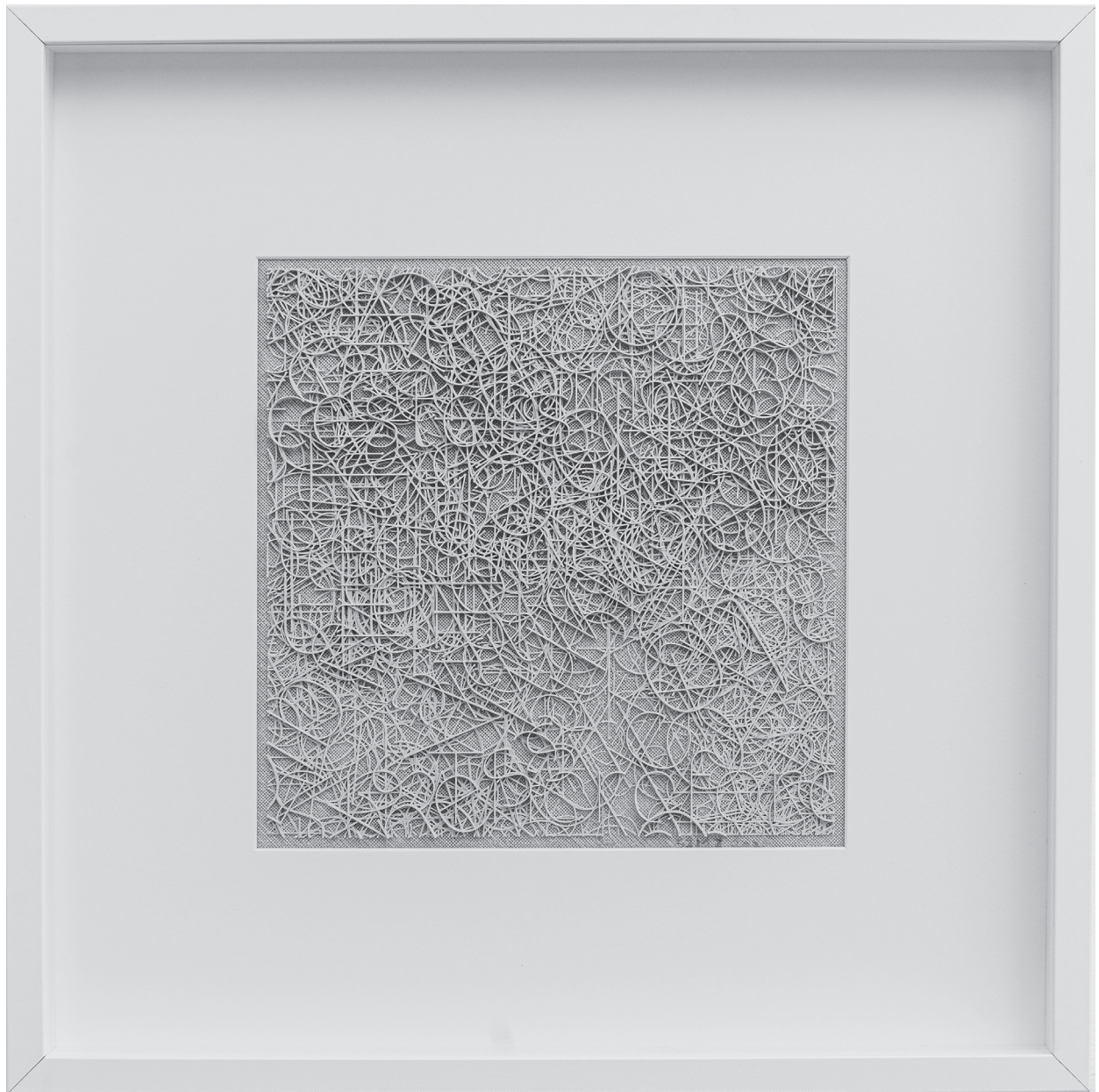
Szegedy-Maszák Zoltán: Nehezen olvasható mű 3D nyomtat, PLA, 2020, 50x50cm