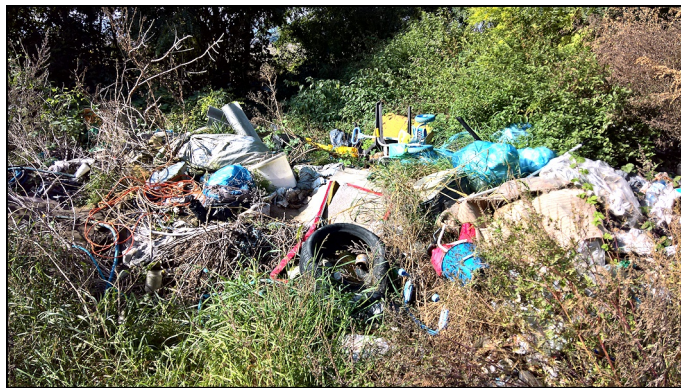
Illegális szemétkerakó a Kutyahegy tövében

Sajnos itt érhetjük el falunk egyik szégyenpontját, egy illegális szemétkerakót, melynek tartalma néha elárulja a szemelők kilétét is. Jelenleg nem látok esélyt arra, hogy ezeket az embereket a törvény elrettentse az efféle környezet-szennyezéstől. Egy kamera felállítása, a személyiségi jogokra hivatkozva olyan procedúrával jár, hogy nem is fognak bele. Egy megoldást látnék, hogy a gyerekeket elvinni, s megmutatni nekik, hogy milyen kárt tudnak tenni az emberek, s talán idővel más felnőttek válnának belőlük.