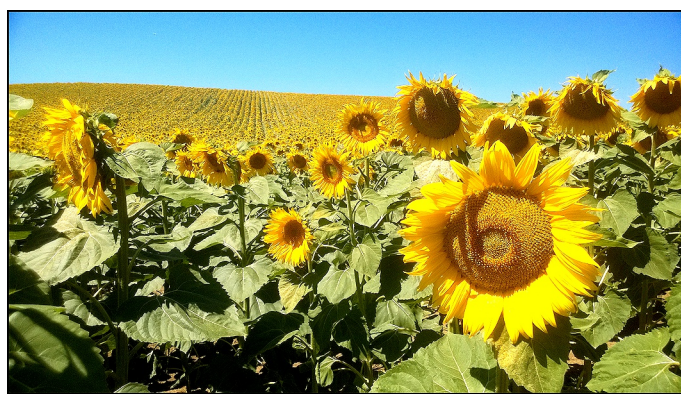
Gyönyörű napraforgók Tinnye határában, ameddig a szem ellát

Megszámlálhatatlanul sok a probléma községünkben a mezőgazdaság területén. Keresnünk kell a jó megoldást, hogy a város közelsége, a rendelkezésre álló termőföld, az emberi szorgalom nyújtotta lehetőségek ne maradjanak kihasználatlanul, ellenkezőleg: a fejlődést, a jólétet szolgálják.