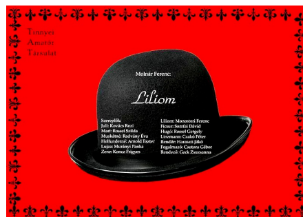
A Liliom c. előadás plakátja

Annak idején a gyerekekkel az iskolában, ahol dolgoztam, csináltunk egy bábjátékot. Az volt a gyakorlat, és ennek drámapedagógiai háttere is volt nyilván, hogy zsinórokat kötöttünk egymásra és az egyikük volt a báb, a másik az irányító. Így született meg „Az asszony meg az ördög” című mese.