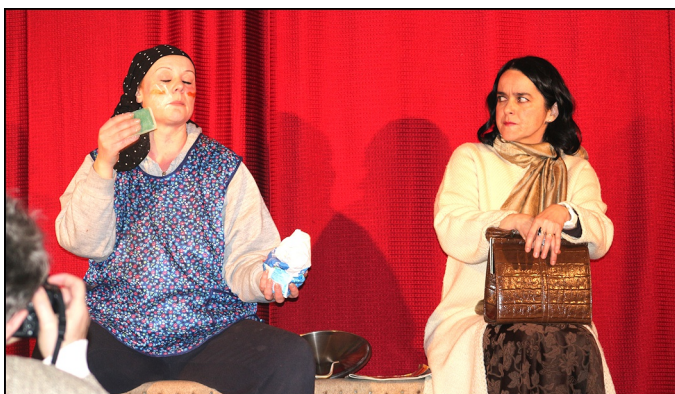
A Buszmegálló c. jelenet előadása a tinnyei művelődési házban