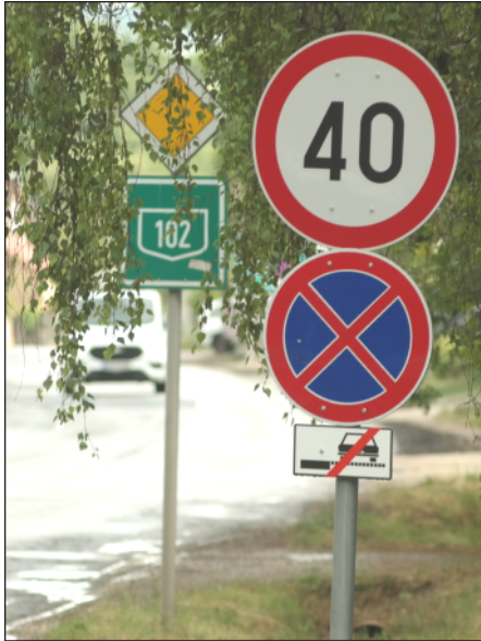
7. ábra: Megállni tilos tábla a Bajcsy-Zsilinszky utcában

Március végén Tinnyén a Bajcsy-Zsilinszky úton a jászfalusi és a piliscsibai nagy elágazás között megállni tilos táblák lettek kihelyezve. A gépjárművel megállni szándékozók a Pohl udvar előtti parkolóban (a volt Zöli murvázott udvarán) tudnak várakozni – ahogy eddig is.