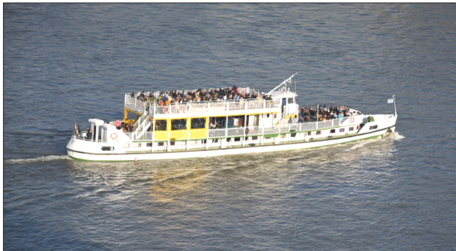
5. kép: Dunai kiránduló hajó