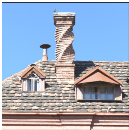
1. kép

Tavaly előtti felhívásunkra 2019 tavaszán 13 helyi vállalkozó jelzett vissza, akiket egy nap alatt sikerült végiglátogatni egy az égéstermék elvezető berendezések ellenőrzésére szakosodott cég munkatársával. Az együttműködésnek köszönhetően az összefogó vállalkozások mentesülhettek a kiszállási díjtól és a többi kéményseprő ipari vállalkozáshoz képest jelentősen kedvező árszabással tudták le a vállalkozások számára díjköteles ellenőrzést.