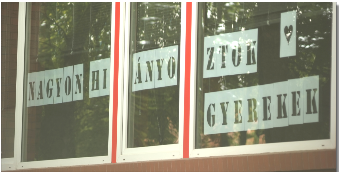
8. kép: Felirat a tinnyei Kossuth Lajos Általános Iskola ablakában

Természetesen fel vagyok készülve arra, hogy jelen írást olvasva a fent nevezett csoportok adminisztrátorai válaszul felfüggesztik majd a tagságomat. Szívük joga, nem haragszom miatta. De ha ez így lesz, akkor legalább egyértelművé válik, hogy Tinnyén a magánszemélyek által indított online platformokon is virágzik a politikai és érdek alapú cenzúra, valamint a kettős mérce. ■