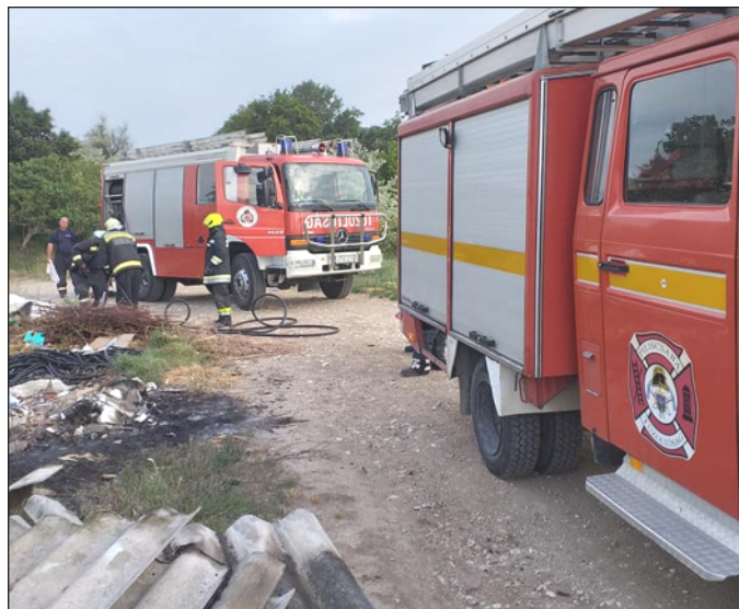
2. kép: Kivonuló tűzoltók Tinnyén