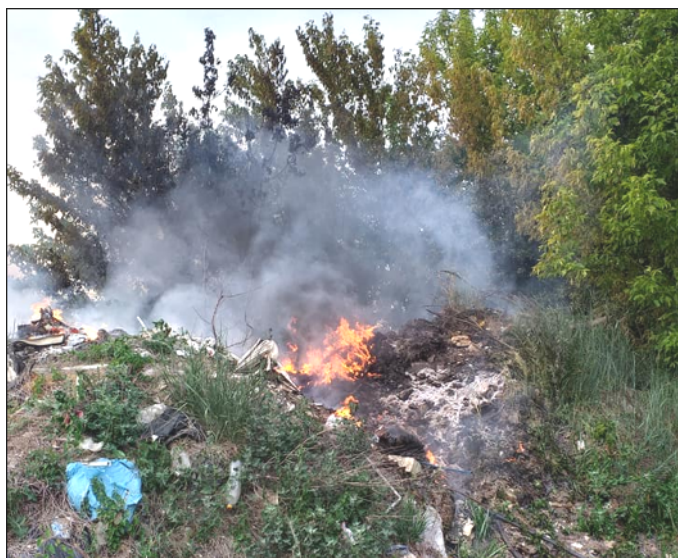
3. kép: Lángoló illegális szemétdomb Tinnyén