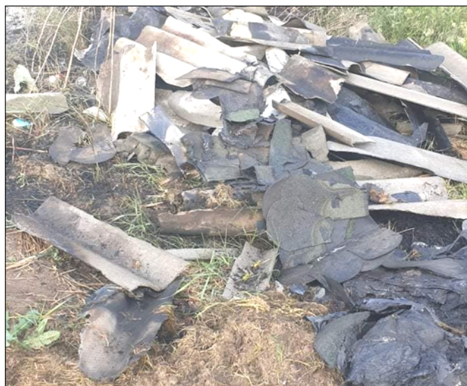
4. kép: Megégett pala és kátrányos zsindely