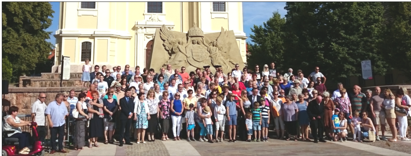
2. kép: Homokszobor avatás Tata 2020. július 4-én

– Csepelen a Daru dombon készíték egy Szent István büsztöt (mellszobrot) az augusztus 20-ai ünnepi rendezvényekre a helyi önkormányzat felkérésére. ■