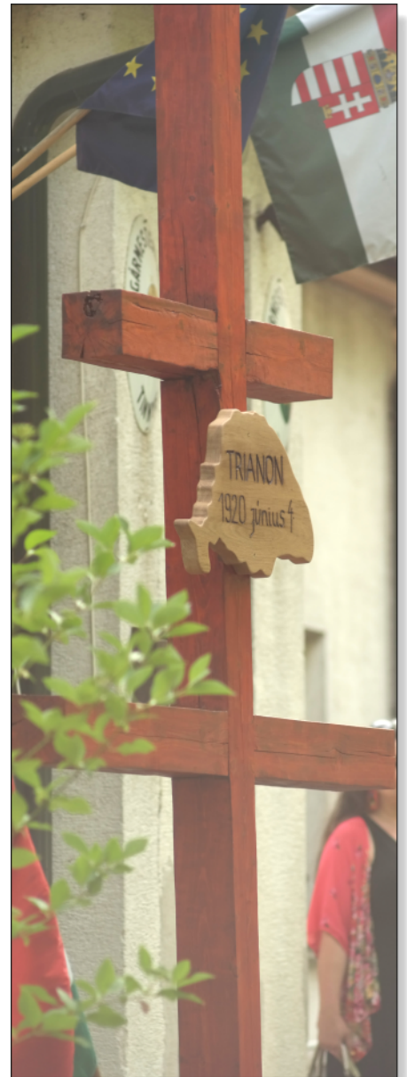
3-4. kép: Trianoni emlékmű Tinnyén 2020. június 4-én