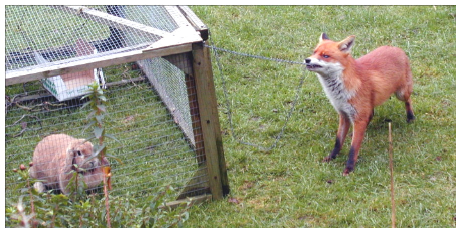
7. kép: Urbanizálódott vörös róka éppen egy házinyúlhoz próbál hozzáférni

A Tinnye (immár) belterületi utcáin és ingatlanjain megjelenő vadakkal szembeni védekezés említésekor gyakran megosztja a lakosságot a kérdés, hogy vajon van-e jogunk intézkedni ellenük? Hiszen egyértelmű, hogy nem mi, emberek vagyunk itt őshonosak, hanem ők. Arról viszont, hogy egy területre hogyan tehetjük be a lábunkat, érdemes lenne inkább a korabeli döntéshozókat megkérdezni, nem azokat számon kérni, akik ennek hatásait most élvezik vagy elszenvedik. Merítsünk a 3. oldalon olvasható Volt egyszer egy Trianon című írásban idézett felszólalók gondolataiból és próbáljunk meg megbékelni a múlttal, tekintsünk inkább a jövőbe!