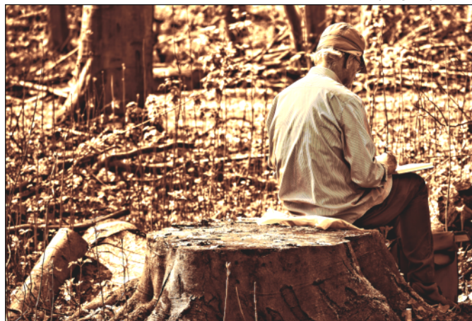
6. kép: Idős művész a természetben