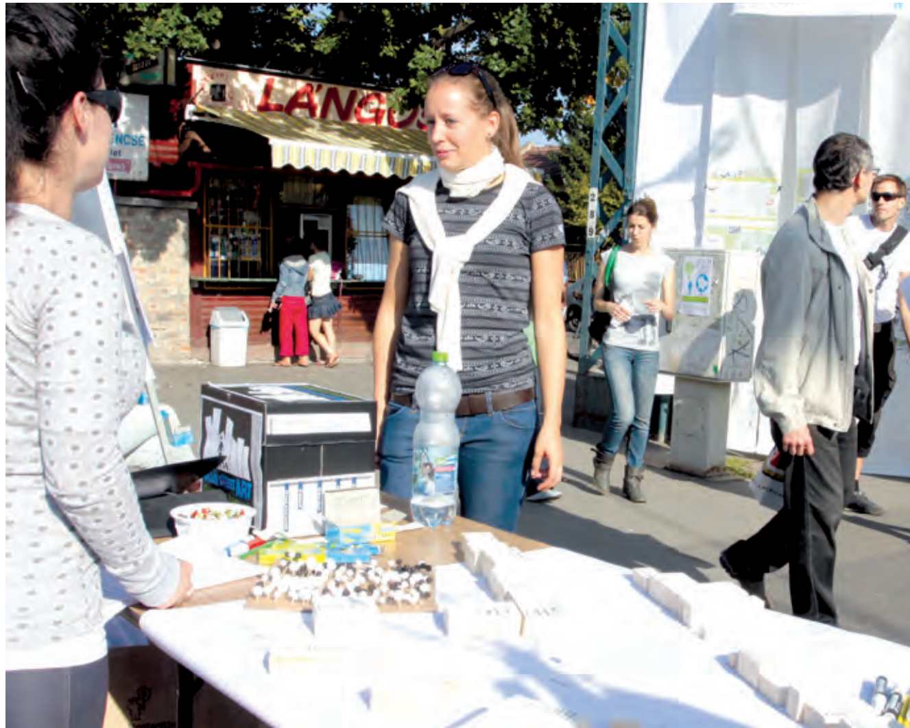
A Béke tér átalakításáról tavaly bemutatott ötletpályázat jó alap a fejlesztéshez

A lakásrendelet módosításával teremt új pályázati lehetőséget az önkormányzat azok számára, akik nem tudják fizetni devizaalapú lakáshiteleket.