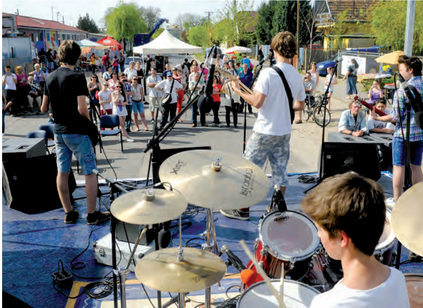
Bitangok váltották a Helyszínelőket, és együtt megalapozták az imrei built

A múlt évhez képest a program több pontját módosították. A főzés kimaradt – erre más alkalmak kínálkoznak a kerületben –, viszont úgy vált szakmaibbá a rendezvény, hogy közben sokszínűbb is lett. Immár szakmai találkozót is magában foglaló délutánról beszélhetünk, amelynek keretében a helyi vállalkozók lehetőséget kaptak arra, hogy kötetlen keretek között személyesen ismerjék meg egymást, és bemutatkozzanak a közönségnek. Délután háromra készen álltak a sátrak az utca szélén és a Perge Épker Kft. tüzéptelepén, s a helyi vállalkozók bemutatkozó szórólapokkal és szaktanácsadással várták az érdeklődőket.