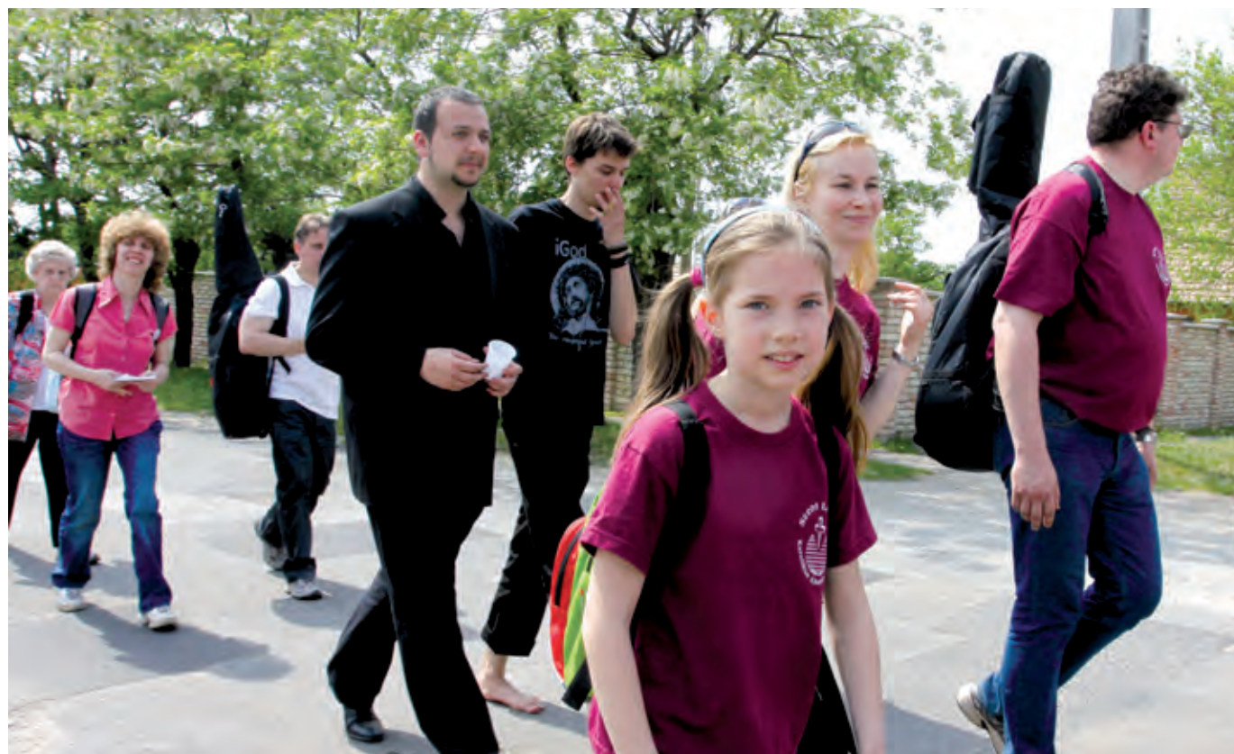
Az edzőcipőket már le lehet porolni, irány a nagy zarándoklat!

Pál-templomig mennek. Innen Rákoshegyre, a Lisieux-i Szent Teréz-plébániázarándokoknak a hívek, majd Pestszentlőrincre,