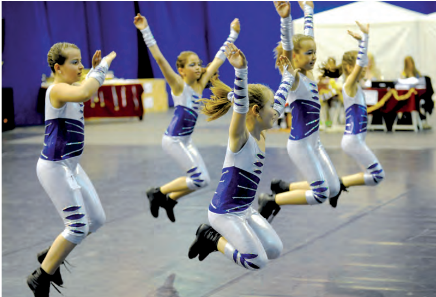
Az egész napos versenyen délelőtt a fiataloké, délután a felnőtteké volt a színpad

A Hungarian Open néven megrendezett magyarországi nyílt táncversenyen összesen 21 egyesület csaknem 460 táncosa kö-