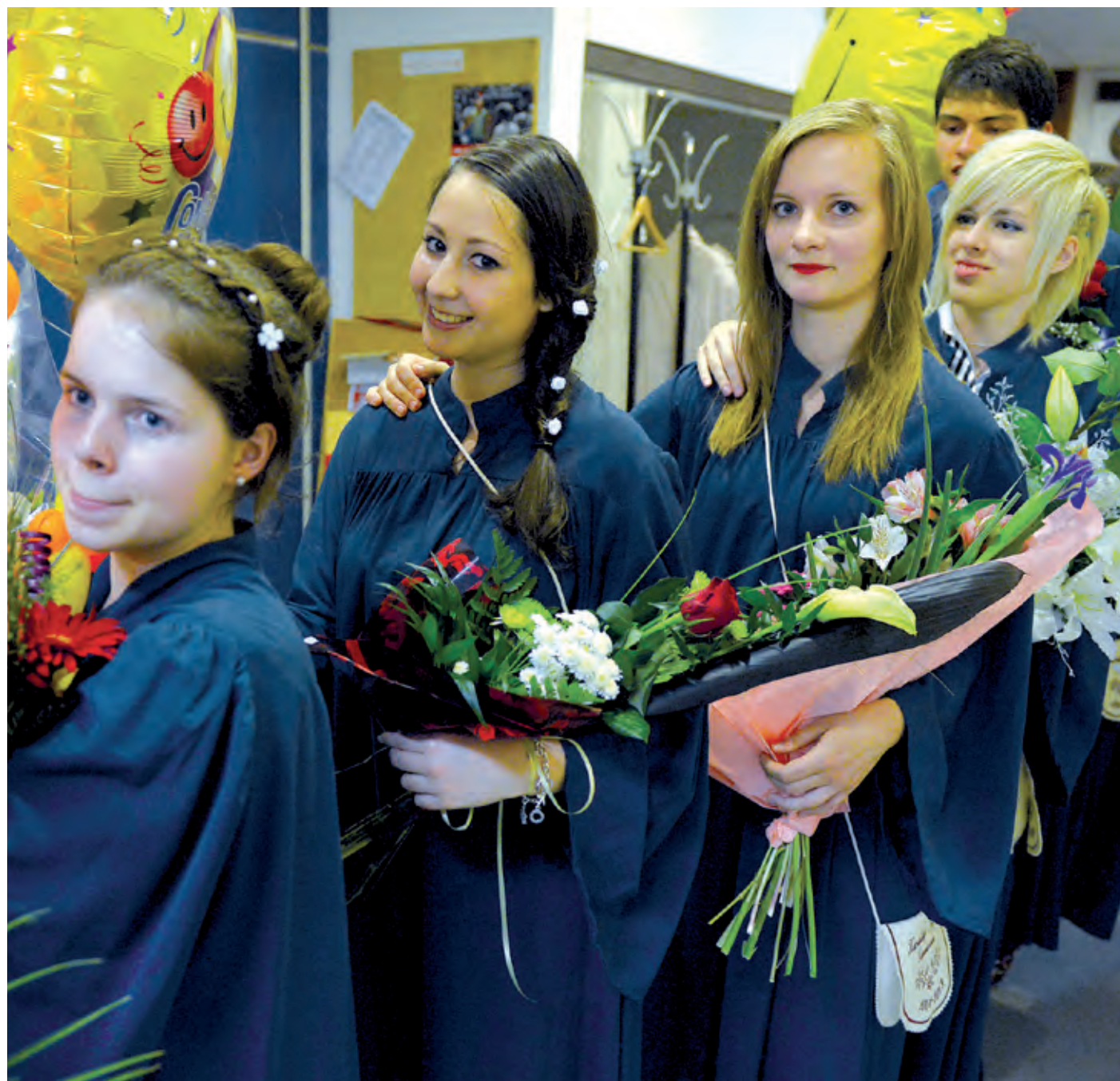
A Karinthy Frigyes Gimnáziumban még a ballagás is emelt szintű

Már az 1800-as évek elejéről beszámol néhány feljegyzés arról, ahogy az alma matert elhagyó selmeci diákok valétámenetet tartottak az akadémiai épületből: elől a balekok, vagyis az elsőévesek, akik a valétánsok