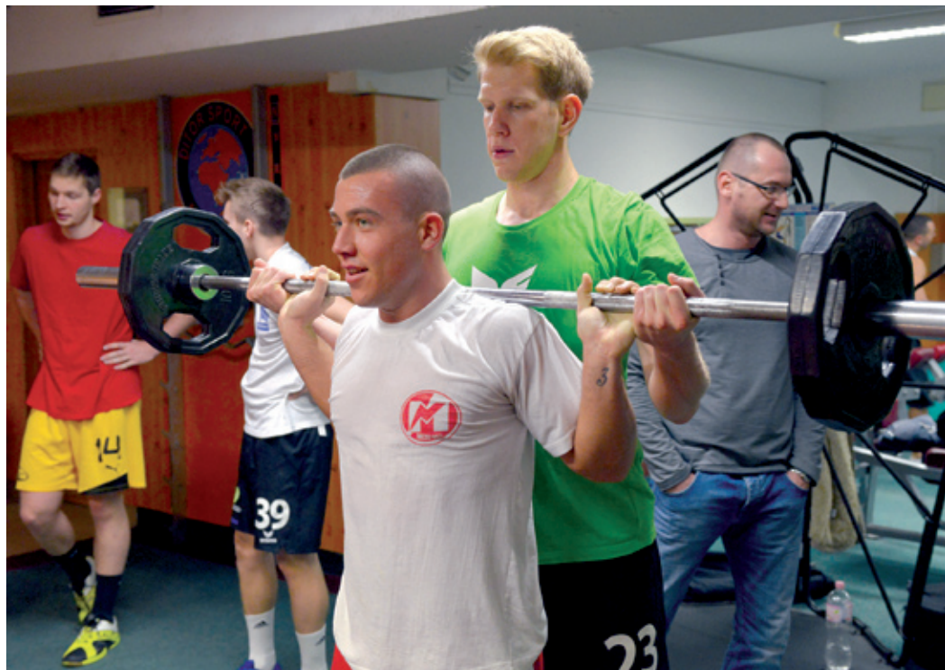
A kemény alapozás után az erőnlétben nem múlhat a siker

Január első hetében megkezdte a felkészülést a bajnoki folytatásra a PLER-Budapest kézilabdacsapata. Napi két edzéssel készül a keret a február 1-jei rajtra és arra, hogy a rájátszás során kivívja a bent maradást az első osztályban. Amint alább olvashatják, tesz is érte valamennyi zöld-fekete mezben pályára lépő játékos.