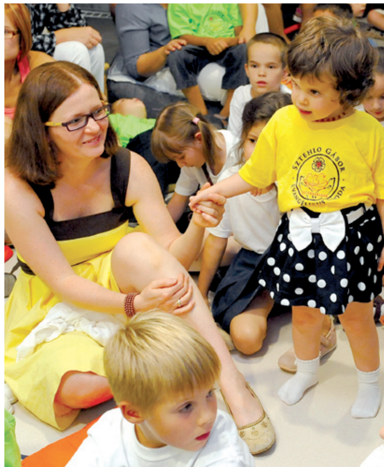
Mozgalmas napokat él át a Sztehlo Gábor Evangélikus Óvoda, Általános Iskola és Gimnázium vezetője. Akkor az intézmény forgalma, mintha már holnap becsengetnének.

Az óvodától a gimnáziumba készülőkig mindenkit várnak az evangélikusok