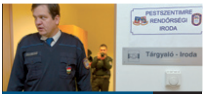
ÚJ RENDŐRSÉGI IRODA 2. oldal

A pestszentimriei iroda régóta várt rendőrségi iroda nyílt meg decemberben a felújított Imre-házban, ahol munkanapokon 10 és 20 óra között várja az ügyeltes lakossági bejelentéseket, illetve a bármilyen más rendőrségi ügyben segítséget, tanácsot kérőket. A rendőrségi iroda ugyanúgy működik, mint az ugyancsak tavaly megnyílt Havanna-lakótelepi iroda.