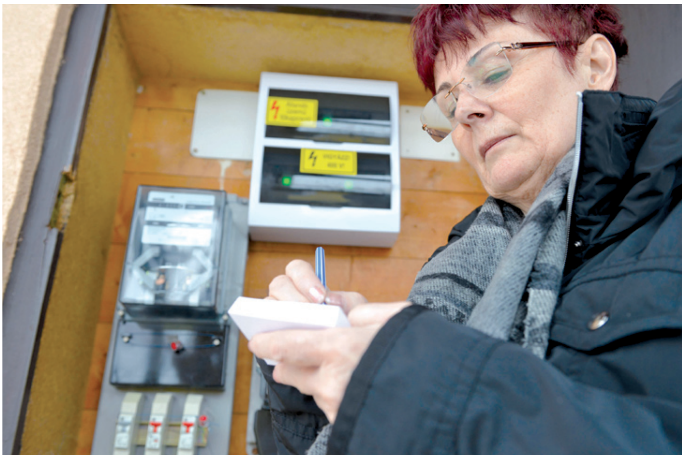
A rezsitörvény szerint a társasházaknál követhetővé és láthatóvá kell tenni a díjcsökkentések eredményeit

A törvénymódosítás után a kerületi önkormányzat úgy rendelkezett, hogy 2013 decemberétől már az önkormányzat által továbbszám-