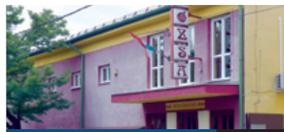
A TEHETSÉGEKÉRT 14. oldal

Számos meglepetéssel készültek a Dohnányi Ernő Zeneiskola ifjú muzsikusi a Sportkastélyban január 5-én tartott újrakezdés hangversenyükre. Ezek közül csak az egyik volt a fordított sorrend: ezúttal a fúvósok kezdtek, a szimfonikusok a második részben léptek fel. Ha megszólal egy basszus szaxofon, a hallgatóság azonnal érzi, hogy abban eleve van valami vicces.