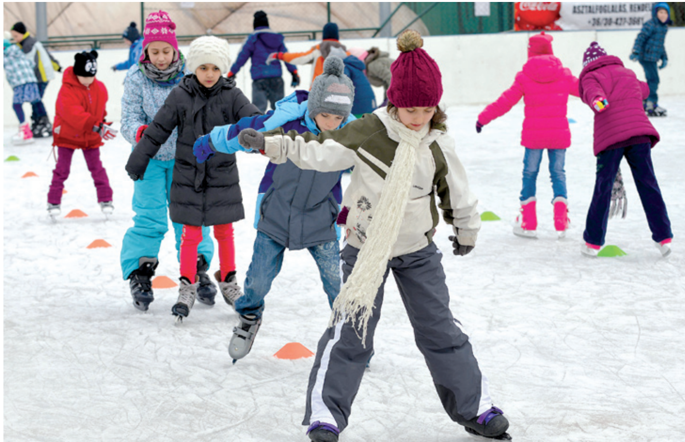
A jégpályának köszönhetően minden évben több száz gyerek tanul meg korcsolyázni

– Egy kicsit messzebből kell jönni, mint ha lőrinciek lennénk, de még mindig ez a legközelebbi jégpálya, ráadásul elég olcsó. Ha a lányokkal jövünk, általában valamelyikünk apukája vagy anyukája áthoz bennünket, de az is előfordult már, hogy buszozunk. Nagyon gyakran nem jöhetünk, de a hétfőeken szeretünk átugrani – mesélte.