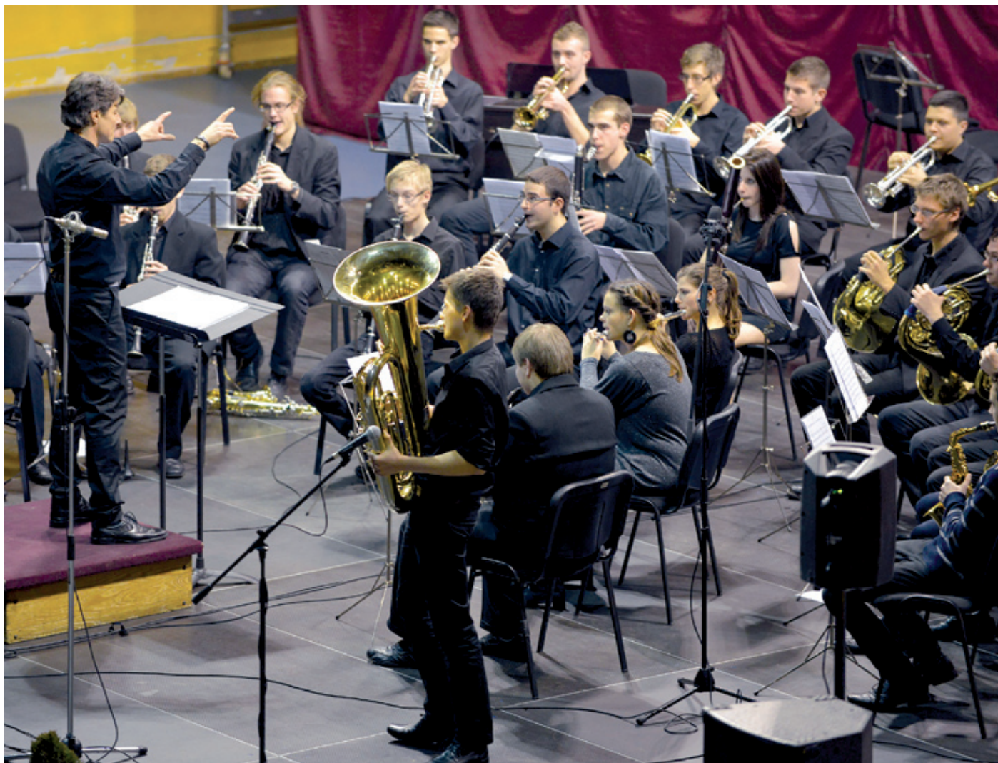
A muzsikát és a vidámságot hozták el a sötét év eleji estére a Dohnányi zeneiskola növendékei

E fordulatnak köszönhetően már a program első felében sztárok vonultak fel, ráadásul kifeje-