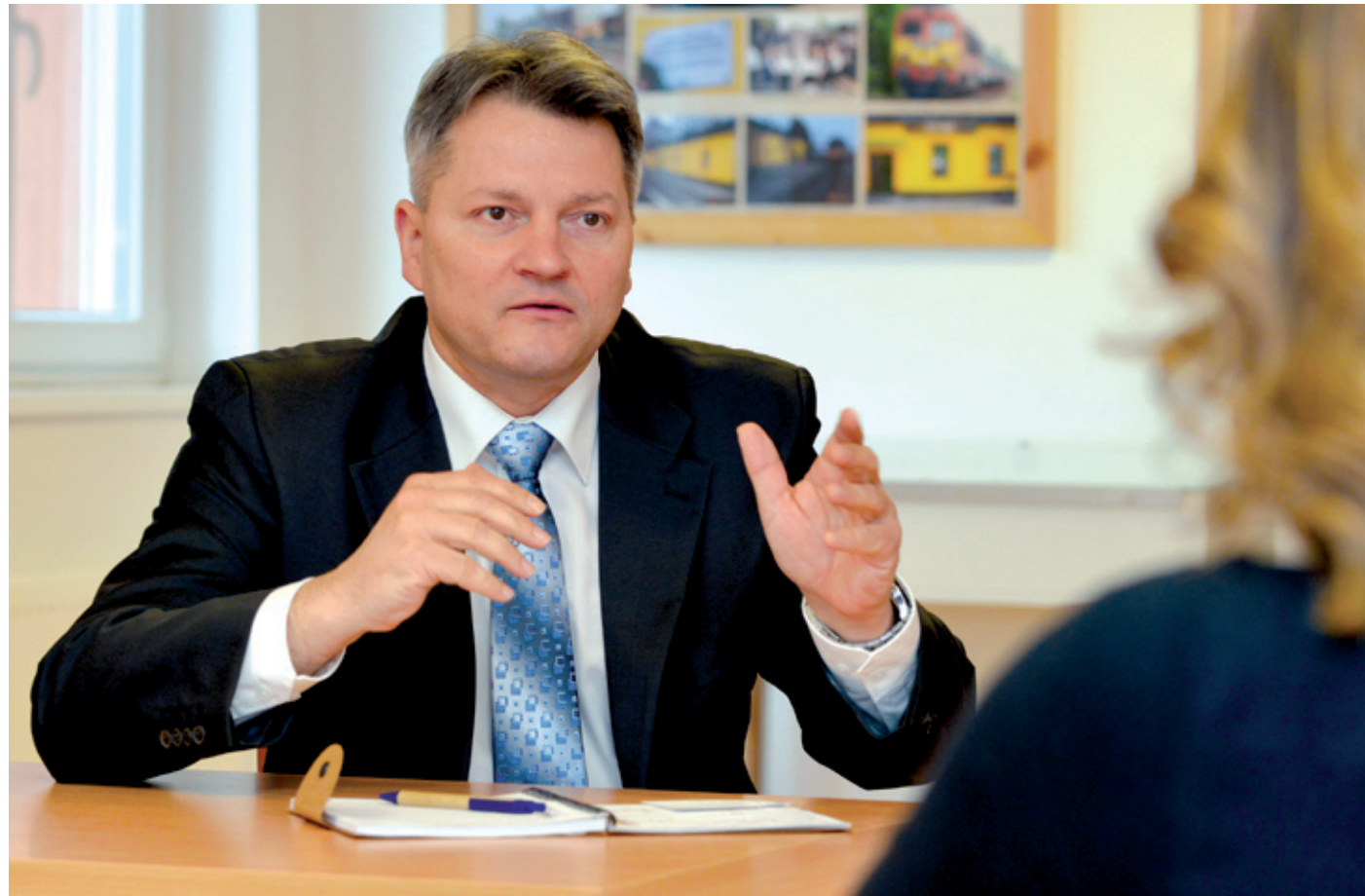
Az országgyűlési képviselő meggyőződése, hogy az év bármely napja alkalmas lehet egy jó cél kitűzésére