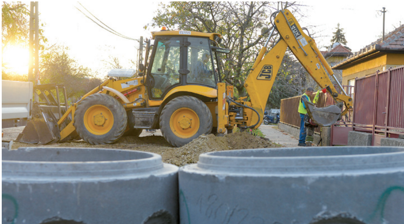
Az enyhe időjárásnak köszönhetően januárban is folyt a csatornázás

Van már olyan része a kerületnek, ahol a tervezett csatornaszakaszok több mint a fele elkészült, más – eddig teljesen