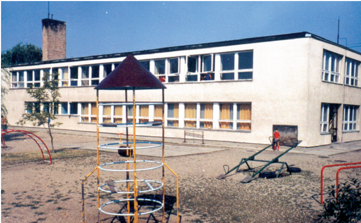
A Vezér utcai óvoda is a 70-es években épült Pestszentimrén

ben volt érezhető a fejlődés, a 60-as évek végén az 54-es busz sűrítése mellett gyorsjáratok is indultak. Az élelmiszer-ellátás siralmas helyzetén több ABC építésével javítottak. A postával szemben, az Eke utcában, az Szigeti Kálmán és a Kisfaludy utca sarkán a Nagykörösi út 76. szám alatt. Duplájára bővítették az iparcikkaruházatot, s autós és mezőgazdasági bolt, valamint kenyérgyár nyílt.