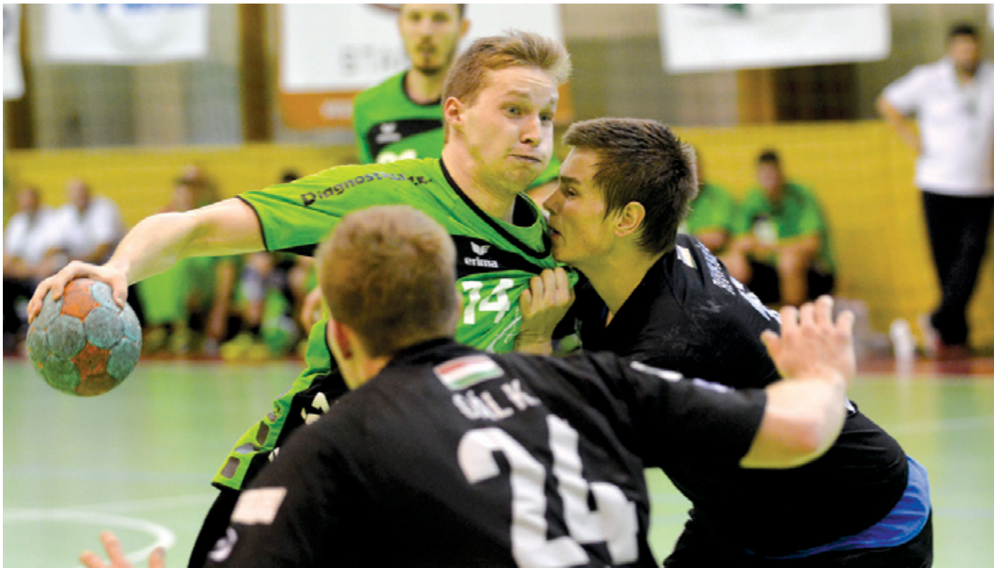
A harcoság győzelmet ért, és elérhető közelségben a bennmaradás

Ha érthetően mindenki kritikus volt a gyalázatosan enervált őszi szereplés miatt, akkor most nyugodtan írhatunk elismerően a PLER kézilabdázóiról, hiszen a kishitűséget levetkőzve a legutóbbi 4 mérkőzésből 3-at megnyertek. Újra elérhető közelségbe került a bennmaradás kiharcolása, aminek érdekében szurkoljunk együtt, buzdítsuk a csapatot!