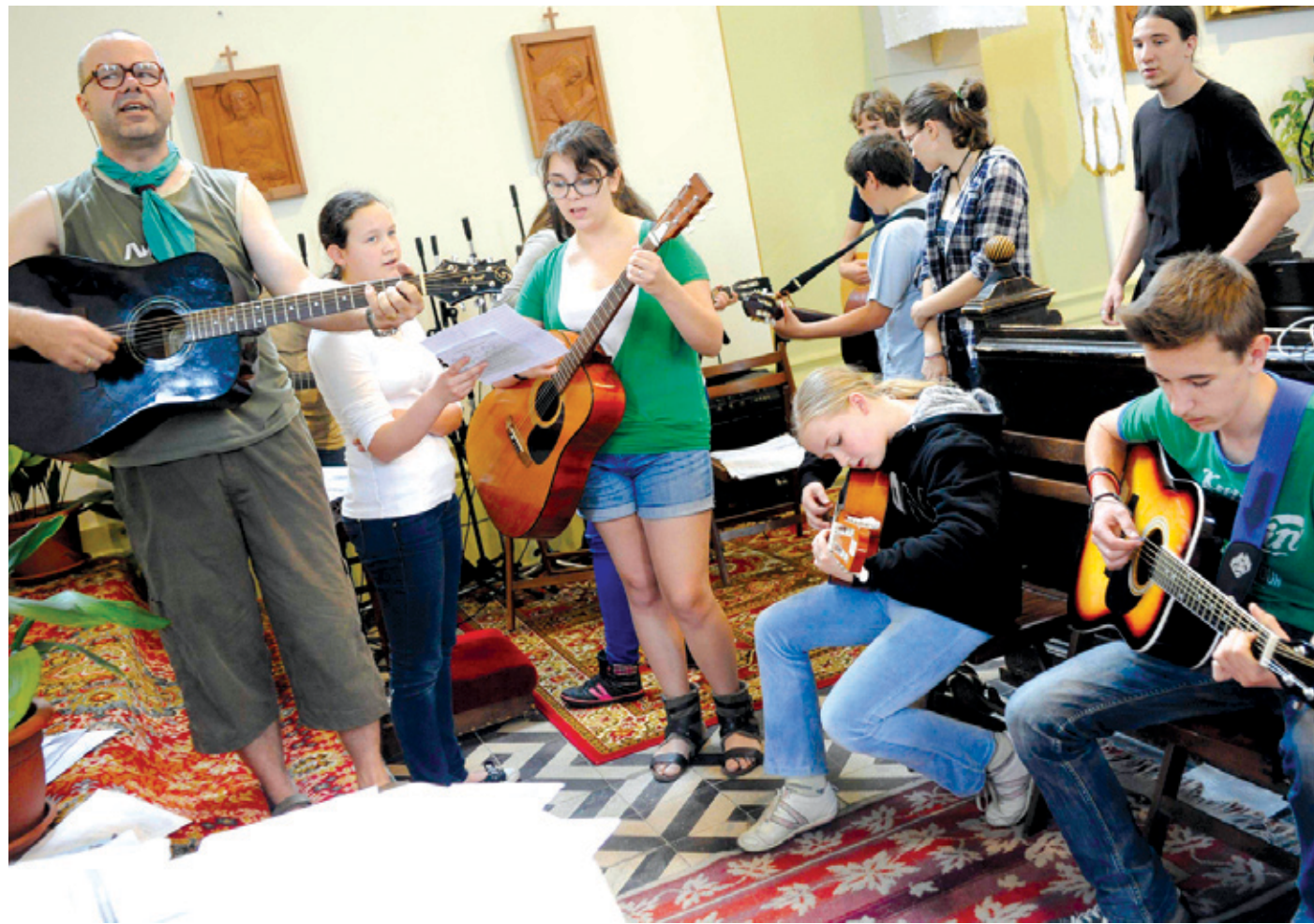
A pihenőpontokon közös énekléssel színesítik a zarándoklatot

Az Élő rózsafűzér zarándoklat az idén is körbeöleli a várost