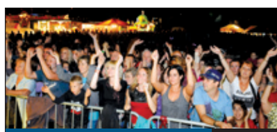
ITT A MAJÁLIS! 7. oldal

A XVIII. kerületi önkormányzat ebben az évben is várja a lakókörnyezetük tisztaságáért tenni akaró polgárokat, akik az április 22-i Föld napja alkalmából 26-án rendezendő kerületkarítással tehetik tisztábbá a közterületeket. Tavaly ilyenkor összesen 39 köbméter hulladék gyűlt össze. Idén is több helyszínre várják azokat, akik tennének a környezetükért.