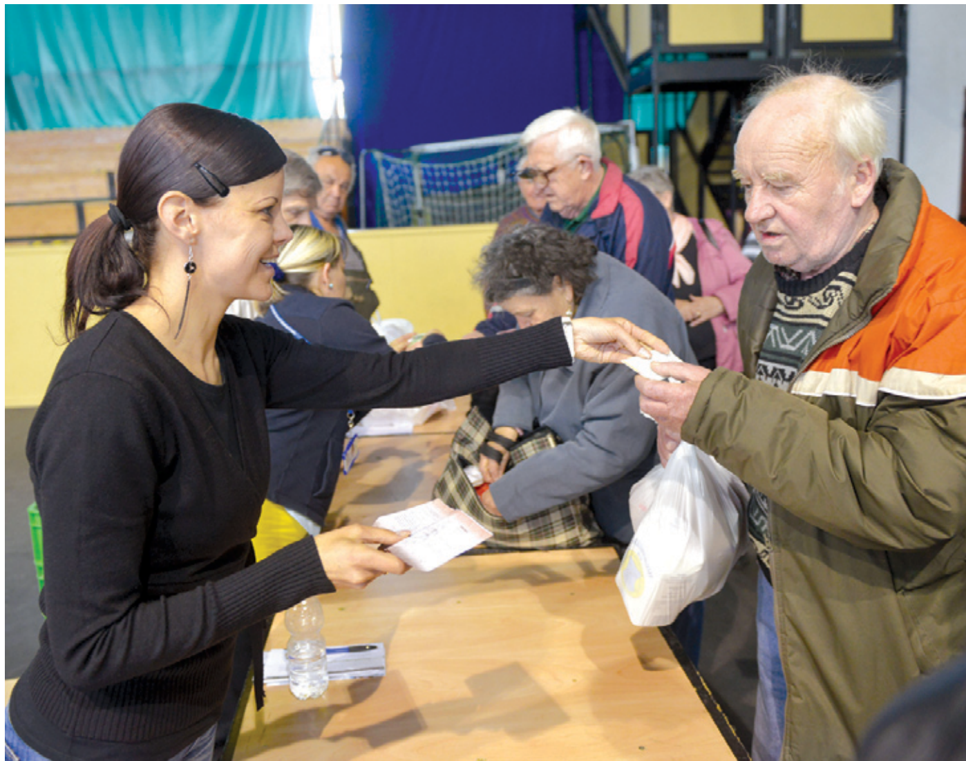
A folyamatos csomagolás mellett is akadálymentes, gördülékeny volt a kiosztás

Az akcióról 19 500, a kerületben élő 65 éven felüli nyugdíjast értesített az önkormányzat