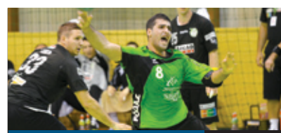
HARCBAN A PLER 15. oldal

A költészet napját minden évben április 11-én, József Attila születésnapján ünneplik. A Kossuth téren négy kerületi iskola diákjai tisztelegtek a költészet örök mivolta előtt. A tanulók József Attila Születésnapra című versének közös elszavalásával állítottak fel Guinness-rekordot. A versmondást Jordán Tamás Kossuth-díjas színész, rendező vezényelte.