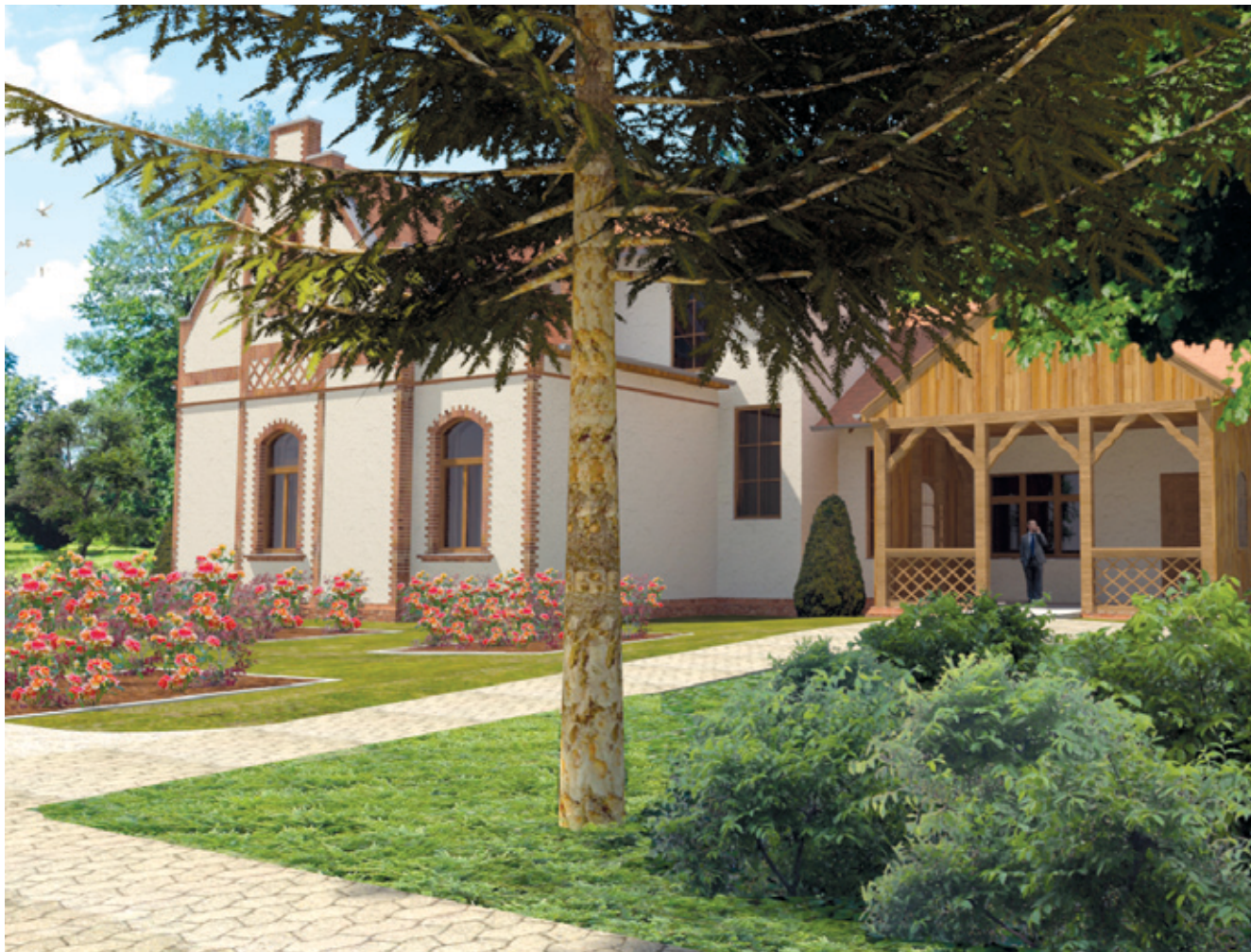
Az egykor birtokközpontként működő Herrich-Kiss-villa helytörténeti-információs központtá alakítása a legfontosabb tervek közé tartozik

Elfogadta a fejlesztési koncepciót a képviselő-testület