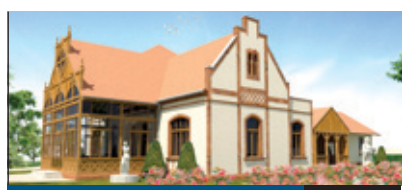
FEJLŐDIK A BÓKAY-KERT 2. oldal

Most már a finanszírozási lehetőségeken múlik, hogy mivé fejlődik a kerület közkedvelt parkja, a Bókay-kert. A fejlesztési tervekkel foglalkozó munkacsoport a lakossági véleményeket is figyelembe véve elkészítette a jelentését. A szükséges források felkutatásával egy modern sport-, kulturális és szabadidő-centrum jöhet létre a kerület szívében.