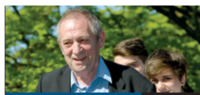
A NAGY VERSMONDÁS 8. oldal

Sportos és családi programokban is bővelkedik a nyári előszezon a Bókay-kertben. A szabadtéri szezon kerékpárversenyyel indul április 27-én, majd a minden korábbinál színesebb május 1-jei majálissal folytatódik. A régi népi hagyományok felidézése mellett békebeli hangulattal, színes programokkal, közkedvelt együttesek koncertjeivel várják a látogatókat.