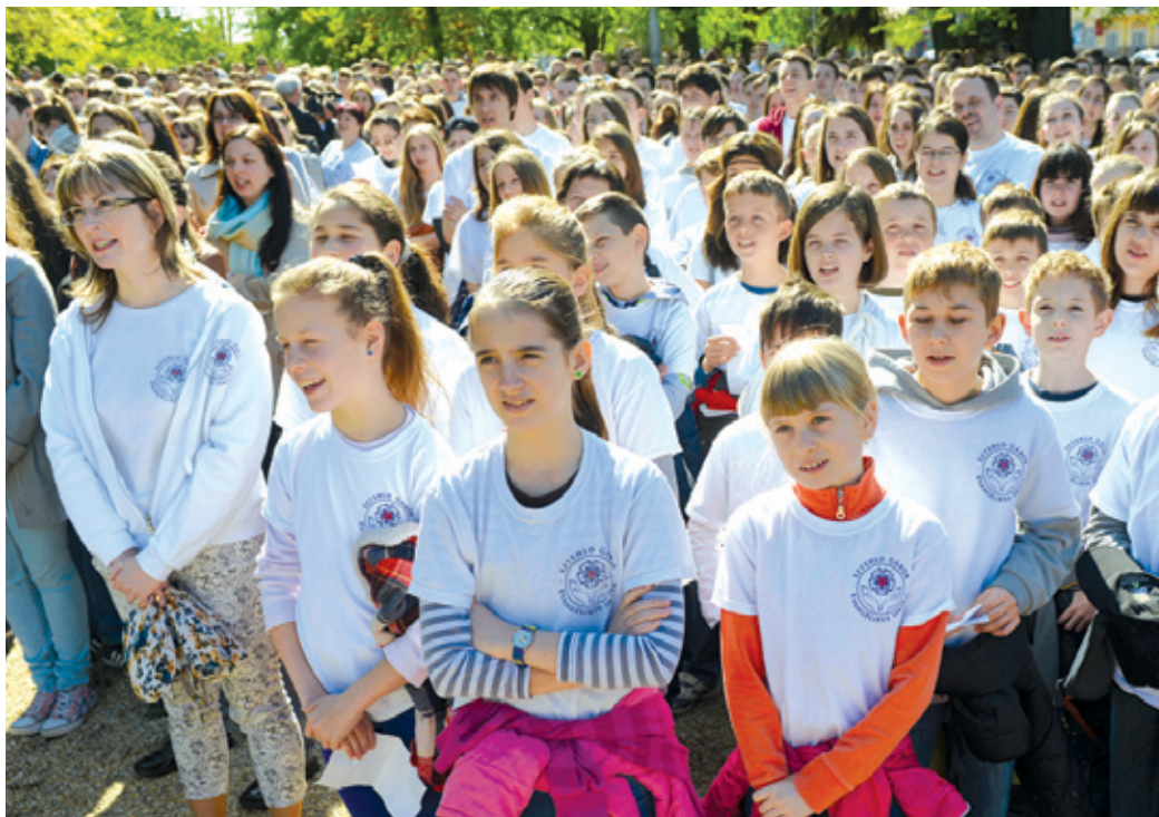
Az 1700 versmondónak köszönhetően a kerület Guinness-rekordot állított fel

Szavakkal hajtottak fejet a költő és a költészet előtt