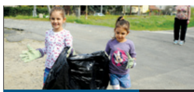
A TISZTÁBB KERÜLETÉRT 6. oldal

Most már a finanszírozási lehetőségeken múlik, hogy mivé fejlődik a kerület közkedvelt parkja, a Bókay-kert. A fejlesztési tervekkel foglalkozó munkacsoport a lakossági véleményeket is figyelembe véve elkészítette a jelentését. A szükséges források felkutatásával egy modern sport-, kulturális és szabadidő-centrum jöhet létre a kerület szívében.