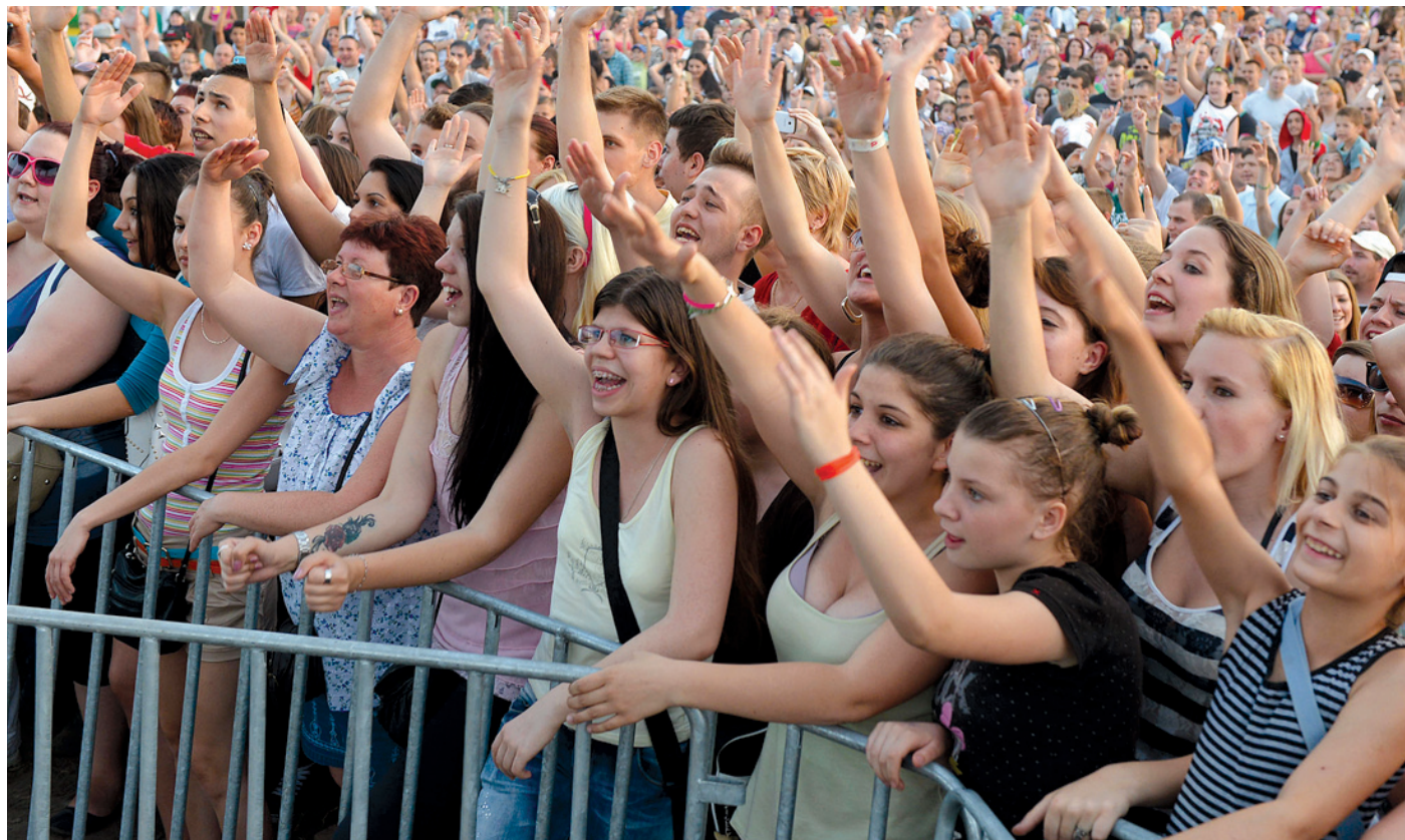
Az elmúlt években több olyan koncertet is tartottak, amelyre megtelt a Bókay-kert

Változatos programok vezetnek be a nyarat