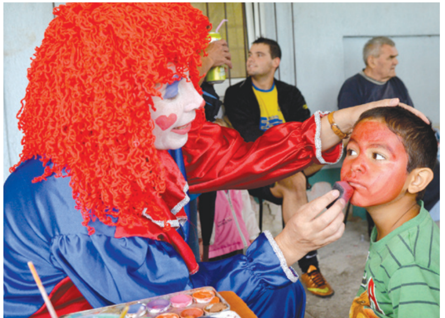
A sportolás mellett arcfestéssel tették még hangulatosabbá a családi napot

➤ Futball, sakk, erős emberek, beszélgetések, hard rock koncert, bográcsgulyás, családi hangulat – avagy egy kedves nap a Táncsics utcai sporttelepen.