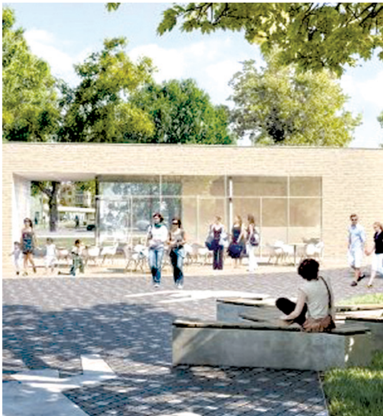
A Tovább18.hu honlapon a kerületi polgárok véleményezhetik a látványterveket

A lakosság véleményét várják a parképület homlokzatához