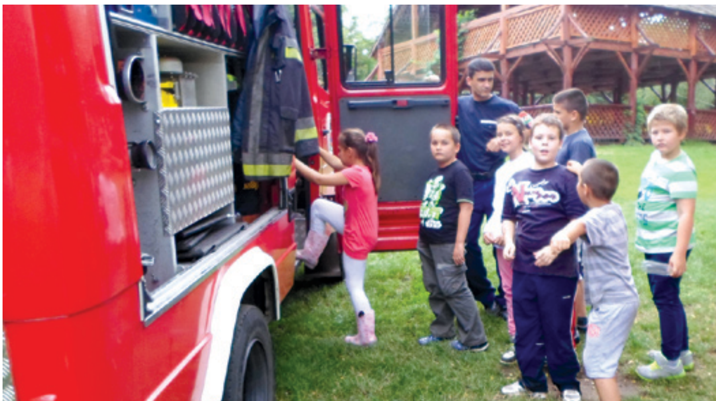
A titokzatos tűzoltóautókat kíváncsian fedezték fel a tábor diákjai