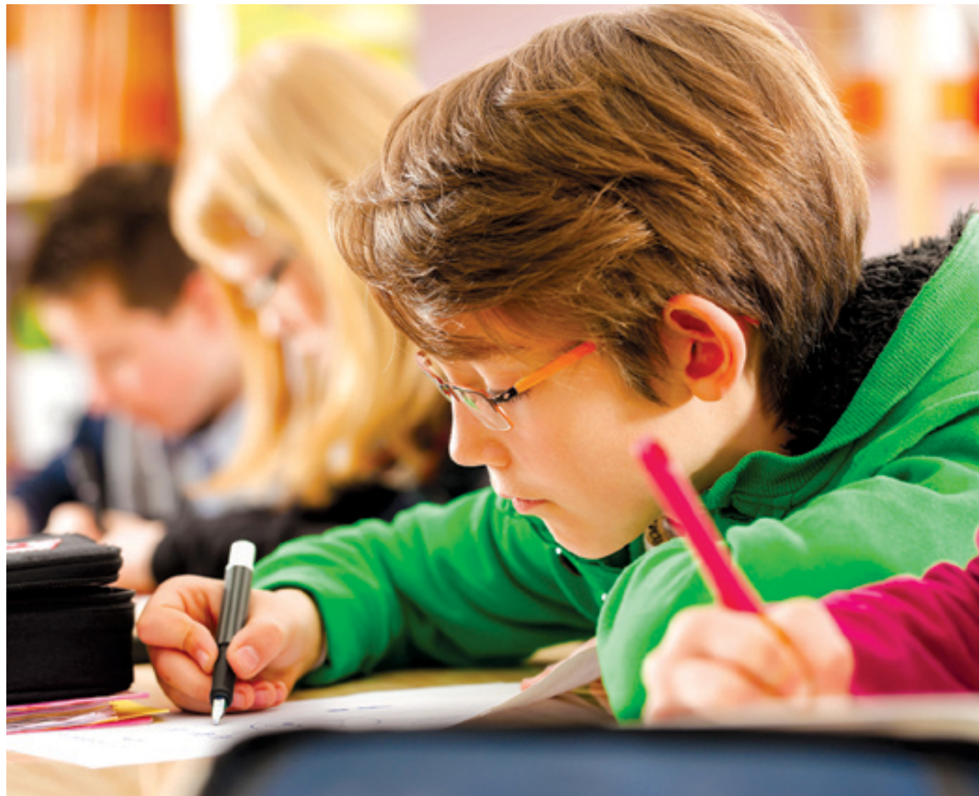
A füzetek mellett egy kezdő írószercsomagot is kapnak a diákok