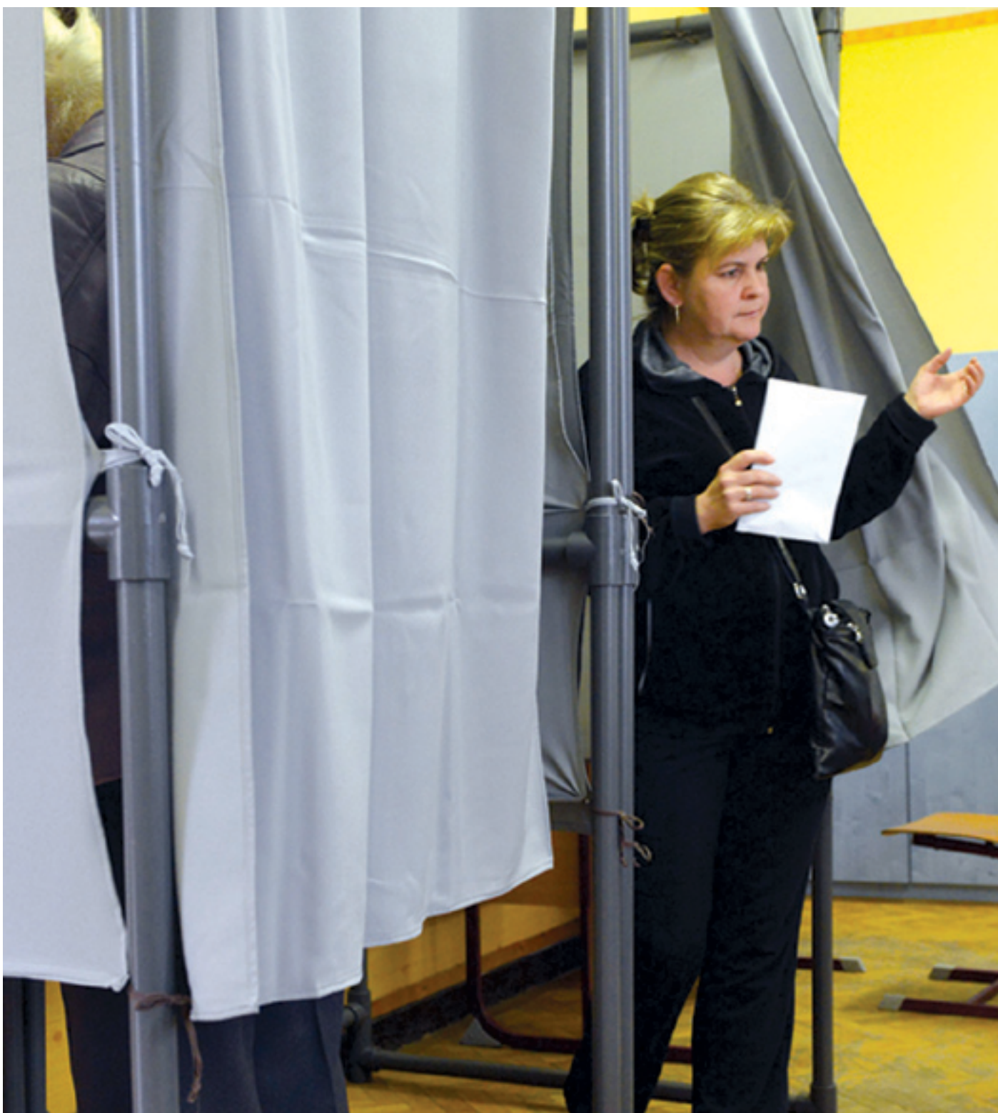
Kilépők, belépők – teljes a zűrzavar a helyi ellenzék megállapodása körül

A volt jelölt és a volt polgármester is felboríthatja a helyi baloldal nehezen létrejött megállapodását