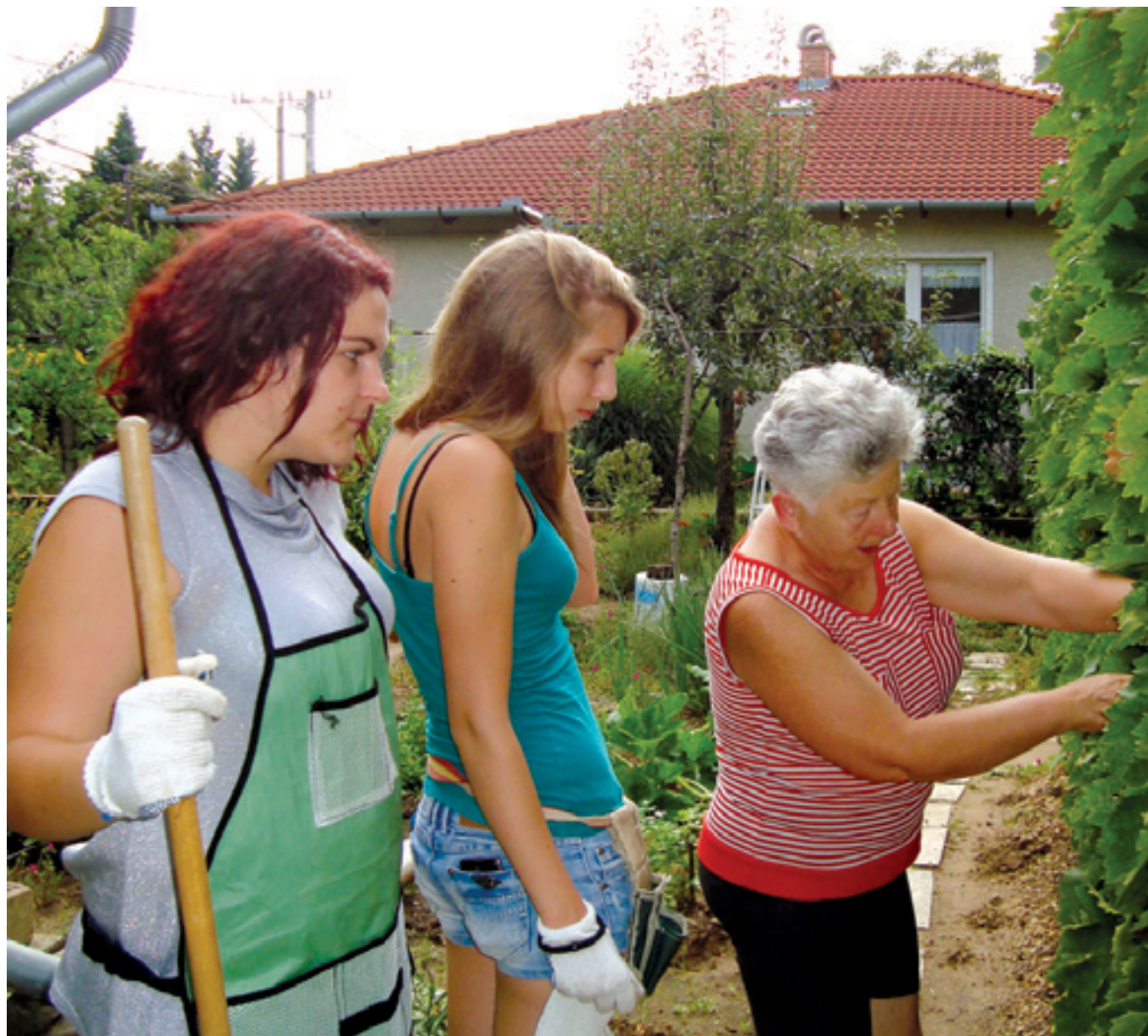
A program során növényeket ültetnek, fásítanak és különféle kertészeti munkákat végeznek a diákok

Változatos iskolai és szabadidős programokat szerveznek