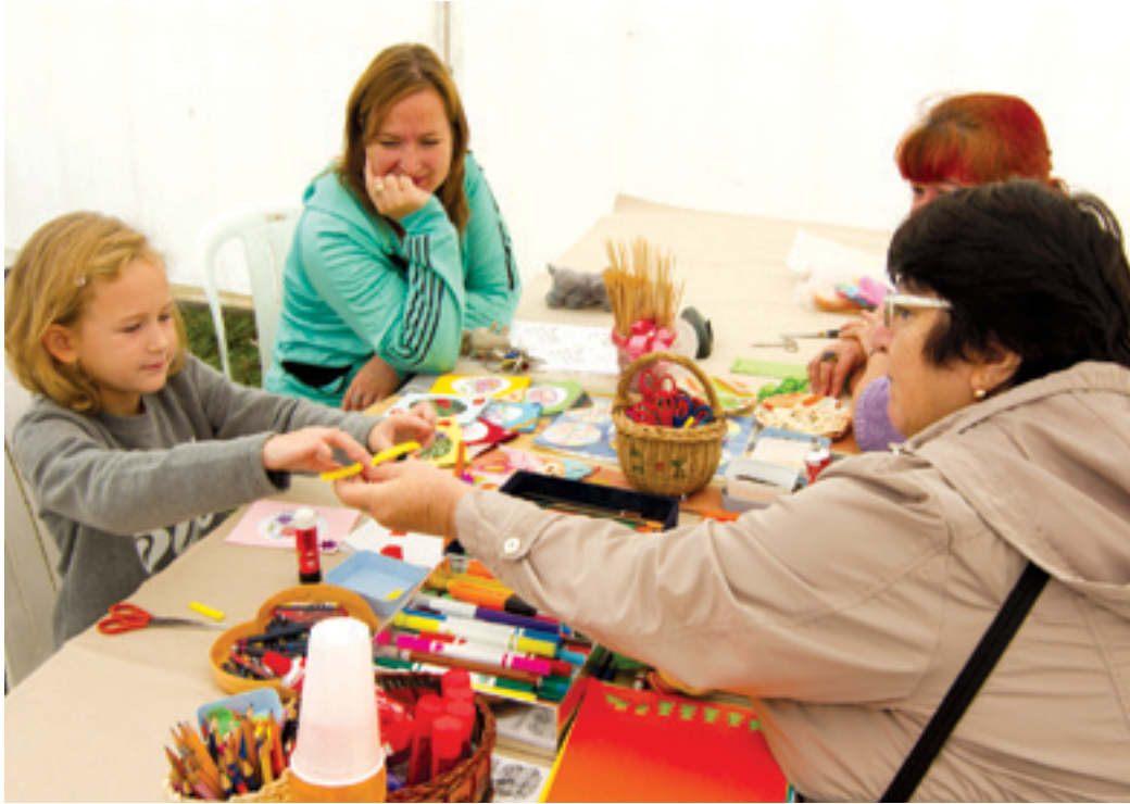
A Városgazda a bemutatón családi programokról is gondoskodik

Bemutatkozik a legnagyobb önkormányzati cég