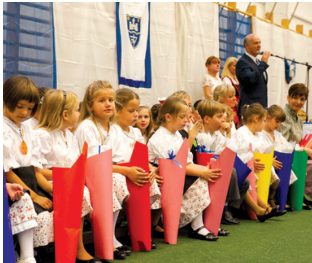
Az ajándék cukorsüveg már hagyomány lett a Piros iskolában

A kerületi német önkormányzat négy éve csak ígéreteket tett, mára minden programot teljesített, sőt az időközben kitalált ötleteket is megvalósította.