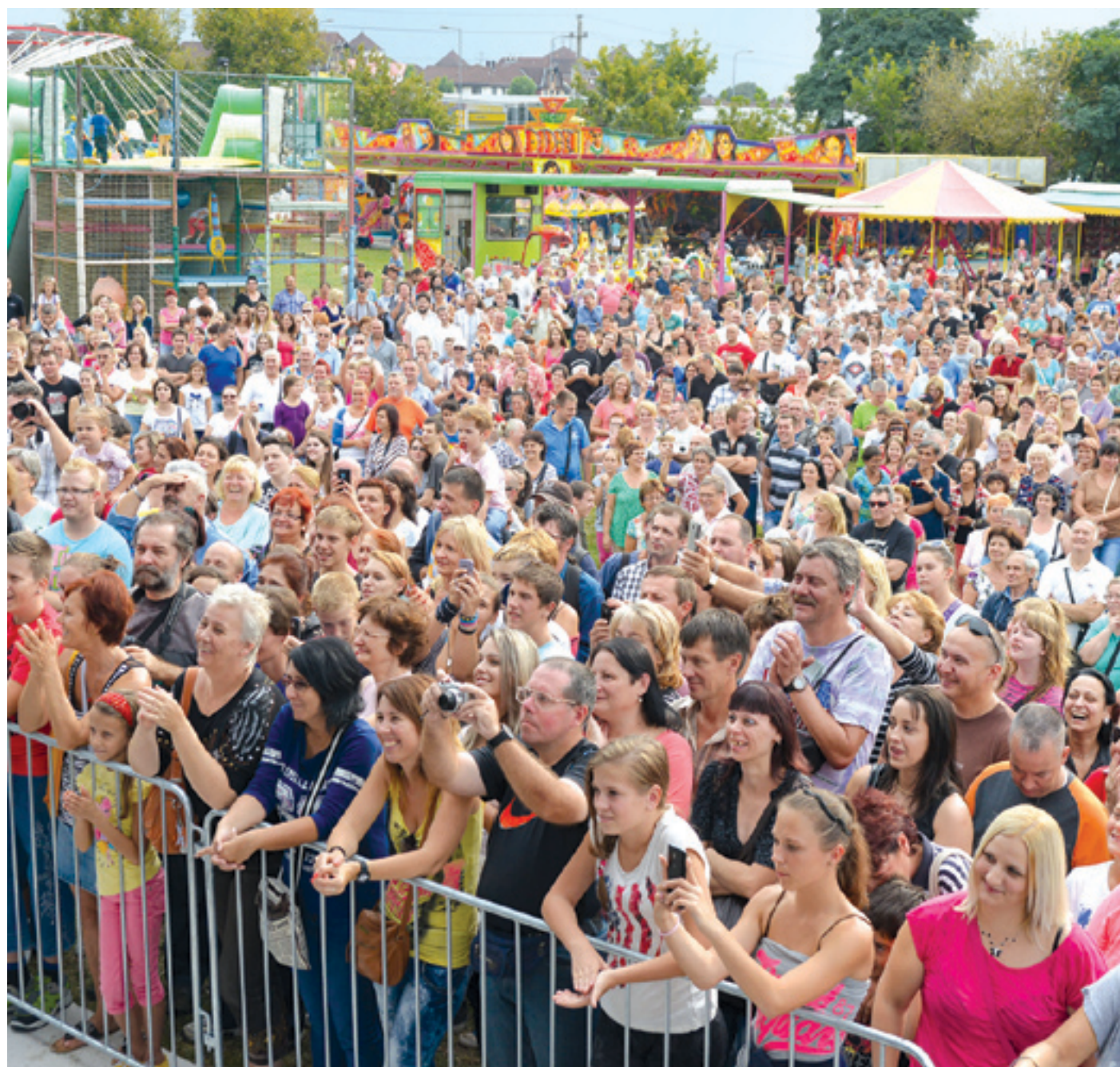
A három nap alatt több mint 25 ezren szórakoztak a Szeptemberi Kóstolón

reggelit kreáltak a tárcsán, és azzal végigkínálták a versenytársakat is. Az ember elleshet továbbá érdekes trükköket. Például hogy miként lehet a bográcson reggelire fánkot sütni.