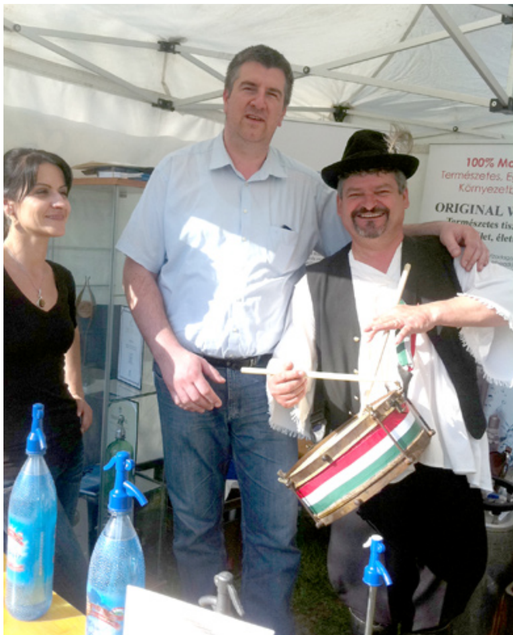
A szódavízről ízetesebb hungarikumokkal is várják majd a kerületieket

Számos kiemelt nemzeti értékünk – köztük több mint 15 hungarikum – mutatkozik be a