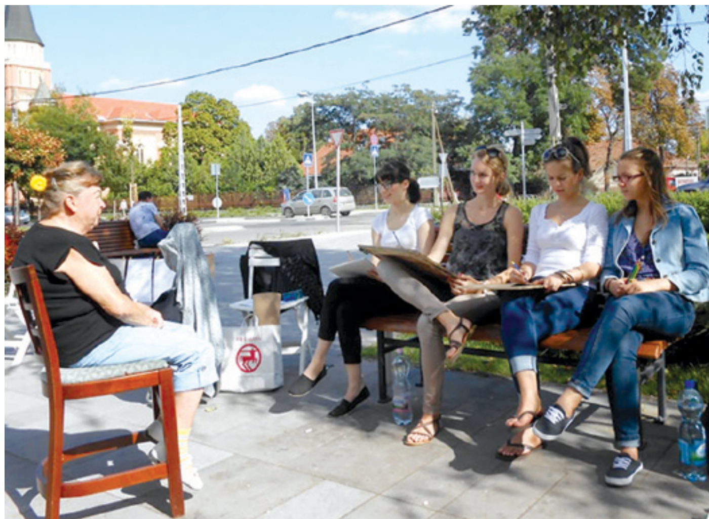
A fiatalok aktívan, alkotóként vagy előadóként is részt vettek az egyhetes programsorozaton

programok és a Nemes utcai imaházunkban megrendezett esti Cooltour Café rendezvények naponta átlagosan 60 fiatal érték el, ami számunkra szép szám volt, nem beszélve arról, hogy akik eljtek, aktívak voltak: vagy alkotóként-elő-