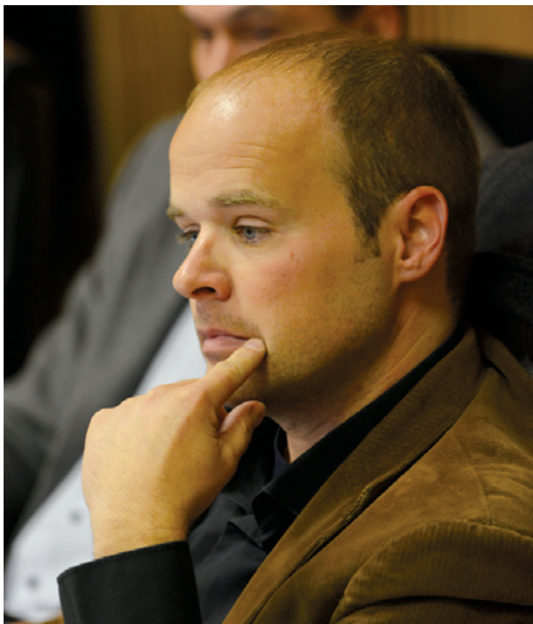
Gyáli kertés házban lakik, de a Havannán indul a saját választóit is lenéző MSZP-kampányvezér