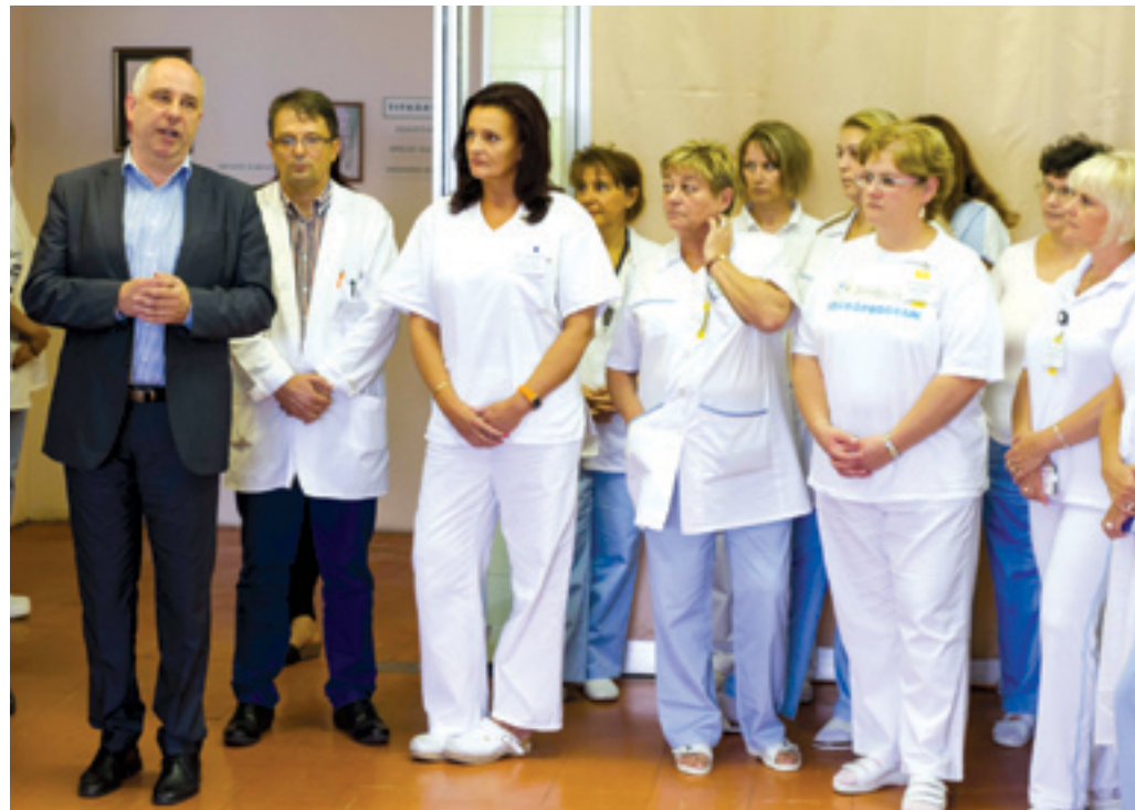
A kerület honorálja az egészségügyiek erőfeszítéseit

A szeptemberi fizetés mellé pénzjutalmat is kaptak a Pestszentlőrinc-Pestszentimre Egészségügyi Szolgáltató Nonprofit Kiemelten Közhasznú Kft. munkatársai. A jutalmakat az önkormányzat és az egészségügyi szolgáltató együttműködésének köszönhetően vehette át minden dolgozó.