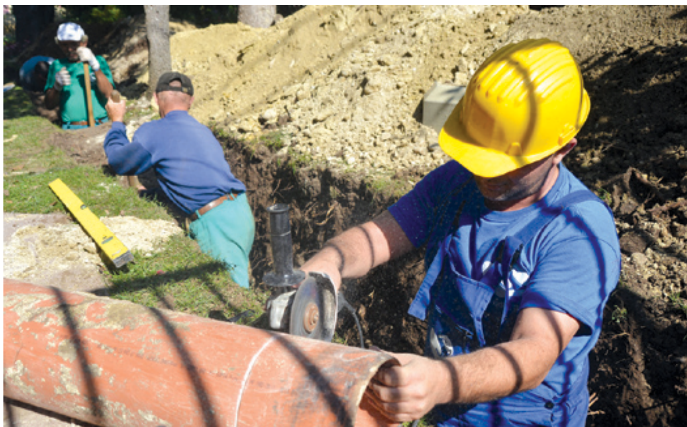
A Városgazdával kötött szerződés megnyugtatja a lakókat

Megtörtént az első rákötés az elkészült gerincvezetékre