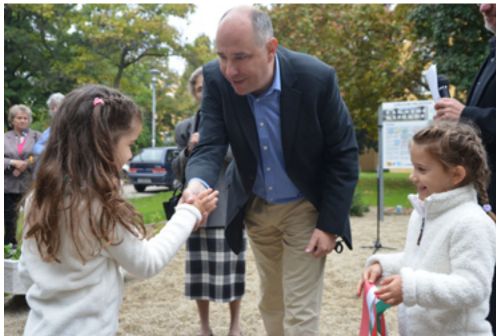
Az új park minden generációnak tartogat meglepetést