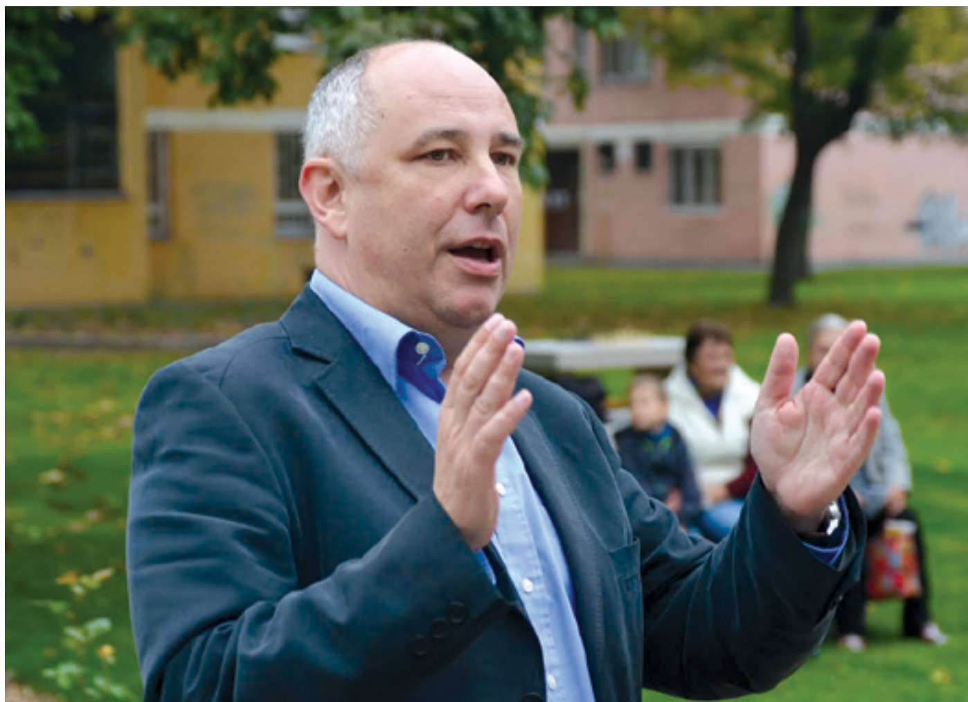
„Olyan közösséget építünk, ahol mindenki találja a helyét.”

– Furcsa, de elfogadtam, mivel ez együtt jár a kampánnyal. Az elmúlt négy évben több ezer emberrel találkoztam, több ezer emberrel beszélgettem a kerület lehetőségeiről, a közös örömeinkről és bánatainkról, a közösen megélt múltról, a sokat ígérő jövőről, az elvégzett és az elvégzendő munkáról. A kampány viszont arról szól, hogy minden lakost kellően informáljunk arról, hogy mi zajlik körülöttük, és mire számíthatnak a későbbiekben. A kampányban mi büszkén mutatjuk fel az eredményeinket. Amit megígértünk, azt megcsináljuk, és ennél fontosabb mondat nem létezik a szótárunkban.