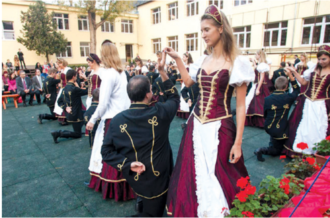
A hálaadó istentisztelet előtt ünnepi műsorral köszönték meg a diákok a felújítást

Szívből jött a szó, lélekből az imádság a Sztehlo gimnáziumban