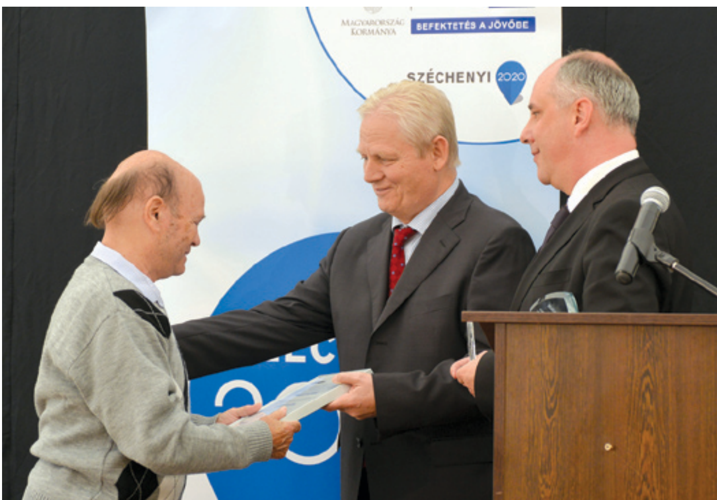
Mészáros Árpádot – mint az évtizedek után végre csatornához jutó kerületiek szimbolikus képviselőjét – Tarlós István főpolgármester és Ughy Attila polgármester együtt köszöntötte az ünnepségen

A sikerhez vezető út a kerületben nincs karbantartás miatt lezárva