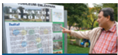
LAKATOS, TE CSODÁSI!