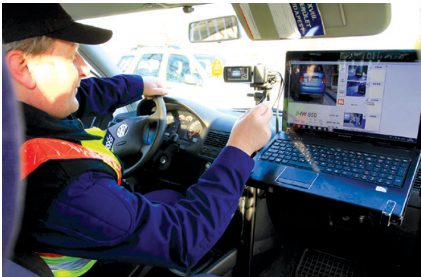
A polgárőrök csak a rendőrökkel együtt lehetnek igazán hatékonyak