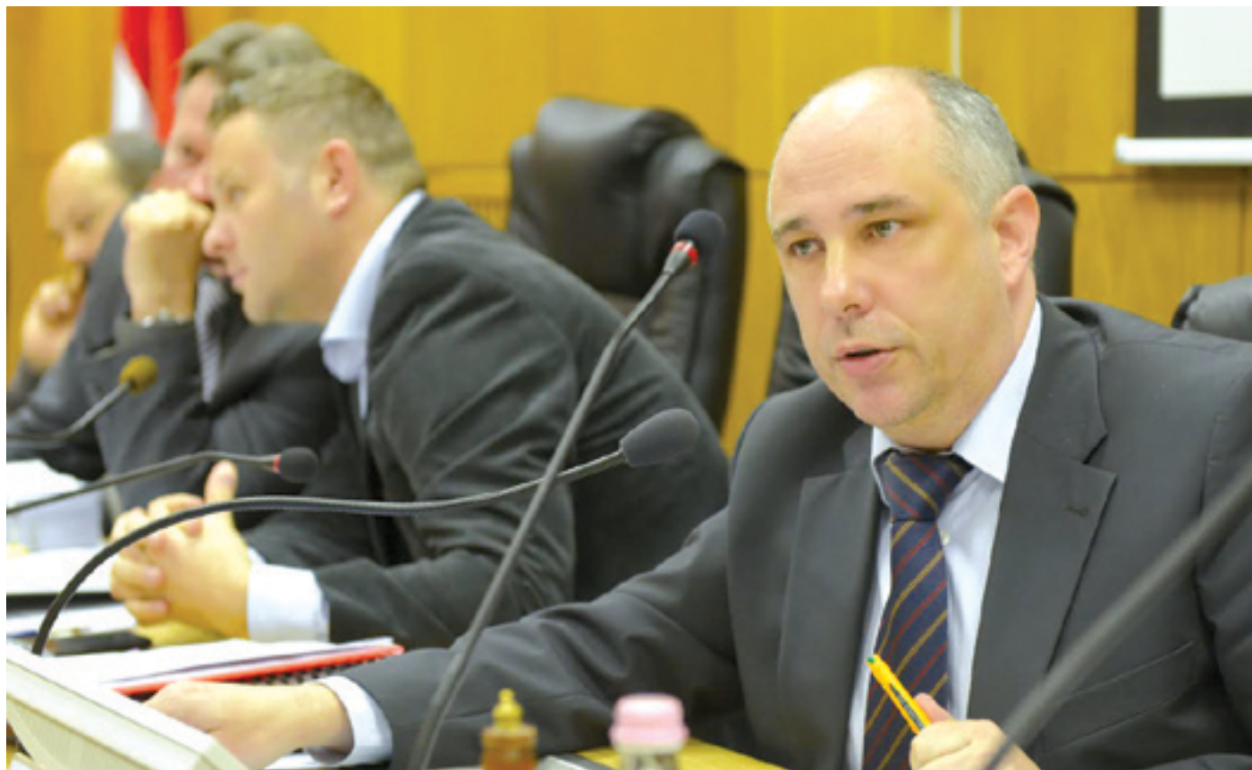
„A kerületi költségvetés stabil. Olyan alap, amire lehet építeni.”

– Nem elefántcsonttoronyban ülünk. Naponta szembesülünk problémákkal, naponta oldunk meg több tucat feladatot – de ez így természetes. A kerületben öntudatos, őszinte emberek élnek, akik tudják, hogy számít a véleményük. Élő, napi kapcsolatban vagyok velük magam is. Ha megmutatnám a Facebook-oldalam üzenetváltásait, ön is látná, sokat dolgozunk azon, hogy az apróbb közösségek mellett a személyes ügyeket is felkaroljuk. És a visszajelzések egyértelműek: ha vannak is hibák, jó úton vagyunk, és ha belekezdünk, fejezzük be a munkát! Ahogy az egyik kedves levélíró írta: „Polgármester úr, ahhoz, hogy szivárvány legyen, szükség van esőre is.” Igaza van, még akkor is, ha azt gondolom, hogy azért