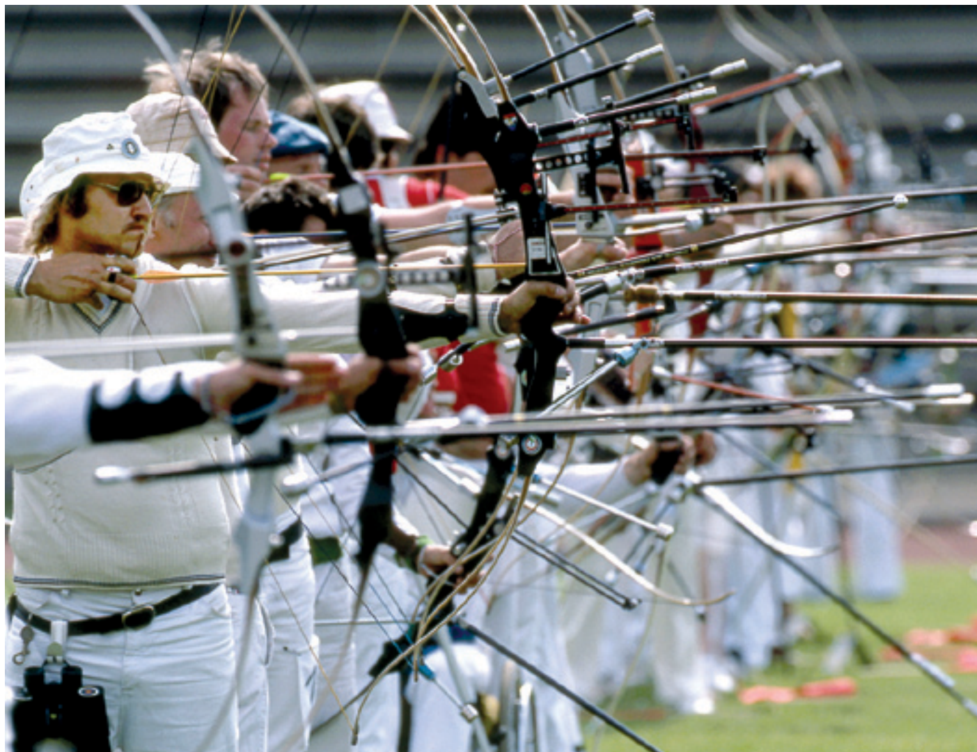
A Malév íjászbajnoki aranyérmét is szállították a klubnak