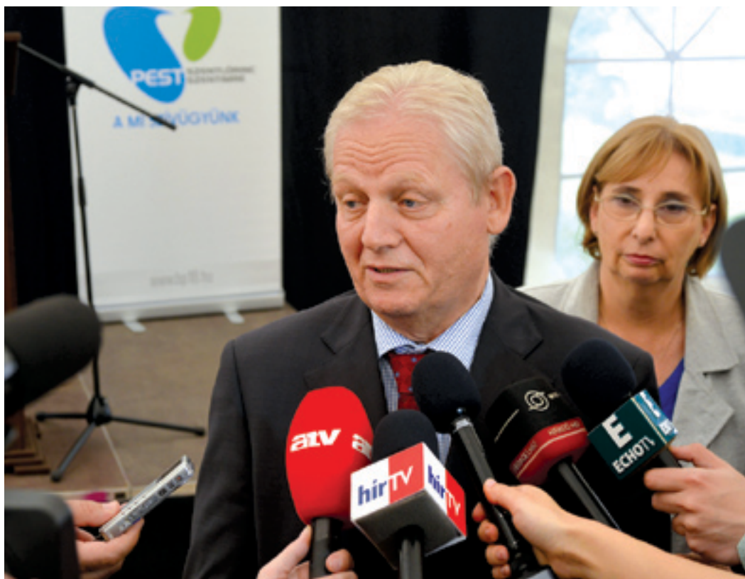
Tarlós István: A jó együttműködésnek köszönhetően tudunk itt a tervezettnél 220-szal több családot bevonni a programba

Hetven kilométer már készen van a megépítendő 94 kilométernyi kerületi csatornahálózatból, és túl vagyunk az első házi rákötéseken is. Tarlós István főpolgármester szerint a program nem csak a kerület történetében mérföldkő.