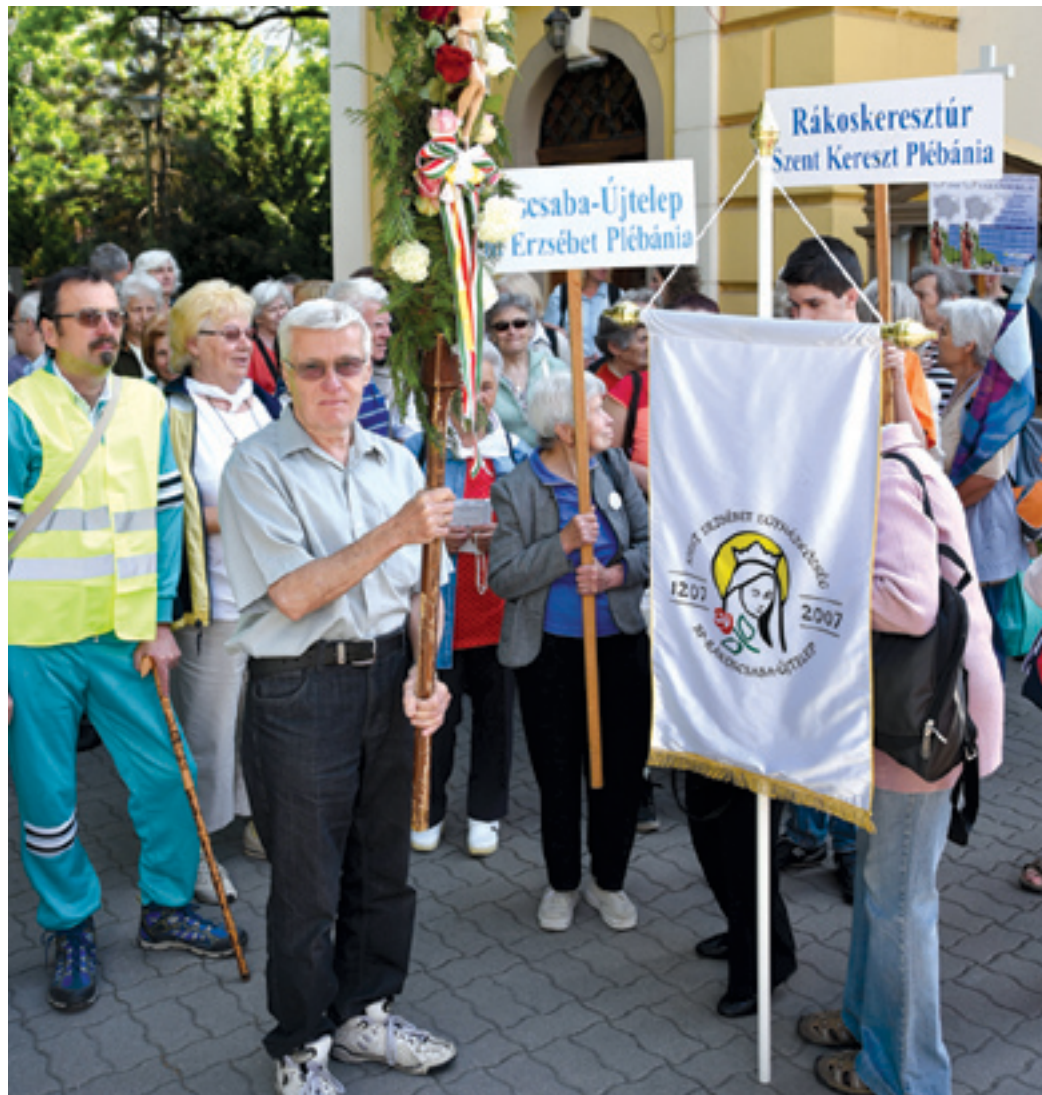
A zárandokok a Szent Imre-templom kertjében tartottak pihenőt

ját és a kertben lévő urnatemető tökéletességét, elmondható: joggal tette, hiszen a templomkert akár szépségversenyen is indul-