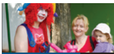
GYERÜNK A SZABADBA!

Mérsékelt áron és tartalmasan tölthetik a nyarat vagy annak egy részét azok a gyerekek, akik a Bókay-kerti napközis táborba választják. A programokat ki-ki személyre szabhatja magának, ha valami különlegesen vágyik. A napközis tábor mellett számos intézmény szervez diákoknak tartalmas egyhetes programot, amelyet részletes összeállításunkban ismertetünk.