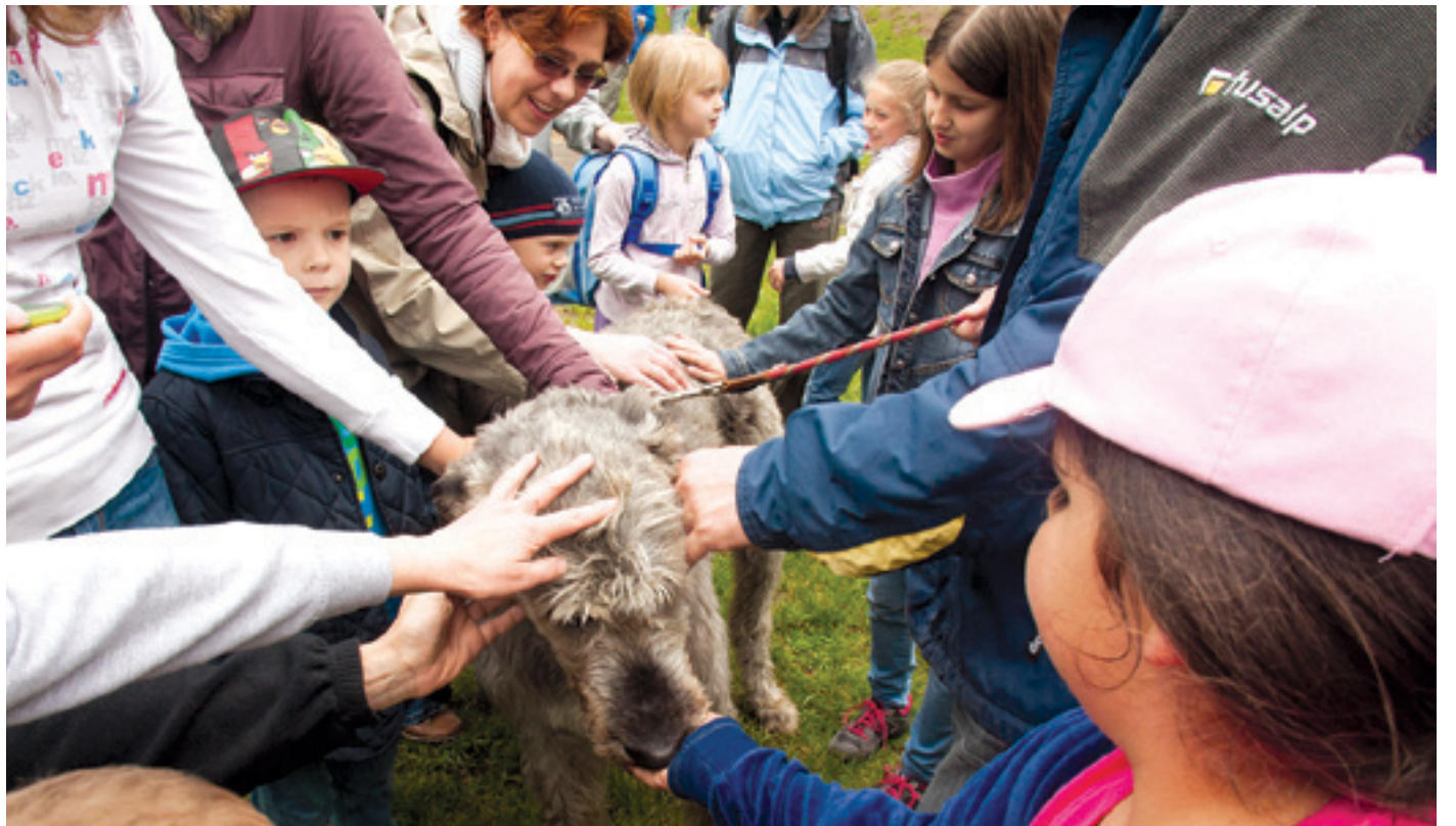
A kutyás nap végén alighanem sok szülő szembesült azzal, hogy gyermeke új kedvencet szeretne

➤ Negyedik alkalommal adtak számot a kutyák a tudásukról, az idomítottságukról és a szépségükről május 9-én a Bókay-kertben. Nagy volt az érdeklődés a Kutyás sportélesztő elnevezésű rendezvény iránt, hiszen száznál több négy- és sok-sok kétlábú kereste fel a kertet.