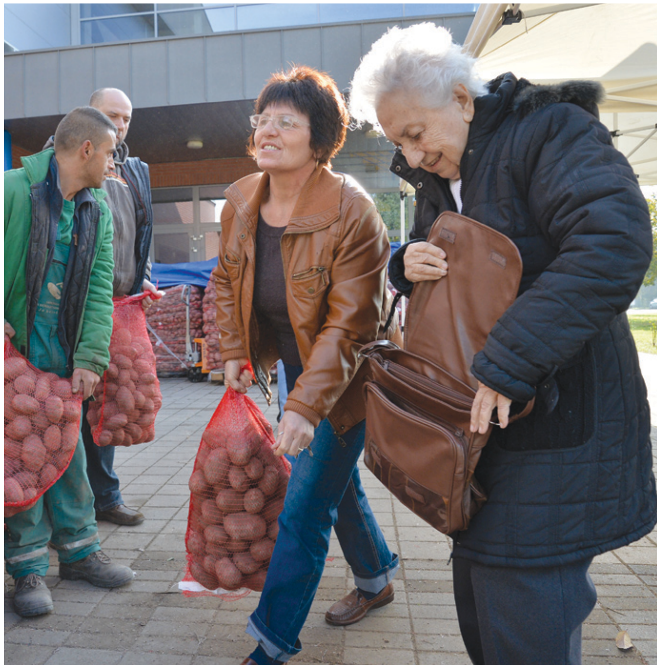
Fontos, hogy a kerületben élők érezzék és lássák, hogy senki nincs magára hagyva

Csaknem 300 tonna jó minőségű krumplit osztottak szét