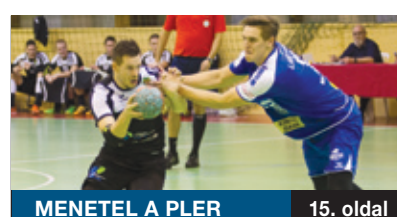
MENETEL A PLER