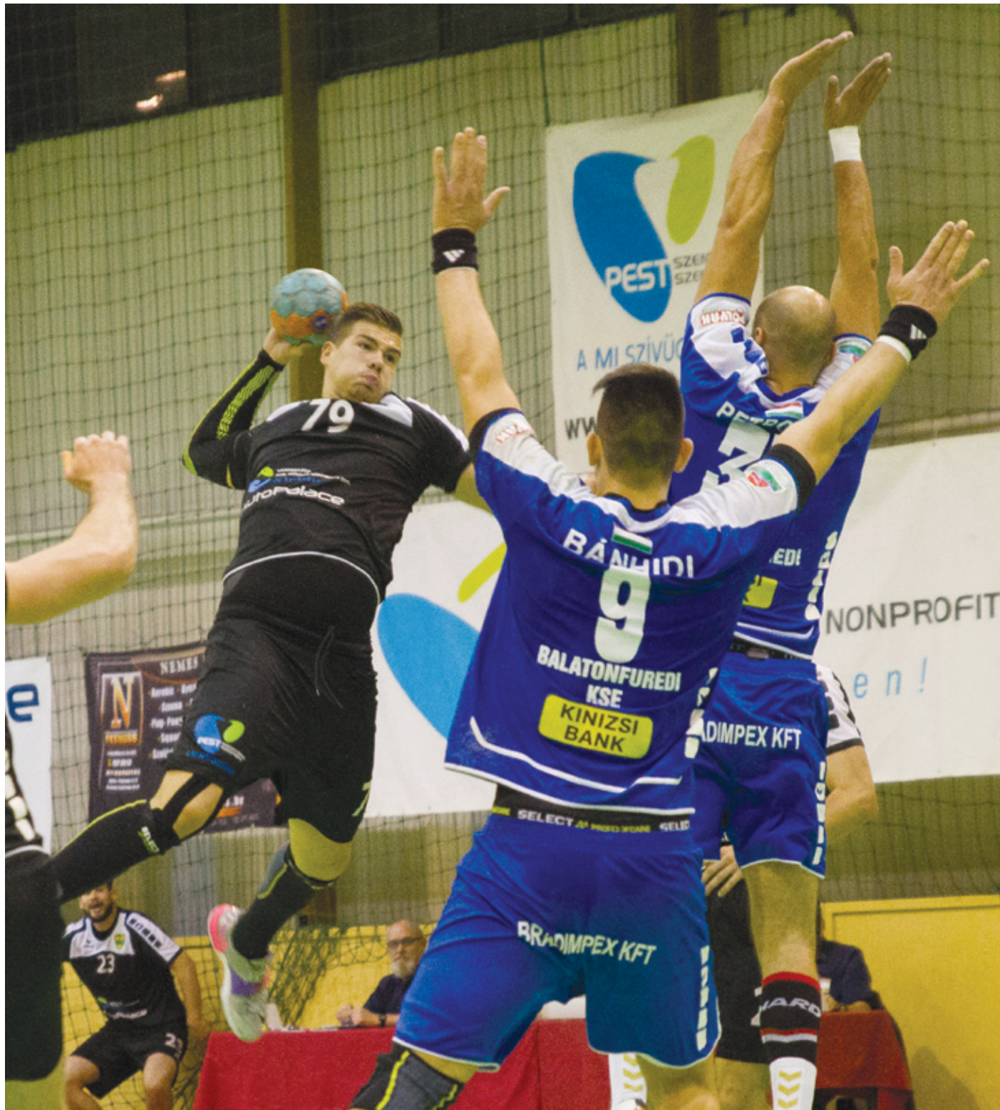
Kellő hittel és elszántsággal nagy bravúrt hajtott végre a PLER a Balatonfüred ellen

➤ Kiváló bajnokikat játszott a PLER-Budapest. A csapat, amely kilenc forduló során mindössze két pontot szerzett, most megtámasztotta, s az elmúlt három mérkőzésen két győzelemmel és egy döntetlennel bizonyította: helye van az első osztályban.