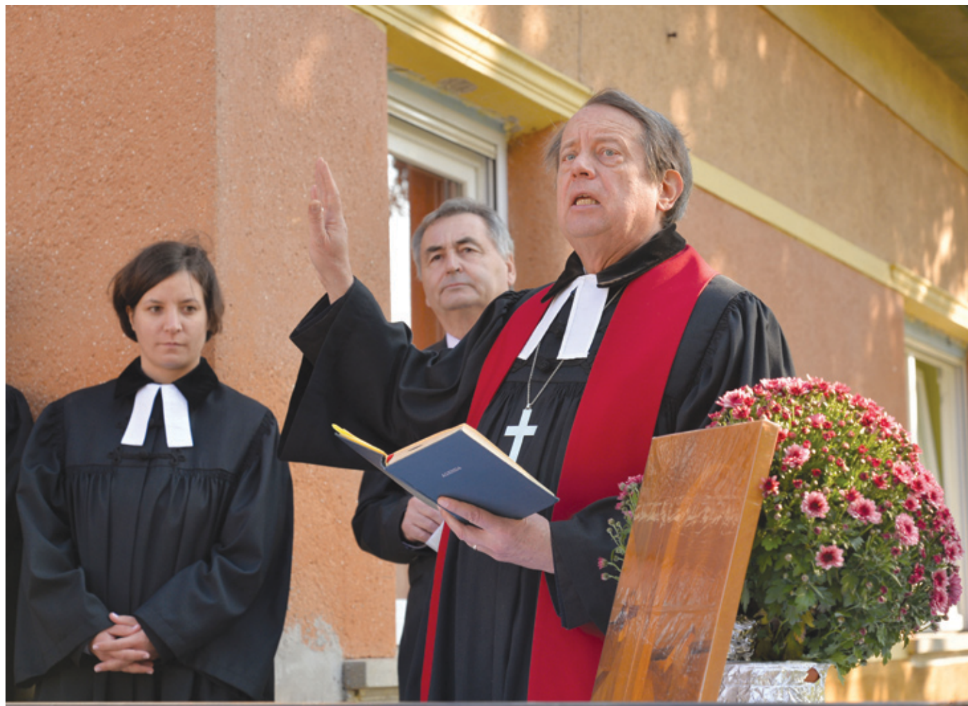
Gáncs Péter, a Magyarországi Evangélikus Egyház elnök-püspöke ünnepi beszédében gálans ajánlatot tett az imrei híveknek

– Egy kápolna felépítése nem olcsó, tudjuk ezt valahányan, de ettől függetlenül hadd tegyek egy ajánlatot: kezdjék el önök itt helyben, itt a kerületben gyűjteni a forintokat a reménybeli