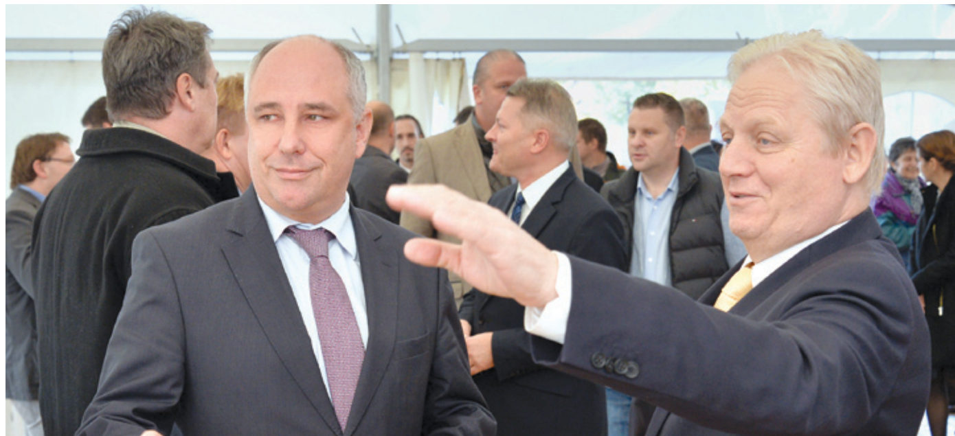
Tarlós István főpolgármester és Ughy Attila polgármester tervei szerint több közös fejlesztés valósul meg a kerületben

Két évvel ezelőtt, 2013 őszén Tarlós István főpolgármester és Ughy Attila, Pestszentlőrinc-Pestszentimre polgármestere Ferihegyen jelentette be annak az uniós háttérű fővárosi projektnek a kezdetét, amelynek