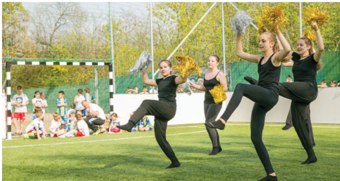
A Kapocs iskolában átadott újabb műfüves pálya is azt segíti, hogy a labdarúgás minél népszerűbb legyen a fiatalok körében