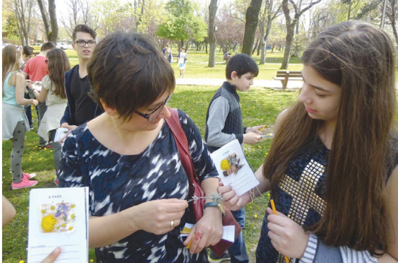
A Tomory Lajos Pedagógiai és Helytörténeti Gyűjtemény felfedezőszétákát szervez a megújult Kossuth térre

A Tér_Köz pályázat keretében megújult Kossuth téren a Tomory Lajos Pedagógiai és Helytörténeti Gyűjtemény felfedezőszétákát szervez, a Lőrinc 2000 Szabadidősport Egyesület pedig „A prevenció jegyében az egészséges táplálkozásról” címmel játékos rekreációs napot tartott áprilisban.