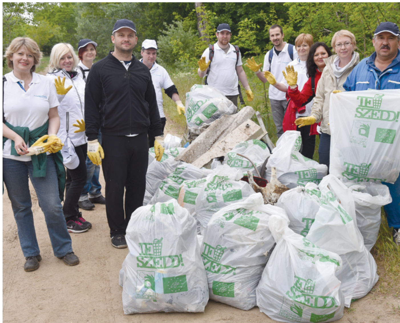
A mostani akcióban minden eddigénél több önkéntes vesz részt

A mostani akcióban minden eddigénél több önkéntes vesz részt minden eddigénél több helyszí-