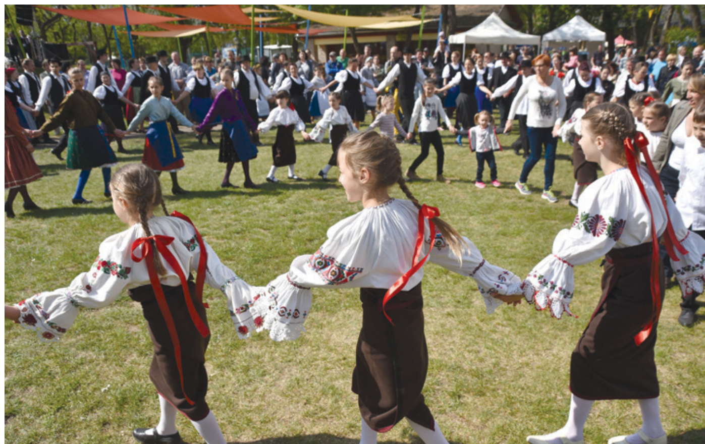
Ezen a szép tavaszi ünnepen a Bókay-kert ismét a családoké lesz

A kilencvenes évek végétől új hangzást kezdtek keresni. A folkgyökerektől nem akartak elszakadni, de a folklórt már az elektronikus zenébe oltották be, amelyet egy kis hip-hoppal színezték. Így jött létre az ezredforduló táján a Balkan Fanatik , amely a mai napig népszerű a táncolni szeretők és az új zenei törekvésekre nyitott hallgatók körében. A Balkan Fanatik má-