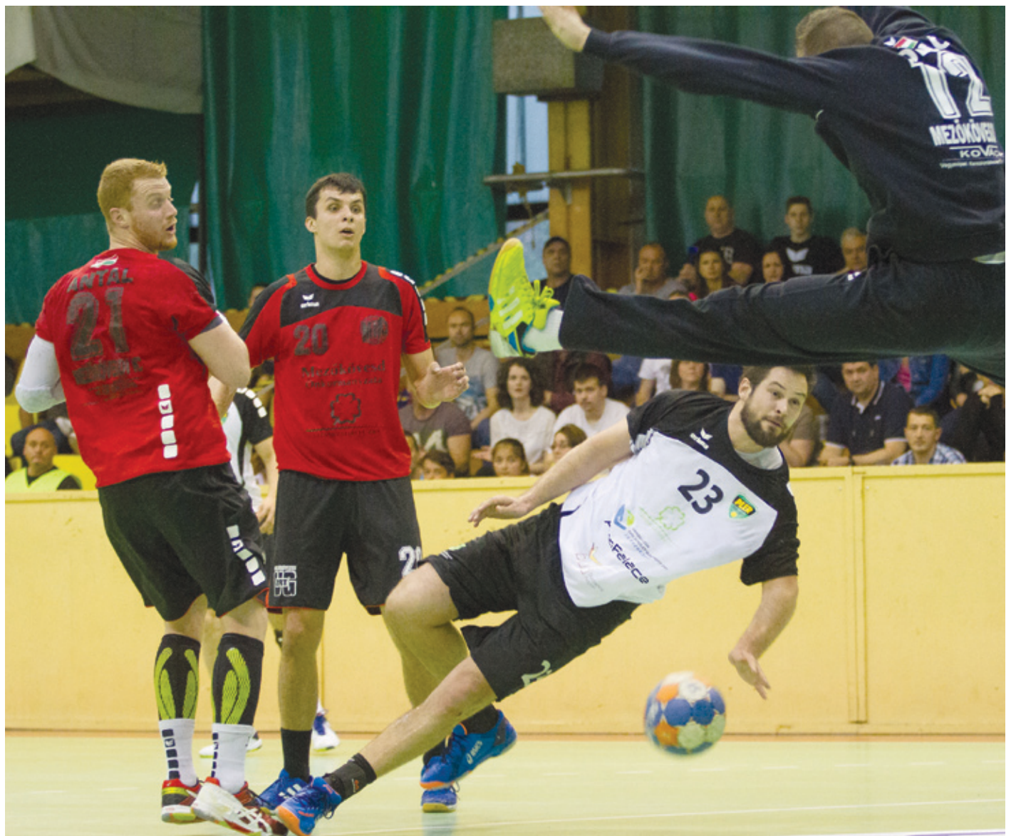
Az elszántságra nem lehet panasz, hét gólos hátrányból, szép gólokkal jött vissza a PLER a Mezőkövesd ellen

Újabb sűrű napokat hagyott maga mögött az elmúlt héten az első osztályú kézilabda-bajnokság rájátszásának alsóháza. Az 5. és a 6. forduló, mondhatnánk, jó mérleggel zárta a kerületi csapat, hiszen volt egy bravúros, 30-29-es siker a Cegléd ellen idegenben, aztán egy „idegbajos” 20-20 hazai pályán, a Mezőkövesddel való találkozón. Két meccs, három pont. Nem rossz, mégis maradt hiányérzet.