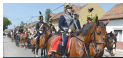
VASVÁRI-NAP 16. oldal

Több mint négy évtized után, 1972 óta először léphet pályára a magyar labdarúgó-válogatott az Európa-bajnokságon. A franciaországi tornával kapcsolatban érezhető felfokozott érdeklődést az önkormányzat azzal igyekszik még inkább növelni, hogy a régi piac téren hatalmas szurkolói sátrat állít fel, ahol június 10. és július 10. között összegyűlhetnek a drukkerok.