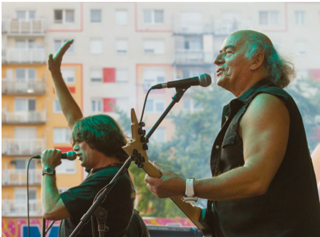
A Havanna-ünnep rendezvénysorozatát a legendás rockegyüttes, a Karthagó fellépése zárta

Színes és gazdag program több ezer nézővel