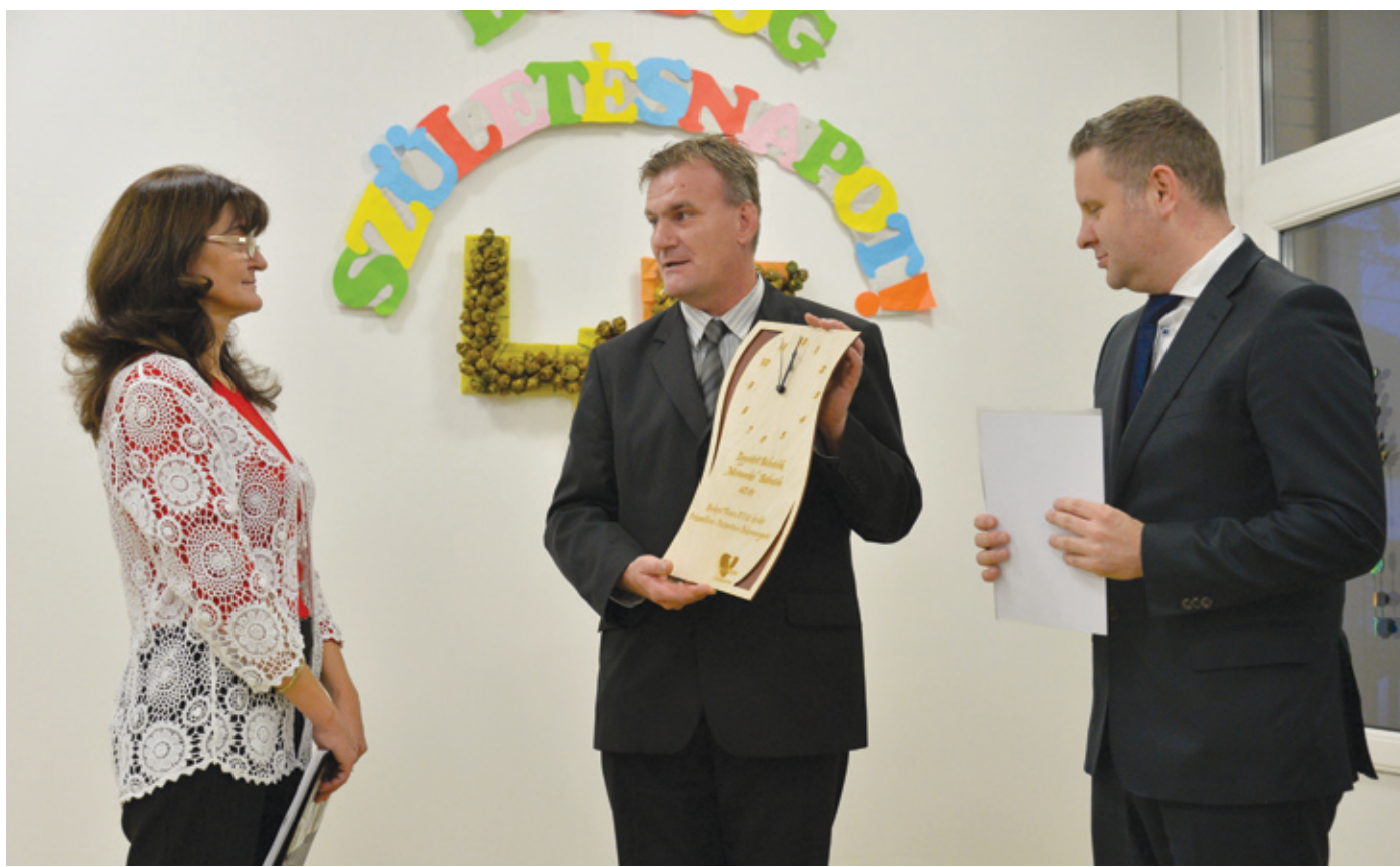
A 40 éves Micimackó bölcsőde a tervek szerint hamarosan megújulhat

Egy haránt irányú kerékpárútról van szó, amely a kerületen áthaladva a Duna menti utat kötné össze a Rákos menti – magyarázta ellenzéki kérdésekre válaszolva Ughy Attila polgármester. – Vagyis az új út közvetlenül elérhetővé tenné a helyi kerékpárosok számára a budapesti hálózatot. Ez turisztikai szempontból legalább olyan fontos lépés, mint a munkahely és az otthon közötti biciklis közlekedést tekintve.