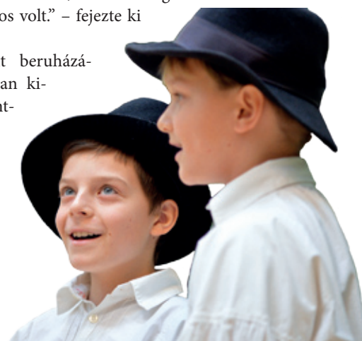
Az ünnepélyes szalagátvágást követően a gyerekek egy színvonalas műsorral kedveskedtek

A kerületben megvalósult beruházásoknak köszönhetően bátran kijelenthetjük, hogy Pestszentimre jó irányban halad a fejlődés útján. Nagyon fontosak ezek a projektek egy helyi közösség életében, hiszen valódi igényeket és szükségleteket elégítenek ki.