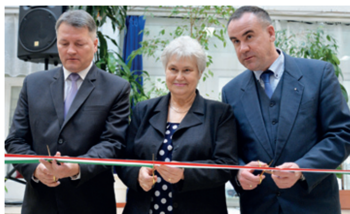
A támogatásnak köszönhetően energetikailag hatékonyabb és megújult épületben tanulhatnak az iskolások