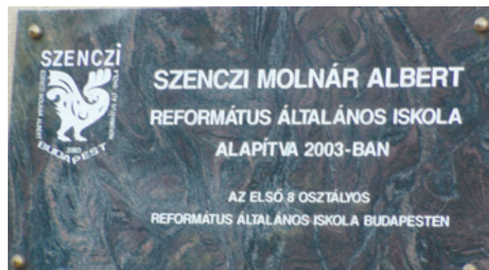
A Szenczi Molnár Albert iskola táblája

A református templom az eredeti formájában, a felszentelés idején, 1927-ben