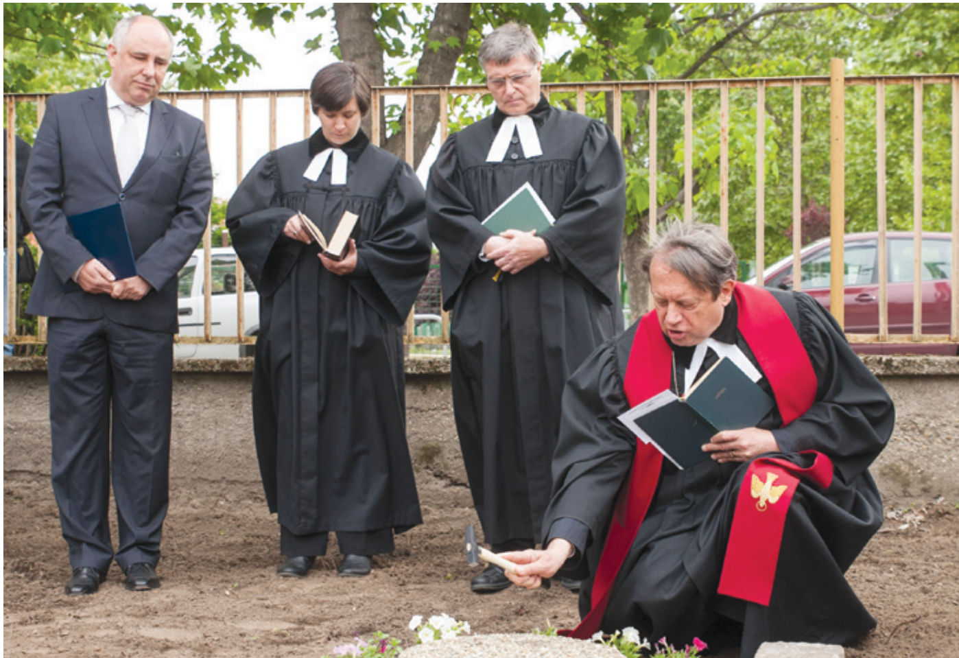
A pünkösdszombat felemelő pillanata volt az ünnepélyes alapkötétel

– Lassan már négy éve lakunk a kerületben. Megszerettük. Nyugodt, családias kertvárosi hely ez. Minden megtalálható, ami ahhoz kell, hogy az ember komfortosan érezze magát. Folyamatosan fejlődik és szépül a kerület, s az imrei rész