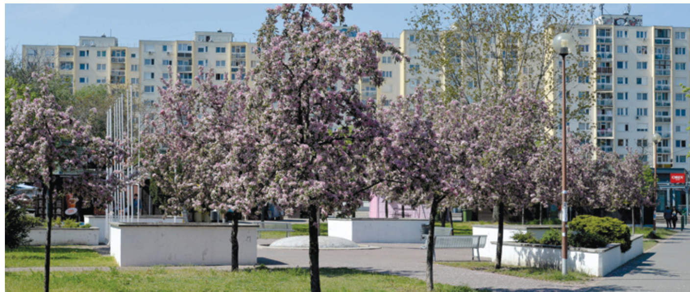
A Budapest Dialog jó lehetőség arra, hogy szerethetőbb környezetet hozzunk létre

A Budapest Dialog az egyetlen városfejlesztési portál hazánkban