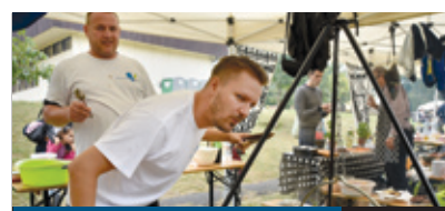
ITT A KÓSTOLÓ!

A Lakatos Lakótelep Környezetéért Egyesület szeptember 4-én rendezte meg a hagyományos Lakatos-napot. A helyszín – mint mindig – a Nefelejcs utca és a Lakatos út sarkán lévő Görögdomb volt. A közkezdveit lecsófőző verseny mellett családi programok és koncertek színesítették a rendezvényt. A lecsókirály 2 személyes 10 napos görögországi utat nyert.