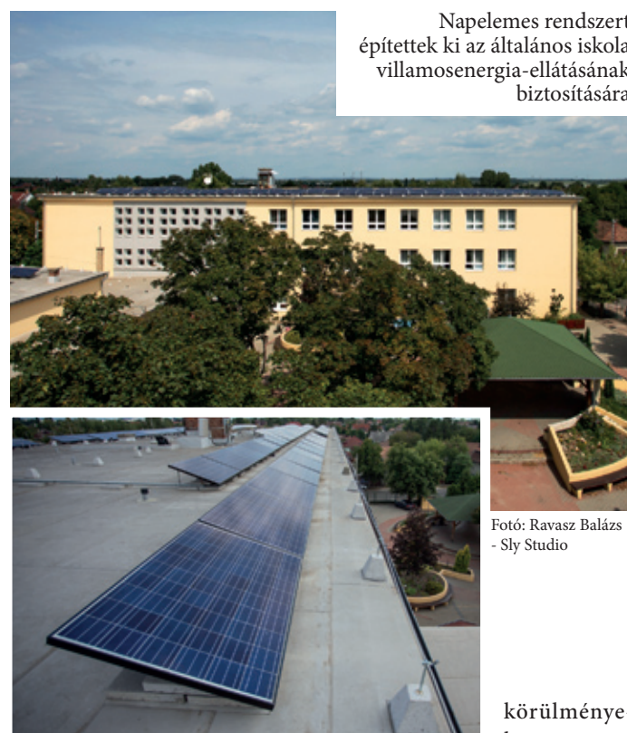
Napelemes rendszert építettek ki az általános iskola villamosenergia-ellátásának biztosítására

Sokat segíthet az is, hogy a tankönyvköltségek kétharmadát az állam állja, aminek révén összesen 735 ezren – minden alsó tagozatos gyermek és a szociálisan rászoruló felsősök – kapják ingyen a tankönyveiket. „Az iskolában töltött időszak rendkívül fontos a gyermekek és szüleik számára is. Minden