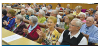
INDUL AZ AKADÉMIA

Többször is gondot okozott a Halomi úti csatornahálózat meghibásodása. Az üzemszavarok miatt halaszthatatlanná vált a csatorna felújítása. A Halomi út Gyergyó utca és Királyhágó utca közötti szakaszán a főgyűjtőcsatorna átépítését meg az idén befejezik. A munkálatok megkezdéséről tartottak lakossági fórumot a Kandó téri iskolában augusztus 24-én.