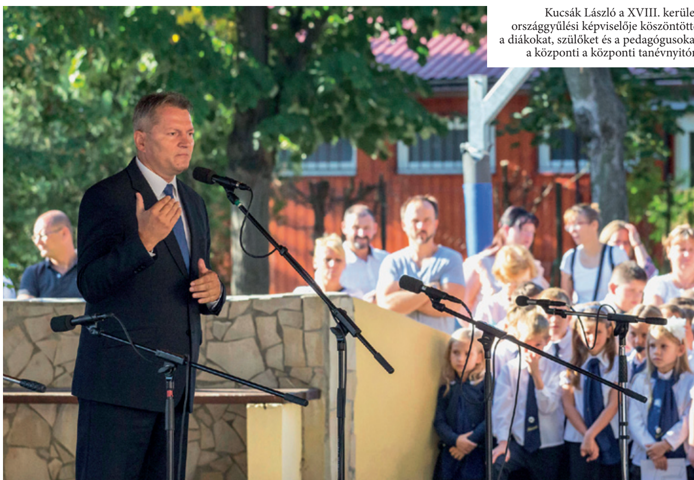
Kucsák László a XVIII. kerület országgyűlési képviselője köszöntötte a diákokat, szülőket és a pedagógusokat a központi a központi tanévnyitón

➤ Szülők, pedagógusok és tanulók egyaránt izgatottan gyülekeztek a megújult Kassa Utcai Általános Iskolában, hogy közösen nyissák meg a 2016–2017-es tanévet a kerületben. Idén már több ezer diák töltheti iskolai mindennapjait az eddiginél jóval korszerűbb környezetben, hiszen a Környezet és Energia Operatív Program (KEOP) segítségével több oktatási-nevelési intézmény újult meg. A projekt kiemelt célja, hogy biztosítsa a környezetbarát megújuló energiaforrást hasznosító rendszerek kiépítését, nagy súlyt fektetve az oktatási-nevelési intézmények épületeinek energiahatékonyságára és energiatakarékosságára.