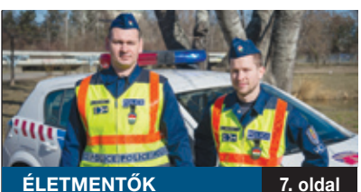
ÉLETMENTŐK 7. oldal

JELENTŐS ÖSSZEGET SZÁN idén is a tulajdonában lévő bérlakások felújítására a XVIII. kerületi önkormányzat. A korszerűsítéseknek köszönhetően az elmúlt két évben csökkent az üres lakások száma. Az önkormányzatnál továbbra is arra törekcsenek, hogy a gazdaságosan nem rendbe hozható lakásokat értékesítsék, és a befolyó összeget további felújításokra fordítsák.