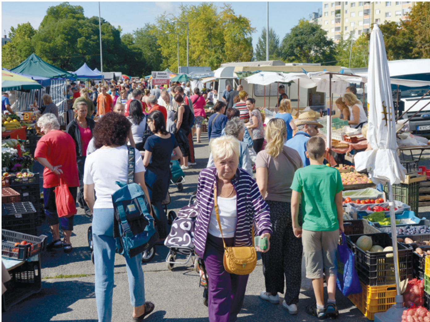
Az önkormányzat egy korszerű vásártérrel fejleszti a Havanna-lakótelepet

Az éves költségvetés elfogadása után a képviselő-testület egyik kiemelten fontos feladata rendszerint az, hogy döntsön a szociális szolgáltatások térítési díjairól, szolgáltatási önköltségről. Ez utóbbit többek között a bérek is befolyásolják. A minimum és a garantált bérminimum, az összevont szociális pótlék emelése, illetve a bölcsődei pótlék bevezetése miatt idén már magasabb illetményekkel