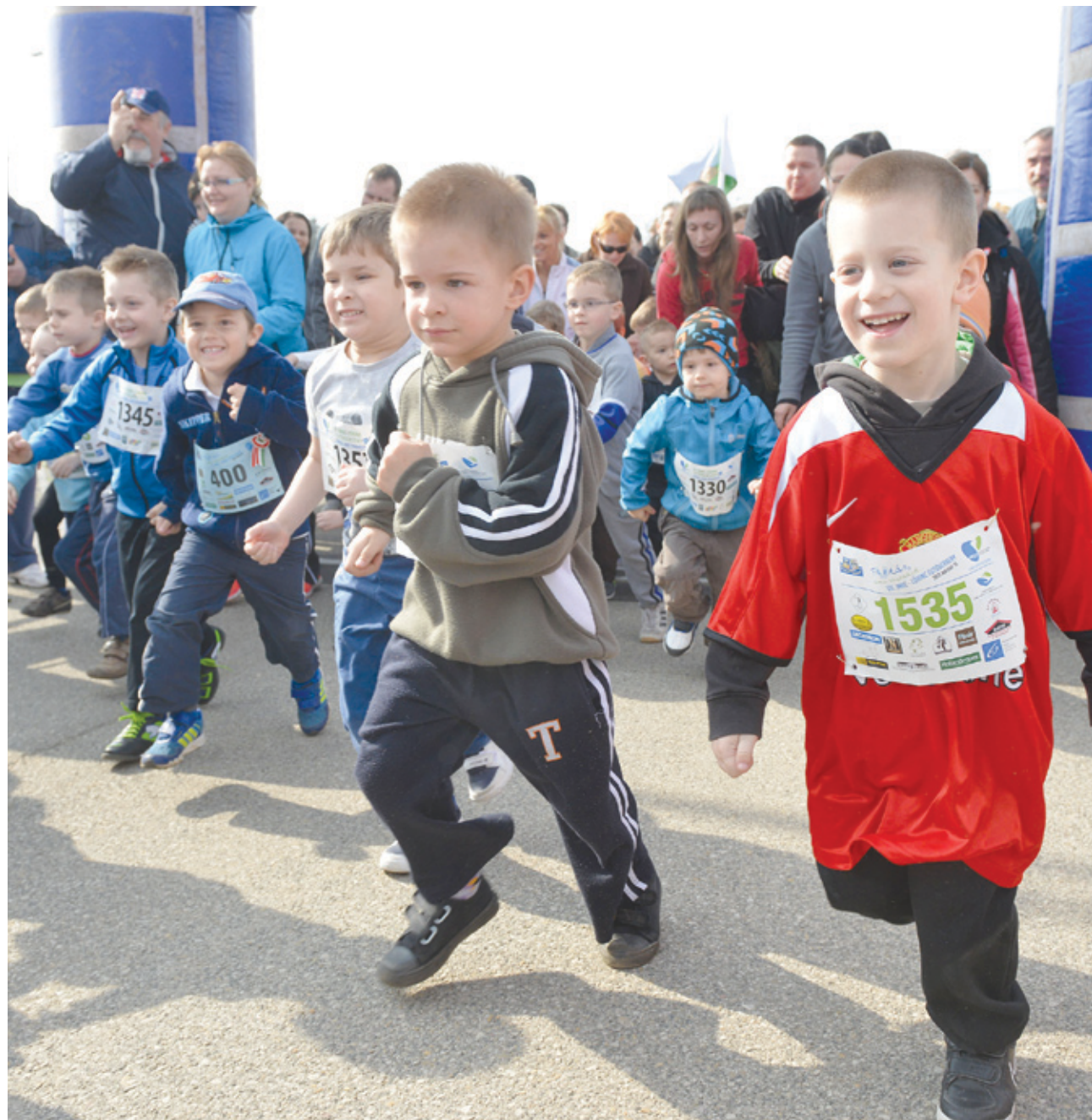
A március 15-ei futóversenyen minden évben a legkisebbek rajtolnak elsőként

➤ Az utcai futóknak bizonyára már évek óta ott szerepel a naptárában az a március 15-i program, amelyik már az elnevezése miatt is szorosan kötődik a kerülethez. Az Imre-Lőrinc-futóverseny kis túlzással fogalomvá vált az elmúlt bő egy évtizedben. Az idei nemzeti ünnepen már tizenkettedszer emlékeznek a hőskörműre úgy, hogy megrendezik a monstre utcai futóversenyt. Az érdeklődés ezúttal is várhatóan rendkívül nagy lesz, főként, ha az időjárás a tavaszt idézi majd.