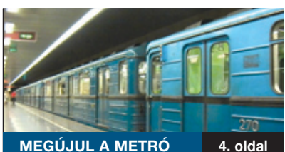
MEGÚJUL A METRÓ 4. oldal