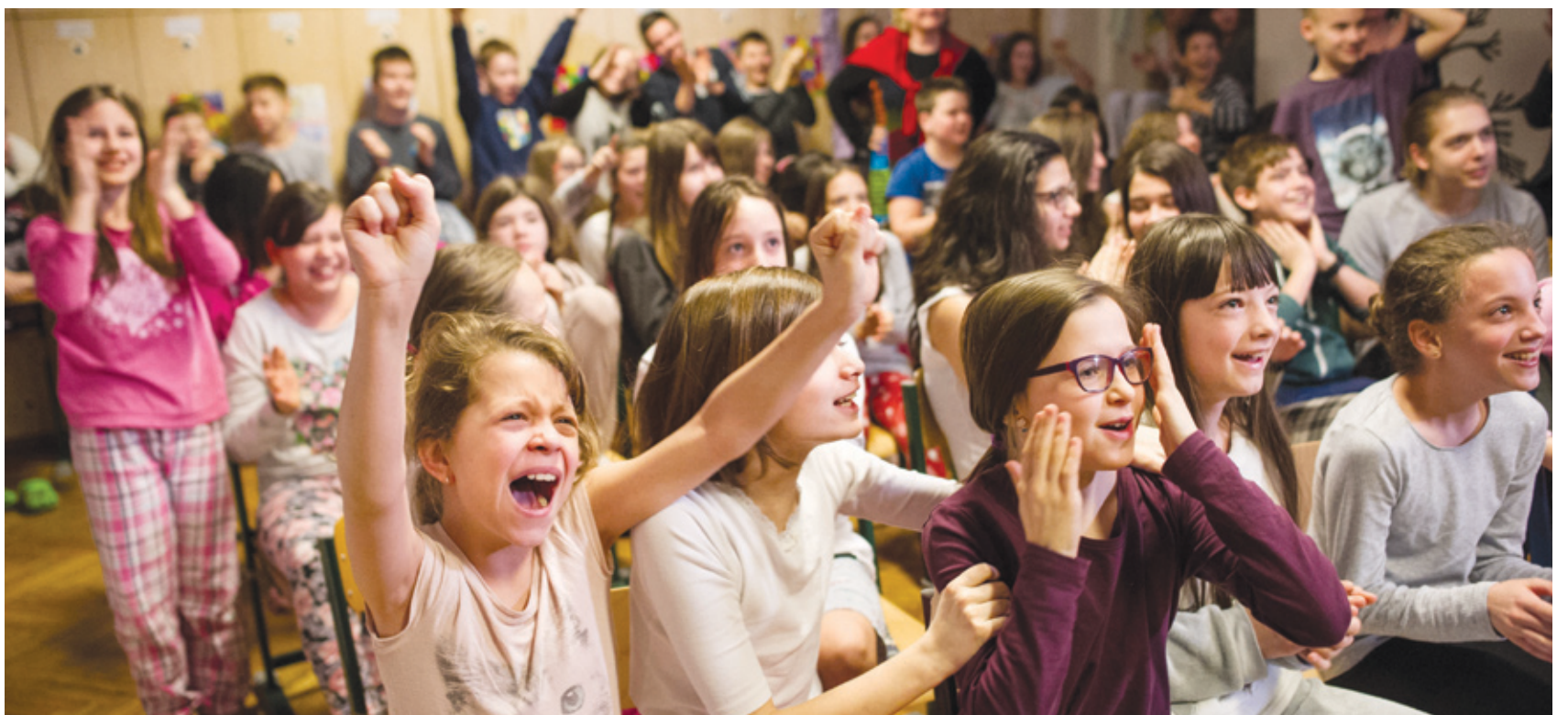
A filmben szereplő gyermekek és társaik kitörő örömmel fogadták a bejelentést