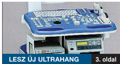
LESZ ÚJ ULTRAHANG 3. oldal