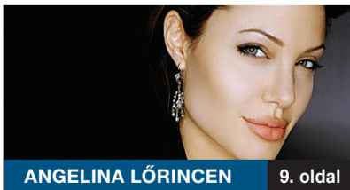
ANGELINA LŐRINCEN 9. oldal

Egy használt, de jó állapotú sósószóró gépet vásárolt decemberben az önkormányzat, s ennek köszönhetően a 270 kilométernyi kerületi mellékúthálózat felét tudja már tisztítani a Városüzemeltető Nonprofit Kft. Kevesen tudják, de fontos lehet tudni, hogy a sósza ma már csak a közutakon megengedett.