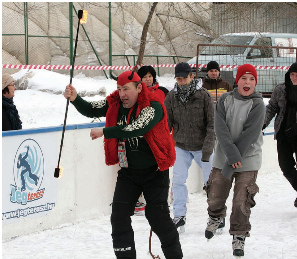
A jégpálya záróprogramjai izgalmas szórakozást tartogatnak

Nagyon gyorsan a kerületek kedvenc találkozóhelyévé vált a Bókay Kertben a jégpálya, éppen ezért hosszabbította meg nyitva tartását február végéig a az önkormányzat. A pálya a tervek szerint február 26-án egy nagyszabású bulival zárul, de az elképzelések alapján a következő téli szezonban is lehet majd itt korcsolyázni.