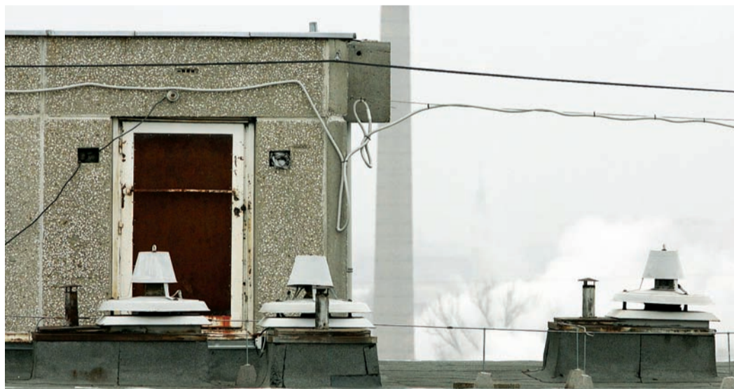
A vizsgálat egyszerű rutineljárás, ha a kémény műszaki állapota megfelelő

Túl sok pénzbe került az új önkormányzatnak olyan kémények után fizetni a büntetést, amelyeket már 2008-ban életveszélyesnek minősített a szakhatóság. A Vagyon18 Nonprofit Zrt. az év elején egy hónapon belül kijavította a hibákat, így a veszély is elhárult, és fizetni sem kell tovább.