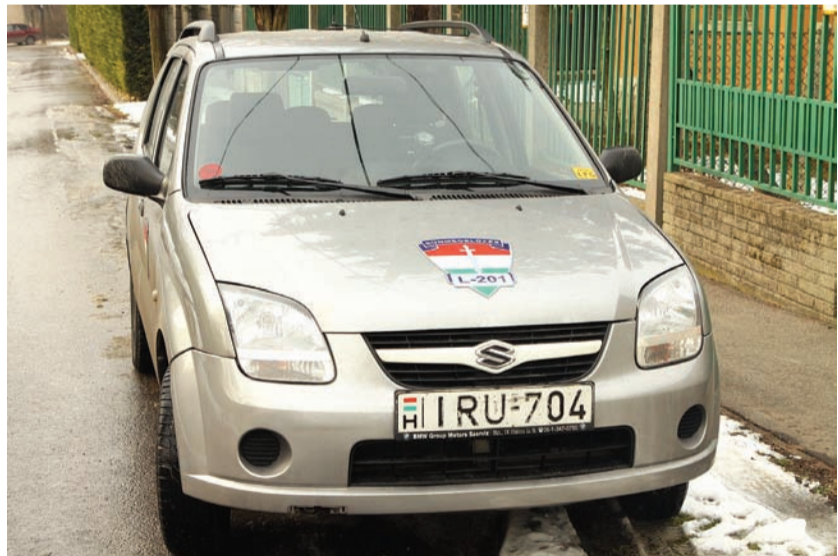
A polgárőrök autóját néhány éve vásárolták

A polgárőrök alkotják a legnagyobb létszámú civil szervezetet az országban. Aktív tagjainak a száma több mint 70 ezer főt számlál, az imrei csoport 15 évvel ezelőtt alakult meg. Ez alatt az idő alatt akadályoztak már meg betörést, és találtak meg eltűnt gyermekeket is.