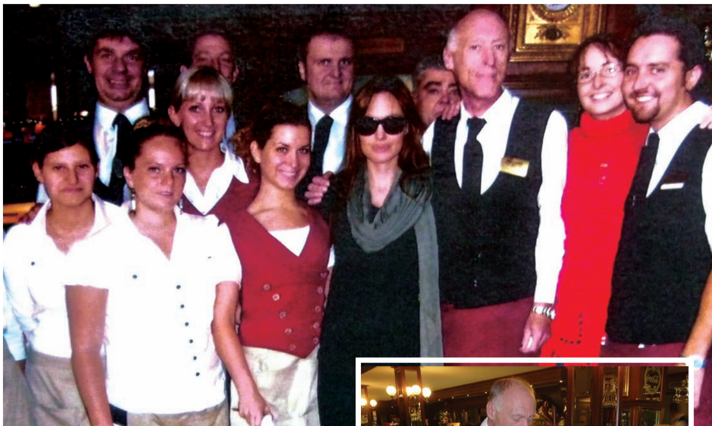
A színésznő közös fotózásra is vállalkozott

válasz után egy közös fotózásra is engedélyt kért, s a világstár szó nélkül beállt a személyzet közé, sőt még a vendégkönyvbe is beírt: „Köszönöm a csodálatos délelőttöt.”