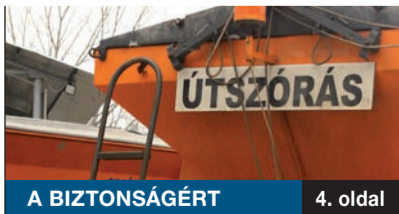
A BIZTONSÁGÉRT 4. oldal