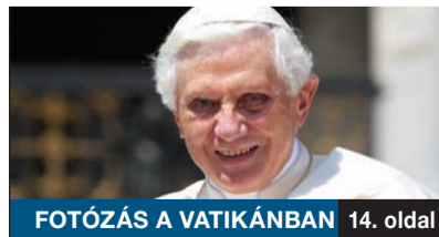
FOTÓZÁS A VATIKÁNBAN 14. oldal

Az elmúlt év végén villámlátogatást tett a kerületben a világhírű színésznő, Angelina Jolie. A világsztár magyarországi tartózkodása során gyermekeivel a lőrinci Zila kávéházban fagyaltozott, s a kikapcsolódás végén köszönetet mondott a cukrászda alkalmazottainak a kedves és figyelmes vendéglátásért.