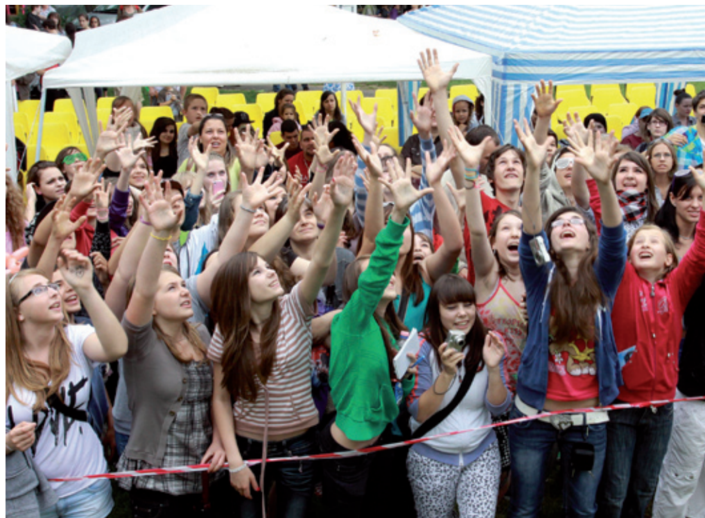
A gyerekek sikeresen fohászokdtek az égiekhez, megúszták a komolyabb esőt

A megszokott színpadi programok mellett állatprodukciók mulattattak a gyermeknapon