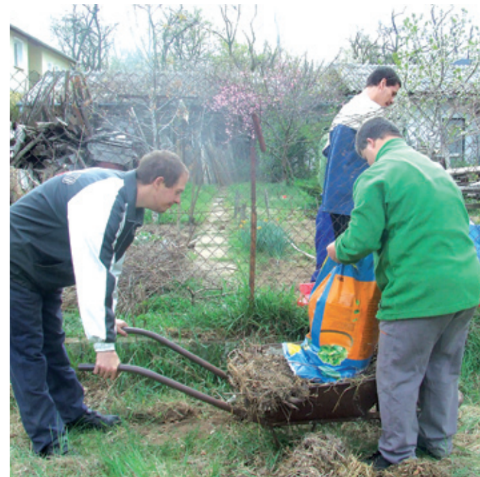
A sérült emberek egymásnak segítenek

– Intézményünk, a Gyöngyvirág Napközi Otthon immár 3. alkalommal rendezte meg önállóan, májusban a Tavasz Zeneünnep 2011 rendezvényünket, ahol ép és sérült emberek egymásnak énekeltek és táncoltak. Fantasztikus érzés volt látni, hogy az ép résztvevők mennyire elfogadták és megszerették a napközi otthon lakóit, a műsor végén közösen együtt táncoltak és énekeltek a színpadon. Sokat hallani a társadalmi integráció-