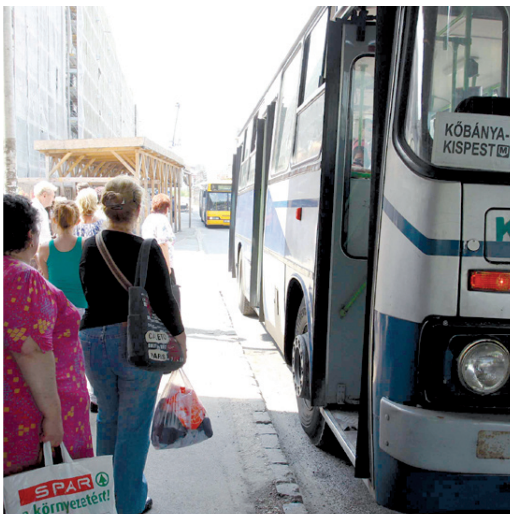
Nyár végéig a Határ útnál lesz a buszok végállomása

A legfontosabb, hogy a Kőbánya-Kispest végállomásánál épülő bevásárlóközpont kivitelezési munkái, az új gyalogosfelüljáró és a metróvégállomás peronjának átépítése miatt a tervek szerint folyamatos vágányzár lesz június 16-án üzemkezdetétől augusztus 19-én üzemzárásig a 3-as metró Határ út és Kőbánya-Kispest állomásai között. - A tervezett időpontok véglegesítéséhez szükséges a Fővárosi Önkormányzat tulajdonosi hozzájárulásának kiadása, amely azonban annak függvénye, hogy a pótláshoz szükséges létesítmények megépüljenek, ami a beruházó feladata - tájékoztatott Horn Gergely projektfejlesztési fősztályvezető. Az időpont azt jelenti, hogy a