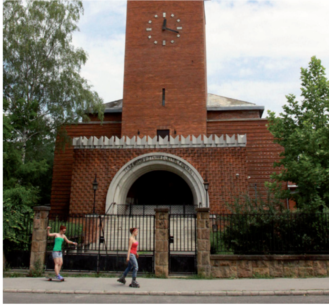
A történetünk összefonódik a község, a város, a kerület életével

Centenáriumát ünnepli a Kossuth téri református egyházközség