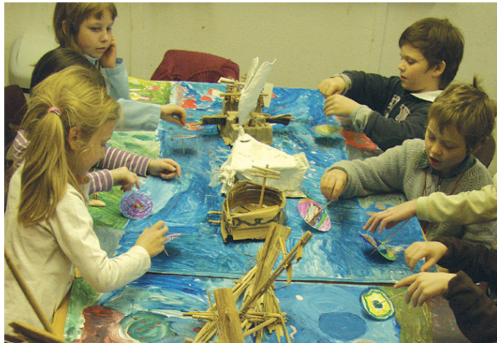
A program a drámajáték és a képzőművészeti alkotómunka ötvöze