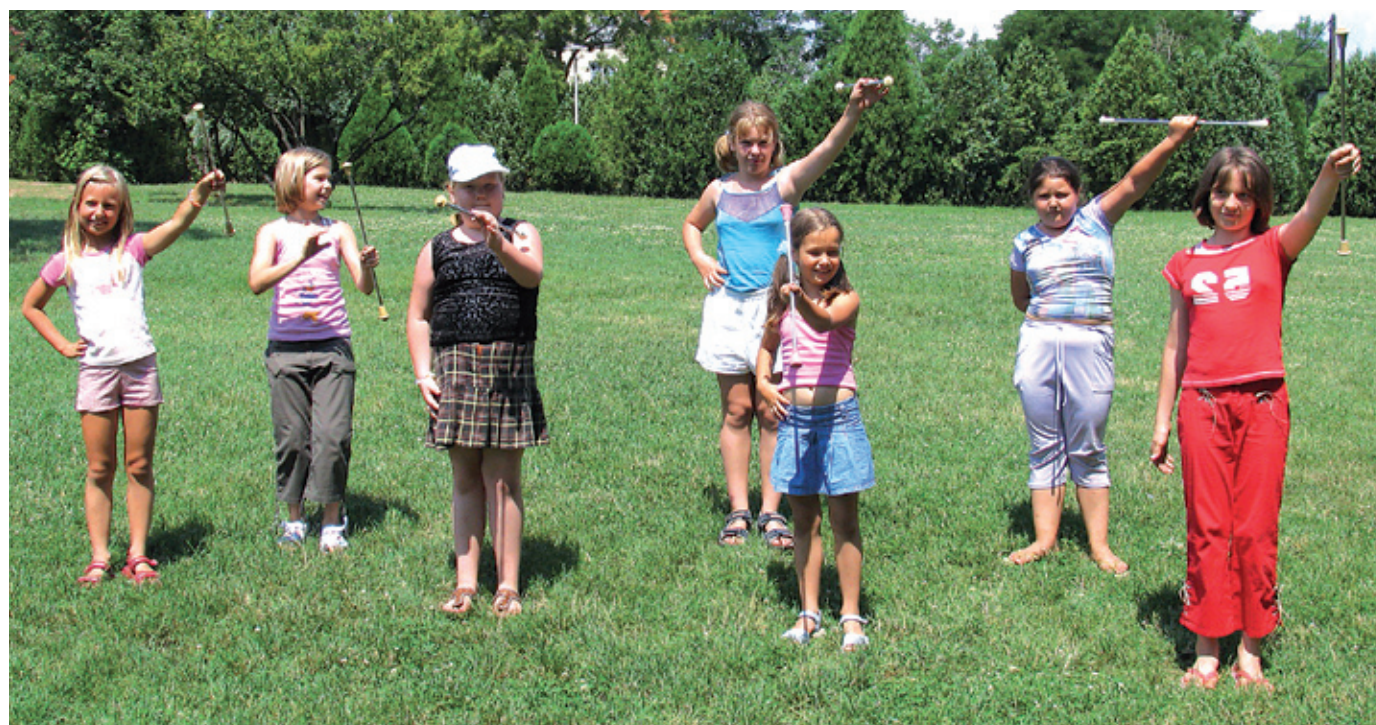
A korábbinál két héttel tovább tart nyitva a tábor, és a szakrajok árát is jelentősen csökkentették

Hamarosan itt a vakáció! A nyári szünet öröm a diákoknak, azonban a szülőknek számos megoldandó problémát jelent. Hol és hogy töltsék csemetéjük a vakációt?