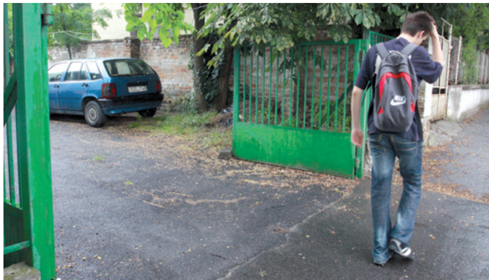
A kapu, amelynek a fejlesztését kifizették, mégsem működik

Felhatalmazás nem volt, mégis közel 50 milliót fizettek ki