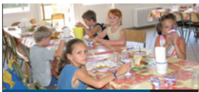
TÁBOR A BÓKAYBAN

Az önkormányzat június 2-án köszöntötte a pedagógusokat, a Fővárosi Művelődési Házban. Itt vehették át a kitüntetettek: A Kerület Óvónője, Tanítója, Tanára, Kiváló Közszelegátért díjakat. Ughy Attila alpolgármester, országgyűlési képviselő kiemelte, hogy a pedagógusok minden generáció életében meghatározó szerepet játszanak.