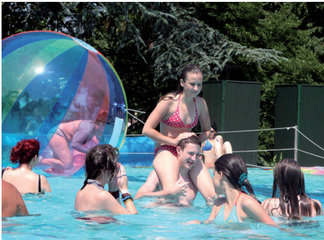
A Park-uszoda strandja ma már igazi kuriózumnak számít a dél-pesti régióban

A Park-uszoda strandja ma már igazi kuriózumnak számít a dél-pesti régióban és az agglomerációban is. A valamikori gazdag strandélet mára – elsősorban anyagi okok miatt – megfakult, egyre-másra zárnak be az egykori kedvelt külvárosi és települési strandok.