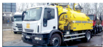
NE FIZESSEN KÉTSZER! 2. oldal