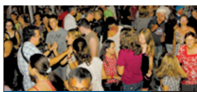
UTCABÁL SZENTIMRÉN 5. oldal

Magyarország Szent István királynak köszönhetően csatlakozott a kereszténységhez, és fogadtatta el magát Európában. Az államalapításra augusztus 20-án koszorúzással emlékeztek a pestszentimrei Hősök terén. Szent István lehetetlennek tűnő feladatot vállalt, kibékíthetetlen ellentéteket kellett feloldania ahhoz, hogy a magyarság tartósan fennmaradjon.