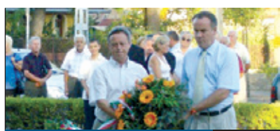
KÖZÖS EMLÉKEZÉS 4. oldal