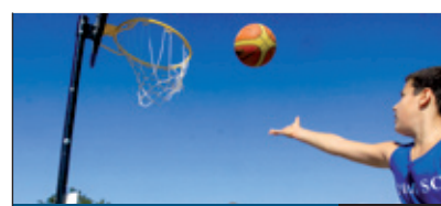
SPORTÍZELTŐ 14. oldal

Délvidéken járt az Üde Színfolt Egyesület. A civil szervezet Erdély és Kárpátalja után látogatott el az egykori déli országrész olyan tájaira, ahova ritkán utazik magyar turista. Az egész út csúcspontja kétségkívül a hajózás volt a Kazán-szorosban, amely mindenkit megdöbbentett. De még rengeteg csodát láttak ezen kívül is.