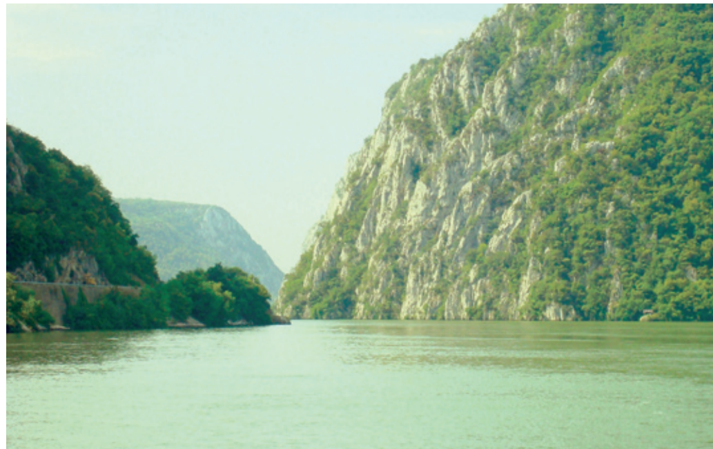
A Kazán-szoros természeti szépsége lenyűgözte az utazáson részt vevőket

Erdély és Kárpátalja után a Délvidéket barangolták be