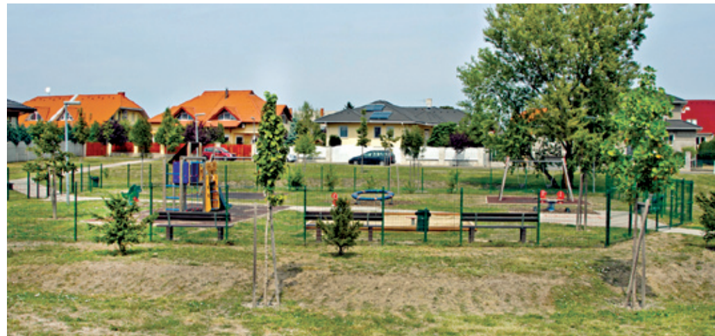
A Búvár Kund tér elsősorban a gyerekek szórakozását szolgálja