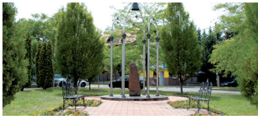
Rendben vannak az Üllői út menti parkok is

A kerületi zöldterületek csinosításával is készült az augusztus 20-i ünnepre a Városgazda XVIII. kerület Nonprofit Zrt. Az ünnepi díszítés mellett fontos volt, hogy a helyi zöldfelületek is felfrissüljenek a hosszú hétvégére. Az idén már kaszáltak a kerületi parkokban, tereken és lakótelepeken. Nagy feladat volt a Thököly úti szakrendelő parkolójának