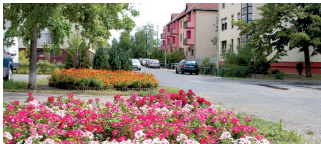
Alacska új palánták díszítik az utak mentét