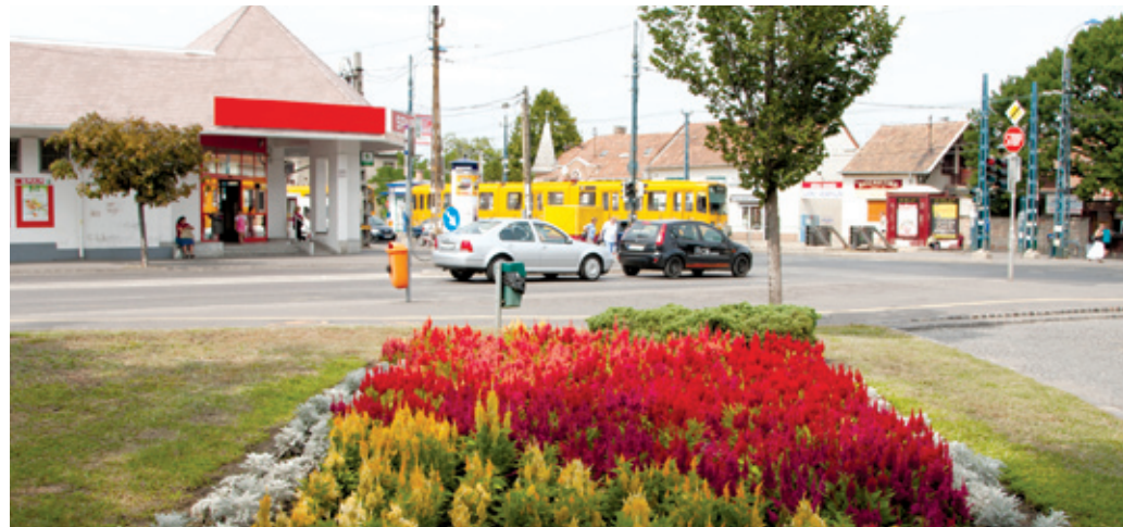
A Béke téren frissültek a virágágyások