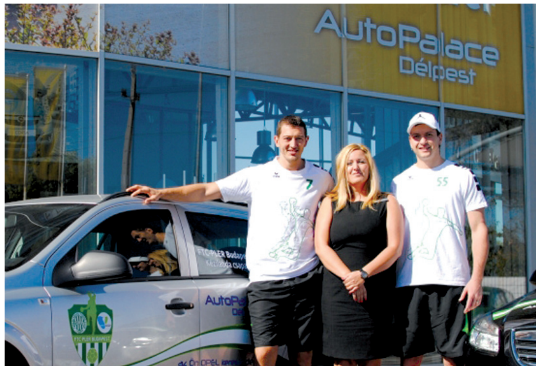
Egy éven át kiváló gépkocsikkal járhatnak a játékosok az edzésre