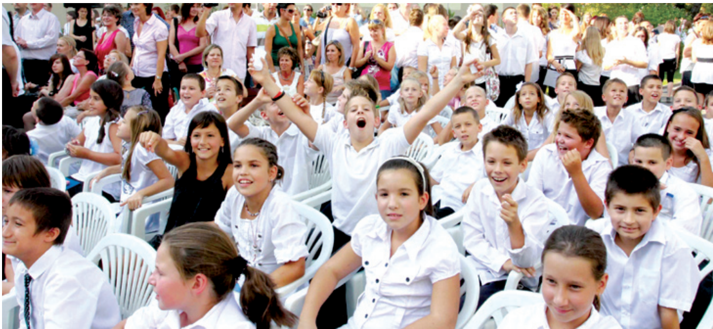
A diákok remélhetően észre sem veszik majd, hogy január 1-jétől megváltozik az intézmények fenntartása

A minőségi oktatásügy nemzeti sorskérdés. Olyan stratégiai ágazat, amelyik évtizedekre meghatározza az ország lehetőségeit és akár egy életre az egyén identitását. A nemzeti kormány elkötelezett egy olyan oktatási modell mellett, amely kiterjeszti a lehetőségeket, és modern, használható tudás átadásával erősíti a nemzeti öntudatot. Ezt csak egységes irányítással és szervezéssel lehet hatékonyan megoldani. Éppen ezért a köznevelési intézmények feladatait 2013. január 1-jétől az állam látja el a Klebelsberg Intézményfenntartó Központon keresztül.