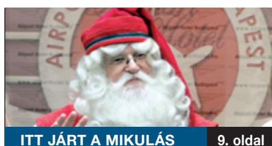
ITT JÁRT A MIKULÁS

Zöldterületekben rendkívül gazdag a XVIII. kerület, és hogy ez így is maradjon, ahhoz szükség van a növényzet folyamatos frissítésére, az elpusztult, kivágott fák pótlására. Ebben nagy szerepe van a Városgazda XVIII. kerület Nonprofit Zrt.-nek, amely az esztendő végéig két ütemben több száz fát ültet el a társaság ügyfélszolgálatának szervezésében.