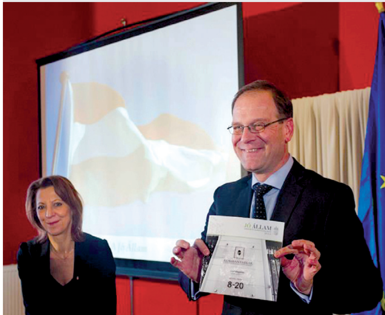
Navracsics Tibor miniszterelnök-helyettes örömmel jelentette be, hogy a kormányablakoknál ügyfélbarát módon munkanapokon este 8 óráig várják majd a lakosságot, és egyszerűbb lesz az ügyintézés

A jövő esztendőitől több mint 2000 ügyben járhatunk el könnyebben