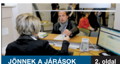
JÖNNEK A JÁRÁSOK