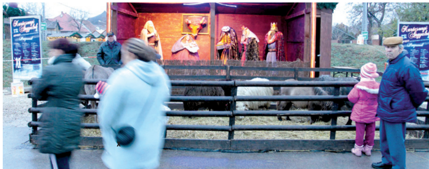
A tere látogató gyermekek kedvenc helye lehet a betlehemi jászol és az állatsimogató

A régi piactéren megkezdődött a kerületi közösség adventje