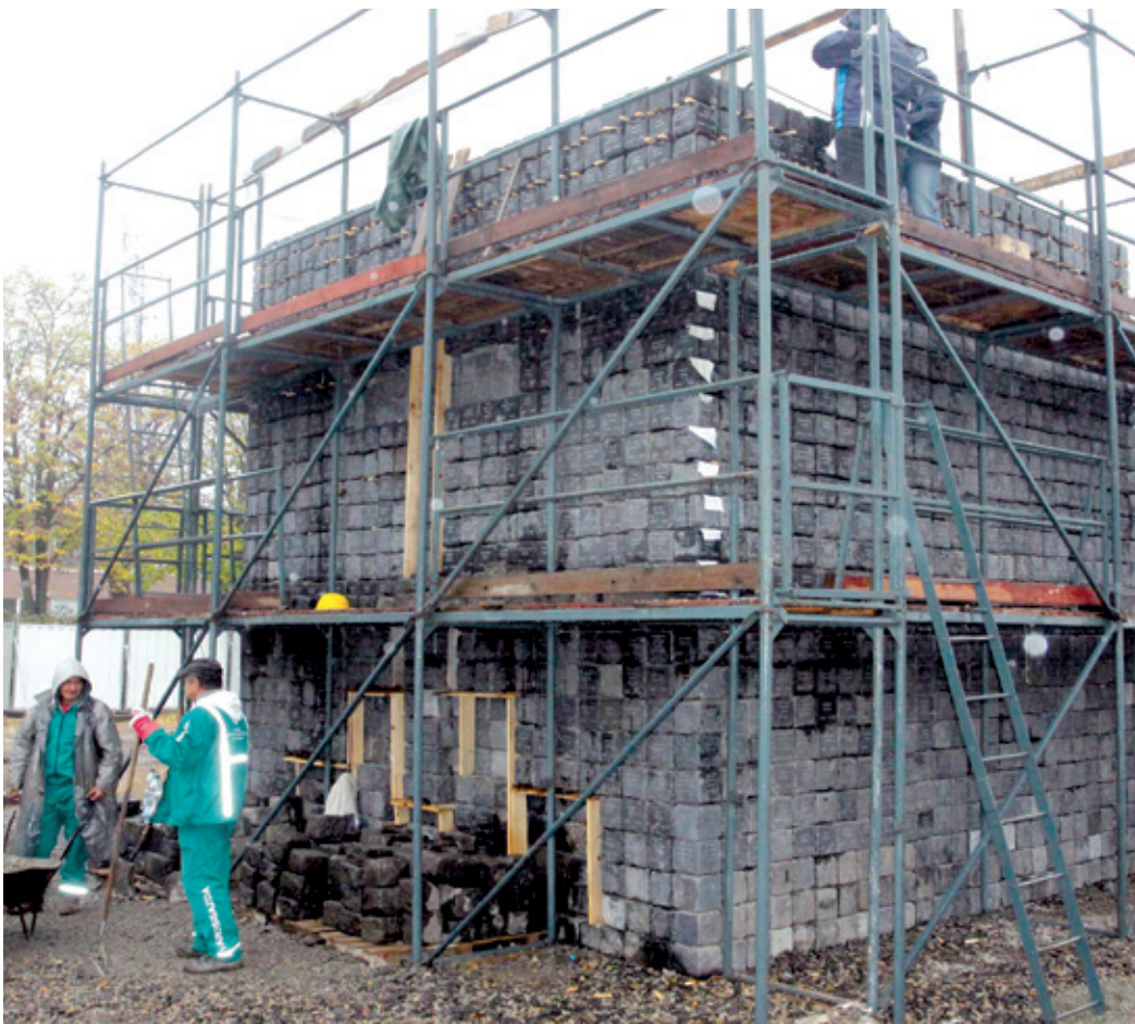
Az 1956-os áldozatokra emlékeztető alkotás egy hónap alatt készült el

– A november 4-re kitűzött átadás miatt rövid idő állt a ki-