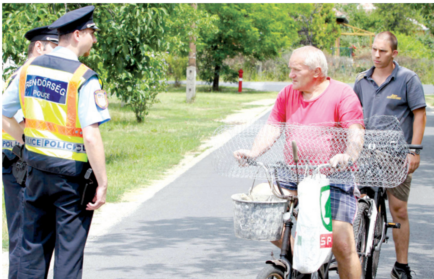
A BRFK várhatóan növelni fogja a kerületi rendőrség állományát

Az egyesület szeretné tovább gyarapítani a sikereket, ám – mint annyi más hasonló szervezet – komoly küzdelmet folytat az anyagi háttér megerősítéséért. A finansziális gondokat igyekszik enyhíteni az önkormányzat azzal a dönté-