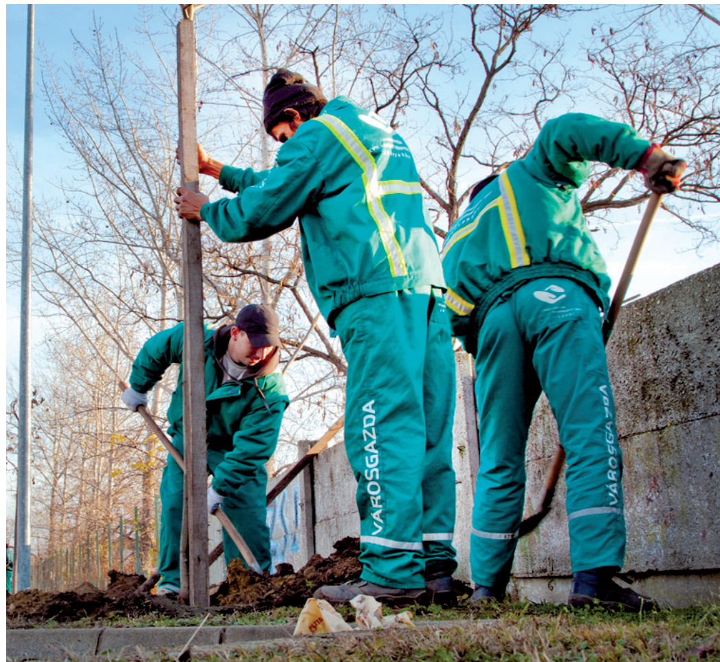
Két ütemben összesen 450 fát ültetnek el a kerületben a Városgazda munkatársai

– Ezért telepítettünk fasort a Nefejejs és a Bartha Lajos utcába, valamint a Zsebők Zoltán Szakrendelő mögötti járdá mellé, ahol egy csúnya bozotos, bokros területet szépítettünk meg. Biztonsági okokból arra is