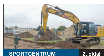
SPORTCENTRUM 2. oldal

JÓ ÜTEMEN HALAD a Vilmos Endre Sportcentrumban az új műfüves labdarúgópálya építése, és megkezdődött az élőfüves pálya felújítása is. A beruházás az MLSZ Budapesti Pályafejlesztési Programja révén valósul meg. A projekt keretében a kerületben további két létesítményben, a Gerely utcai sporttelepen és a Deák Ferenc „Bamba” Sportcentrumban folynak majd munkálatok.