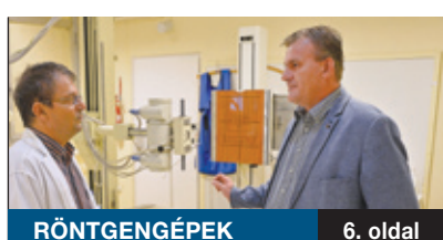
RÖNTGENGÉPEK 6. oldal

JÓ ÜTEMEN HALAD a Vilmos Endre Sportcentrumban az új műfüves labdarúgópálya építése, és megkezdődött az élőfüves pálya felújítása is. A beruházás az MLSZ Budapesti Pályafejlesztési Programja révén valósul meg. A projekt keretében a kerületben további két létesítményben, a Gerely utcai sporttelepen és a Deák Ferenc „Bamba” Sportcentrumban folynak majd munkálatok.