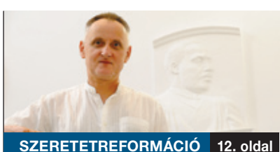
SZERETETREFORMÁCIÓ 12. oldal

TÖBB MINT HETVEN felnőtt csapat főzött a Bókay-kerti Napok Csülökfesztiválján. A legtöbb helyen bogrács alatt pattogott a tűz, de a grillezés kedvelői is kitétek magukért. A Fesztiválszínpadon a Csik zenekar nívós magyar népzenei és világzenei koncertjét élvezhették, majd zárásként a Nagyszínpadon az LGT sztárjaival érkező Zenevonat visszarépett az időben.