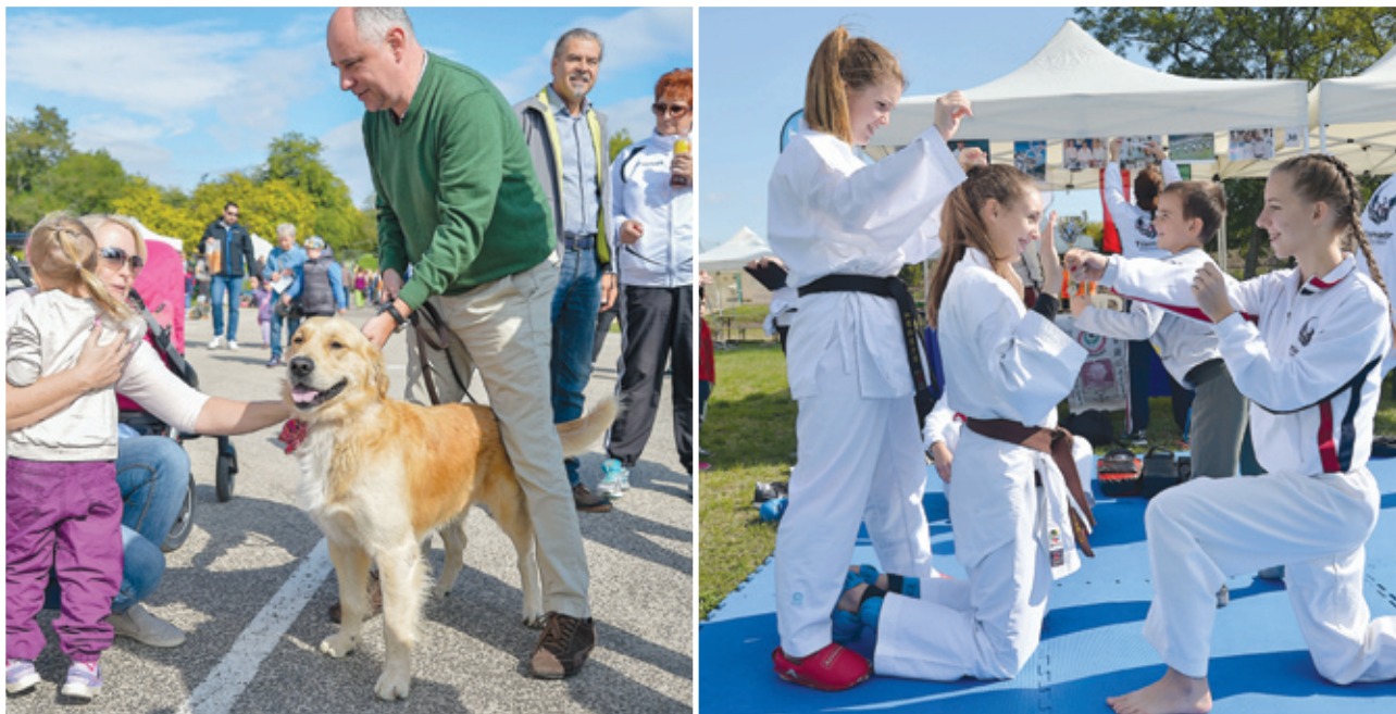
A vidám hangulatú napon a kutyások és a sportolók is jól érezték magukat

➤ A Bókay-kert egyik legnépszerűbb programja a minden év szeptemberében megrendezett Sportízélítő, amely azt a célt szolgálja, hogy közel hozza az érdeklődőkhöz – elsősorban a fiatalokhoz – a sportágakat, hogy kedvükre válogathassanak közöttük. Így volt ez az idén is.