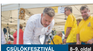
CSÜLÖKFESZTIVÁL 8–9. oldal