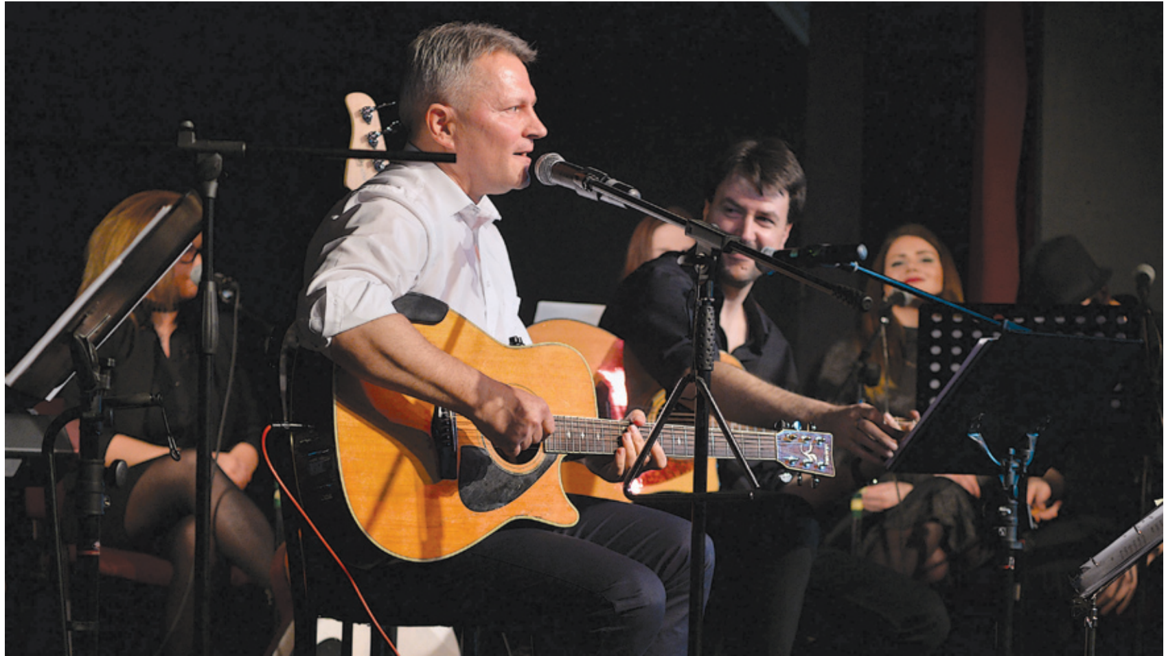
Kucsák László országgyűlési képviselő idén is jótékonyági koncertet ad a barátaival

„Ott leszek! És viszem a családot is! Tavaly voltam először, fantasztikus hangulat volt!” – írja egy hölgy az országgyűlési képviselő Facebook-oldalán az eseményt népszerűsítő videóra rea-