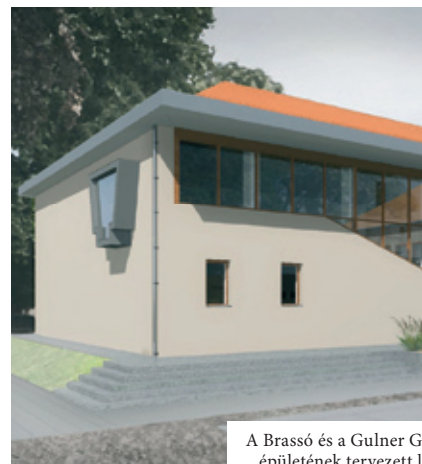
A Brassó és a Gulner Gyula iskola kibővített épületének tervezett látványterve látható