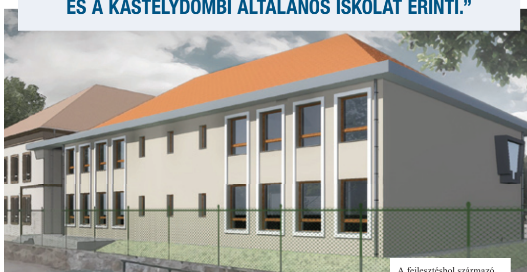
A fejlesztésből származó előnyök mindenki számára kézzelfoghatóvá válnak

nyekben összesen tizenhárom, a korszerű pedagógiai módszerek alkalmazását lehetővé tevő új tantermet, egy közösségi teret és négy új szertárat alakítanak ki, továbbá étkező, konyha és vizesblokkok is létesülnek. A fejlesztésből származó előnyök mindenki számára kézzelfoghatóvá válnak: a dolgozók színvonalas körülmények között folytathatják munkájukat, a megfelelő körülmények között zajló oktatás pedig megalapozhatja a gyerekek jövőjét.