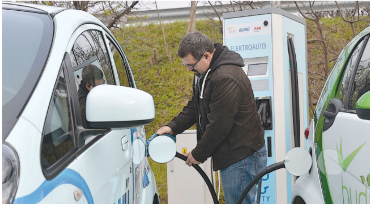
Újabb elektromos töltőállomások létesülhetnek a kerületben

Fontos döntést hozott a képviselő-testület, amikor úgy határozott, hogy felülvizsgálja az érvényben lévő városrendezési és építési szabályzatot. Erre azért van szükség, mert Pestszentlőrinc és Pestszentimre több kisebb területét is rendezni, fejleszteni kívánja az önkormányzat, ám a tervezés során felmerült,