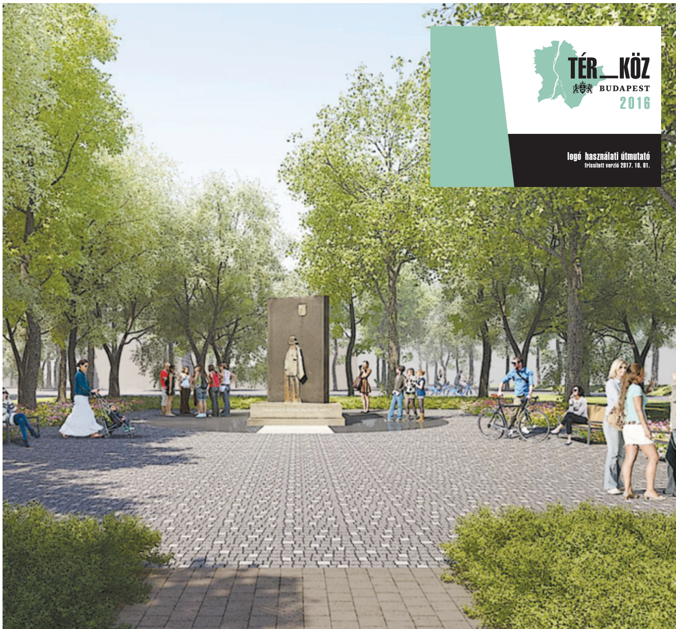
A nyáresti sétákon különösen látványos lesz a park vízi játéka

Nemcsak szebb, nagyobb is lesz a terület