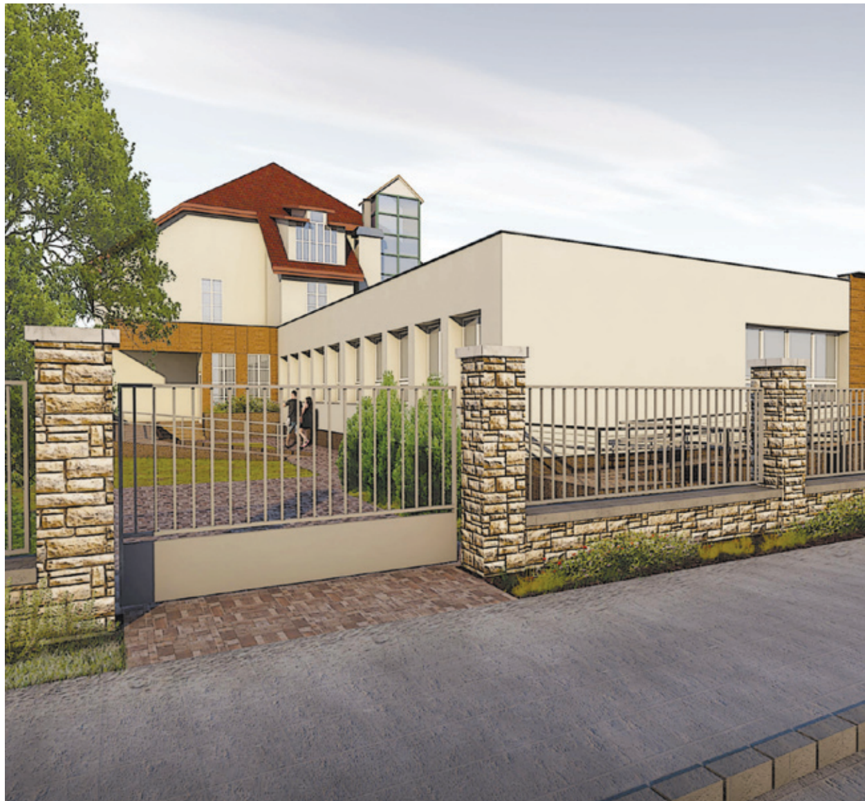
A megújuló rendelő a XXI. századi igényeknek megfelelő korszerű komplexum lesz

Pestszentlőrinc-Pestszentimre évről évre egyre több kisgyermekes családot vonz, sokan választják lakhelyül a lakótelepi, de még inkább a kertvárosi területeket. A lakóhely kiválasztásában az egyik legfontosabb szempont az or-