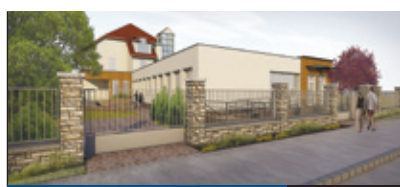
MEGÚJUL A RENDELŐ

A KORÁBBI TERVEKNEK megfelelően folytatódik a Lakatos-lakótelep szomszédságában lévő Brenner János-pihenőpark fejlesztése. Az Erőmű-tó környezete hatalmas változáson ment keresztül az elmúlt években. A fejlesztés 2014-ben kezdődött, azóta a tó kitisztításával, a part és a környezet pihenőparkká alakításával látványos területrehabilitáció zajlik itt.