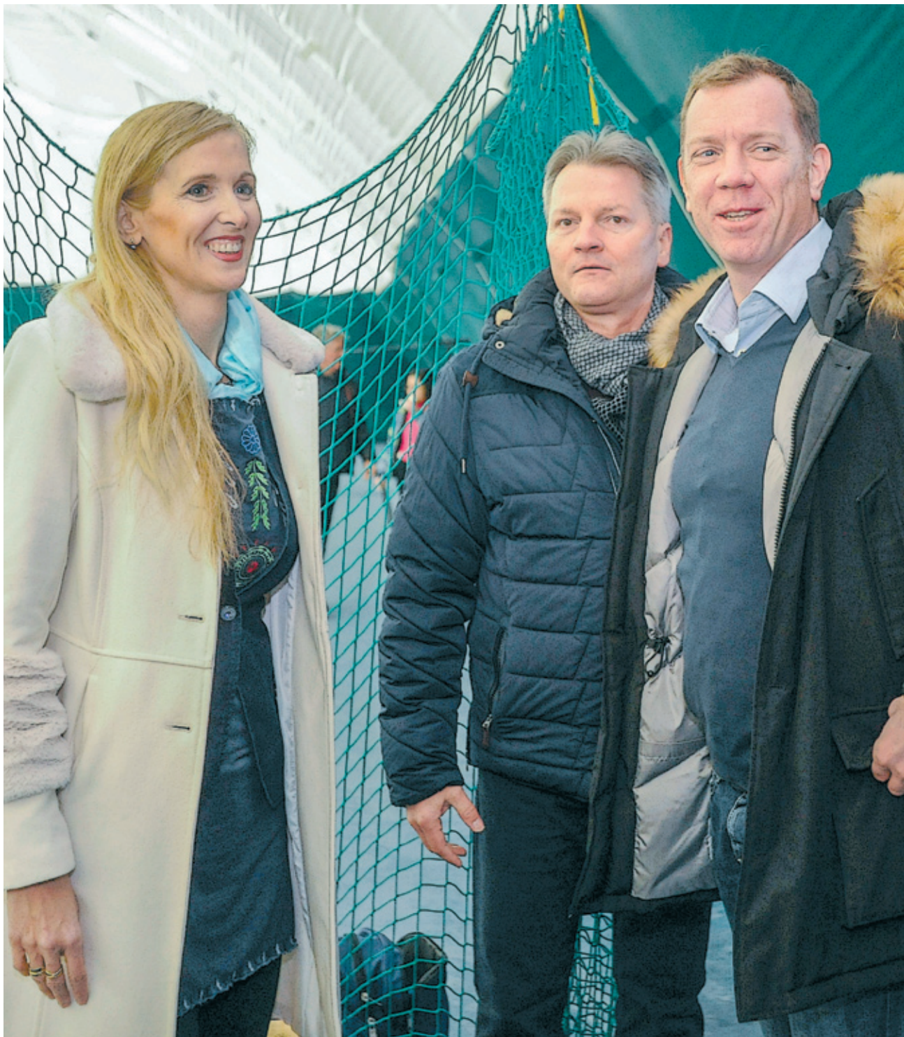
A speciális nevelési igényű sportolók bemutatóját Szabó Tünde sportért felelős államtitkár, Kucsák László országgyűlési képviselő és März Tamás olimpiai bajnok vízilabdázó is örömmel figyelte

Ötödik alkalommal rendezték meg az önkormányzat támogatásával a Bókay-kert fedett teniszpályáin az Európai Speciális Olimpia Tenisznapot, amelynek keretében speciális nevelési igényű fiúk és lányok ragadtak ütőt, bebizonyítva, hogy a helyzetüktől függetlenül nem áll távol tőlük a sport.