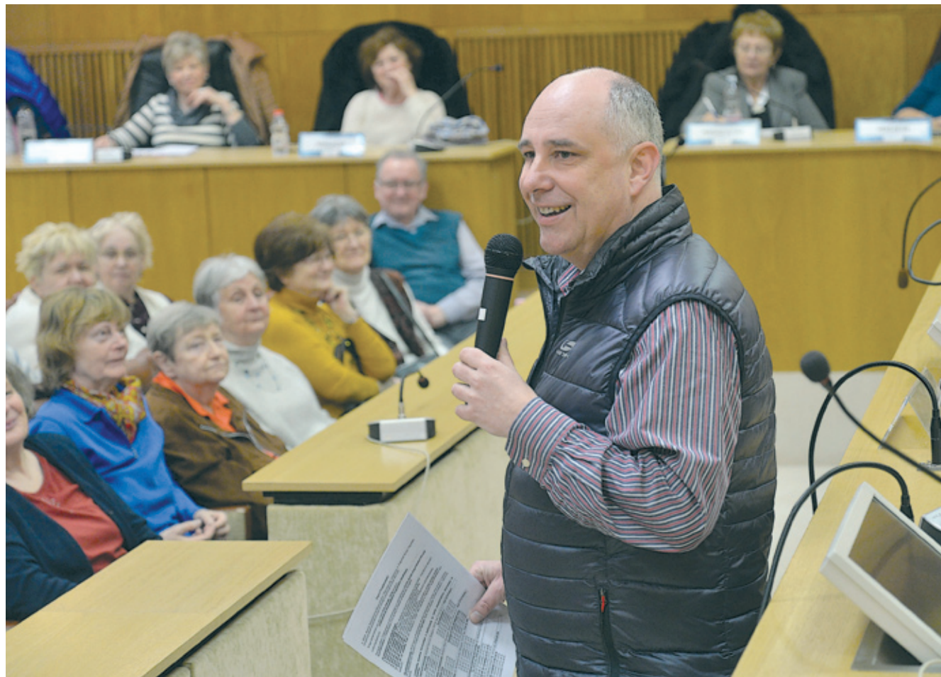
Ughy Attila polgármester büszke azokra, akik évek óta kitartóan látogatják az akadémiát

A túlzott internetezés nem csak a fiataloknál probléma