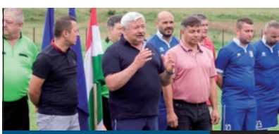
EGY NAP A CSATATÉREN