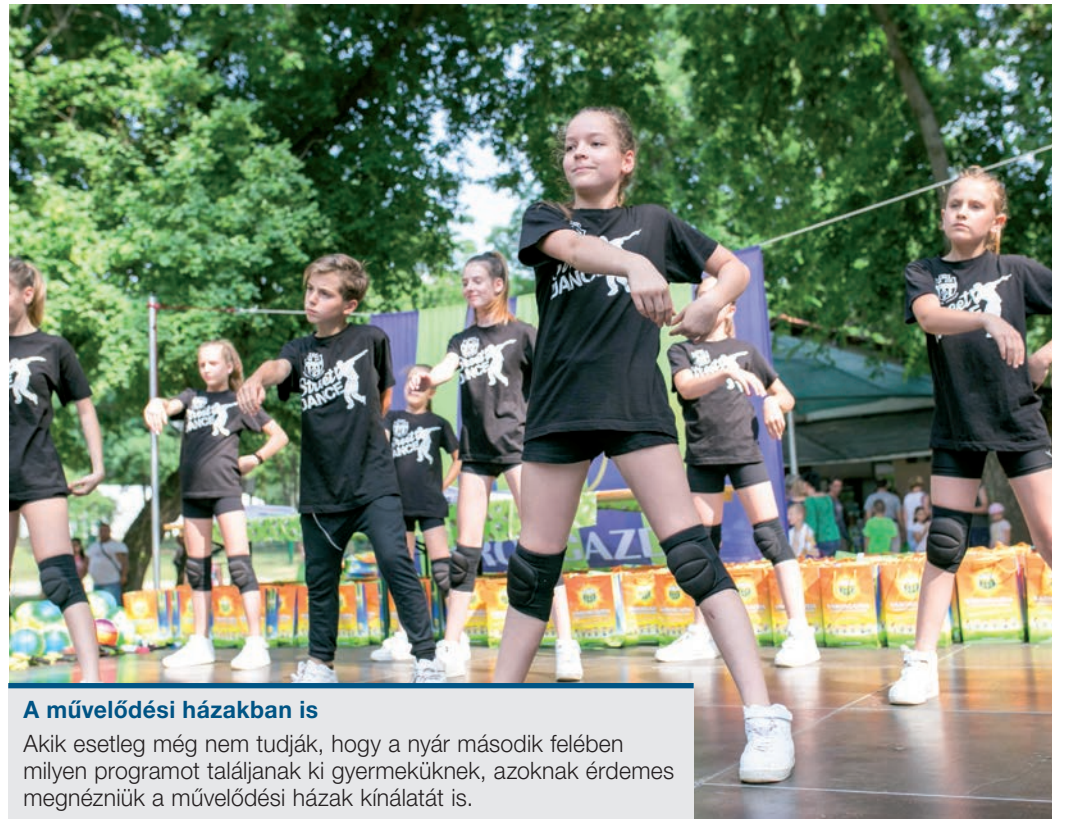
A művelődési házakban is

A XVIII. kerületi Polgármesteri Hivatal öt éve vesz részt a „Nyári diákmunka” programban, melyet a korábbi Nemzetgazdasági Minisztérium kezdeményezett. Ehhez azok a 16–25 éves diákok csatlakozhatnak, akik a tanév végétől diákmunkára álláskeresőként regisztrálnak a XVIII. kerületi Kormányhivatal foglalkoztatási osztályánál. A hivatalban akár kétszer 13 diák is dolgozhat irodai kisegítő munkakörben, igényes környezetben adminisztrációs vagy könnyű fizikai munkát végezve, miközben bepillantást nyernek a munka világába.