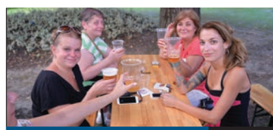
IDÉN IS LESZ SÖRFESTIVÁL