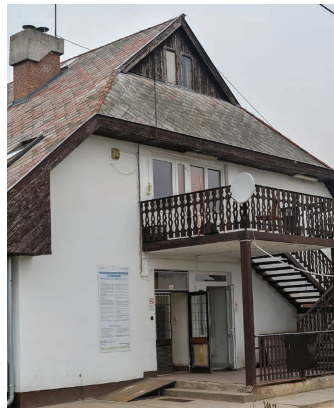
A sportszálló felújítását is segíti a kézilabda-szövetség pályázata

A Sport- és Ifjúsági Szálló emeleti szintjén beépített szekrényeket kívánják kialakítani, mert sem a szobákban, sem a közösségi helyiségekben nincsenek megfelelő tárolók. Emellett felújítják a homlokzatot, kicserélik a kazánház nyílászáróit, és tűzjelző rendszert alakítanak ki.