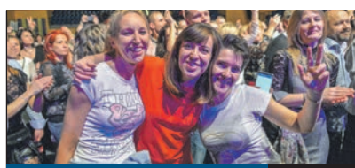
VIDÁM RETRO MŰSOR

AZ INFRASTRUKTURÁLIS fejlesztések között a közlekedés biztonságosabbá tétele és a parkolóhelyek számának növelése legalább olyan fontos feladat a XVIII. kerületi önkormányzat számára, mint az utakkal, járdákkal összefüggő beruházások, hiszen ezek egyformán érintik mind a gyalogosokat, mind az autóval közlekedőket mindennapjaikat.