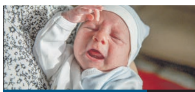
AZ ELSŐ BABA

A HAJNALI ÓRÁKIG a retró zene fellegváraként szolgált a Pestszentimrei Sportkastély december 28-án. Generációk sztárjai adták kézzel a mikrofont, és egy zenei időutazás élményével gazdagabban engedték haza a Retro Show nagyjérdemű közönségét. Többek között Zalatnay Sarolta, Korda György és Balázs Klári valamint Sipos F. Tamás lépett fel.