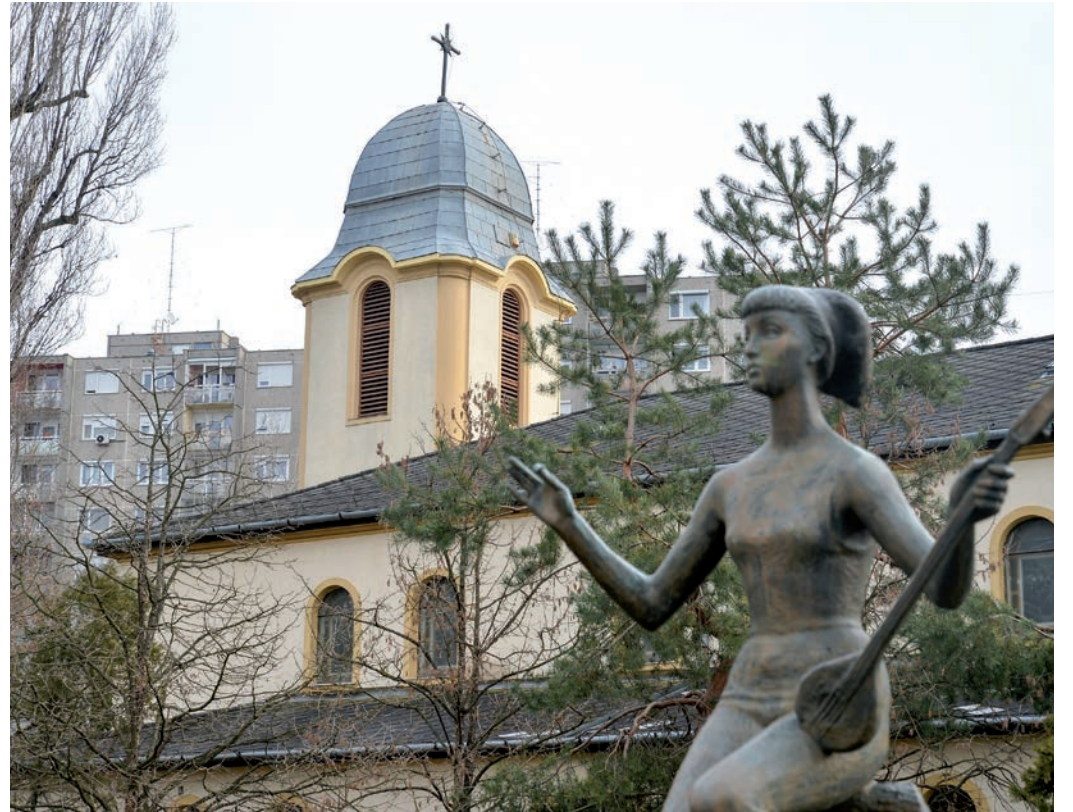
A Szent László-plébániatemplom tetőfelújítását is támogatta az önkormányzat

1. A képviselő-testület 18 igen szavazattal egyhangúlag úgy döntött, hogy a Kastélydombi Általános Iskola (a 140482/5 hrsz-ú, 1188 Nemes utca 58–60. alatt található, 13 235 m 2 alapterületű, kivett általános iskola megnevezésű ingatlan), a Brassó Utcai Általános Iskola (a 148113 hrsz-ú, 1182 Brassó utca 1. alatt található, 9472 m 2 alapterületű, kivett általános iskola megnevezésű ingatlan), a Gulner Gyula Általános Iskola (a 155607/6 hrsz-ú, 1183 Gulner Gyula utca 1. alatt található, 7185 m 2 alapterületű kivett általános iskola megnevezésű ingatlan) bővítésére együttműködési megállapodást köt a Nemzeti Sportközpontokkal. A képviselők felkérték és felhatalmazták a polgármestert az előterjesztés 1. sz. mellékletét képező együttműködési megállapodás véglegesítését követő aláírására és a beruházás megvalósításához szükséges egyéb intézkedésekre.