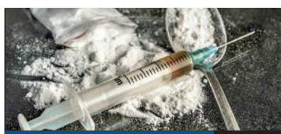
DROGMEGELŐZÉS 8. oldal

MÁR NEM KELL AGGÓDNUNK azért, hogy egy váratlanul felmerülő, súlyos egészségügyi problémával hosszan kell várakoznunk a sürgősségi osztályon, mert a triázrendszernek köszönhetően a megvizsgált beteget néhány percen belül a megfelelő szakorvoshoz irányítják tovább. A január 1-jétől működő rendszer révén minimálisra csökkenhet a várakozási idő.