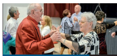
TÁNCKLUB 10. oldal

SENKI NEM VITATJA, hogy már egy általános iskolás gyerek is könnyen kapcsolatba kerülhet a drogokkal, ami soha nem vezet jóra. A megelőzés leghatékonyabb módja az, ha a fiatalok és a családok pontos ismereteket kapnak a kábítószerrel kapcsolatos problémákról. A kerületi Kábítószerügyi Egyeztető Fórum ebben igyekszik segíteni.