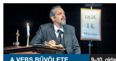
A VERS BŰVÖLETE

A MUNKAADÓK ÉS A MUNKÁT KERESŐ kerületiek egymásra találását célozta a Budapest Főváros Kormányhivatala Foglalkoztatási Főosztálya és a XVIII. kerületi Hivatal által közösen szervezett állásbörze április 4-én a Rózsa Művelődési Házban. Az eseményre ellátogató érdeklődők azt is megtudhatták, hogy miként kell egy állásinterjúra jól felkészülni.