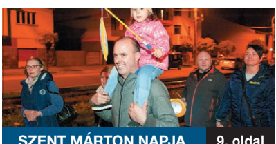
SVENT MÁRTON NAPJA 9. oldal