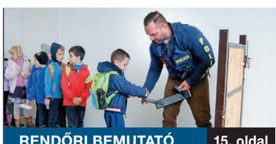
RENDŐRI BEMUTATÓ 15. oldal

SZEMNEK, SZÍVNEK TETSZŐ felvonulásokkal tették emlékeztetést Szent Márton napját november 11-én Pestszentlőrincen, majd 12-én a kerület másik városrészében, Pestszentimren. Sok százan gondolták úgy, hogy nem hiányozhatnak az önkormányzat támogatásával, a XVIII. kerületi Német Nemzetiségi Önkormányzat szervezésében megrendezett felvonulásról.