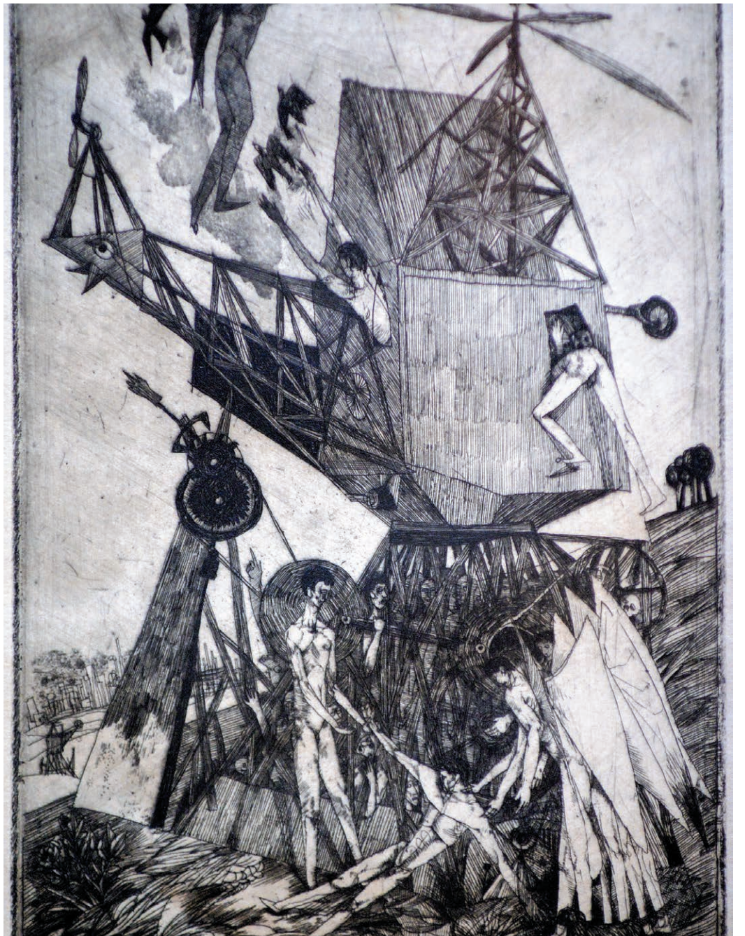
Bombázás, olaj, vászon, 1964 (Herman Ottó Múzeum, Miskolc)