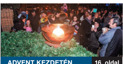
ADVENT KEZDETÉN 16. oldal

A RENDŐRÖK VÁLTOZATOS MUNKÁJÁRÓL némi filmipari túlszínésítéssel tévésorozatok tucaitjai regélnek, amelyekhez kikérték a hivatásosok tanácsait is. A BRFK XVIII. kerületi Rendőrkapitánysága a hagyományaihoz híven nyílt napot szervezett november 5-én, amelyen az általános iskolások örömeire bemutatókat tartottak a rend őreinek szerteágazó feladataiból.