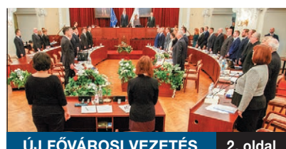
ÚJ FŐVÁROSI VEZETÉS 2. oldal

A FŐVÁROSI KÖZGYŰLÉS november 5-i alakuló ülésén letették az esküjüket a képviselők, s megválasztották az új főpolgármester-helyetteseket és a bizottságok tagjait. Az alakuló ülésen Karácsony Gergely azt ígérte, hogy három pillér szerint vezetik a várost az elkövetkező öt évben, és az új vezetés nem engedni gyengíteni vagy szűkíteni a város autonómiáját.