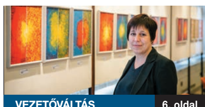
VEZETŐVÁLTÁS 6. oldal

2012. FEBRUÁR 3-ÁN UTASOK NÉLKÜL tért vissza Helsinkiből a Malév repülőgépe Ferihegyre. Sem magyar, sem külföldi utast nem köszöntöttek azóta a gép ajtajánál a mindig kedvesen mosolygó stewardessek. A politika, a gazdaság földre kényszerítette a több mint 60 éves múltú visszatekintő nemzeti légitársaságot.