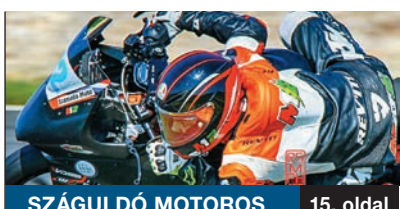
SZÁGULDÓ MOTOROS 15. oldal