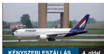
KÉNYSZERLESZÁLLÁS 4. oldal

2012. FEBRUÁR 3-ÁN UTASOK NÉLKÜL tért vissza Helsinkiből a Malév repülőgépe Ferihegyre. Sem magyar, sem külföldi utast nem köszöntöttek azóta a gép ajtajánál a mindig kedvesen mosolygó stewardessek. A politika, a gazdaság földre kényszerítette a több mint 60 éves múltú visszatekintő nemzeti légitársaságot.