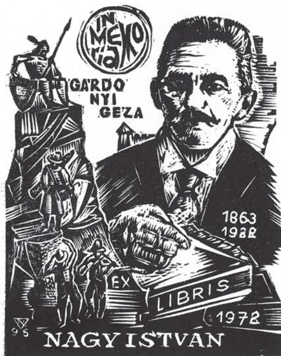
(Nagy László Lázár rajza)