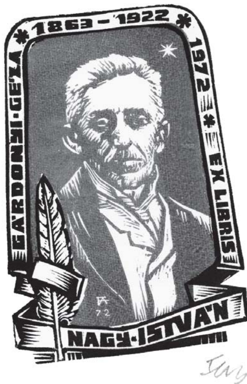
(Fery Antal rajza)

bát ne mondd, hogy nem tudod, merre jársz, ne mondd, hogy megfeledkeztek rólad dalaikkal a szeméremajkú démonok.