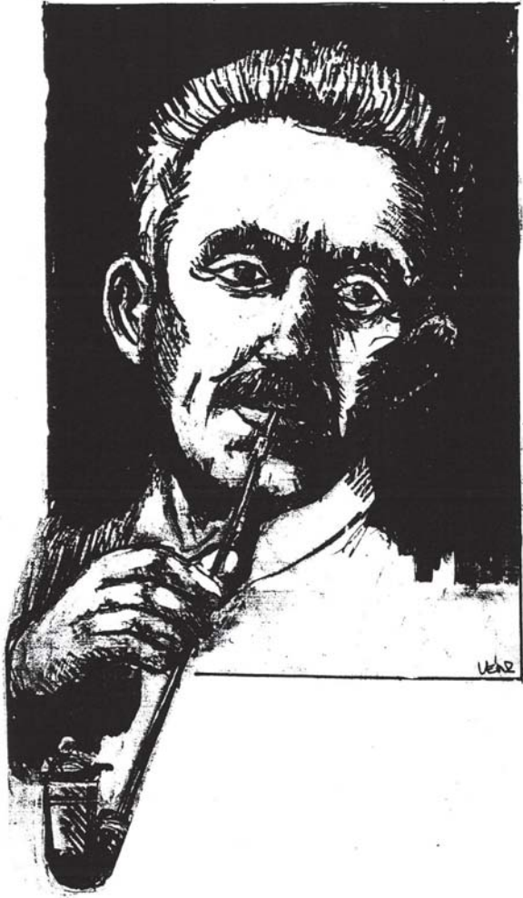
(Vén Zoltán rajza)