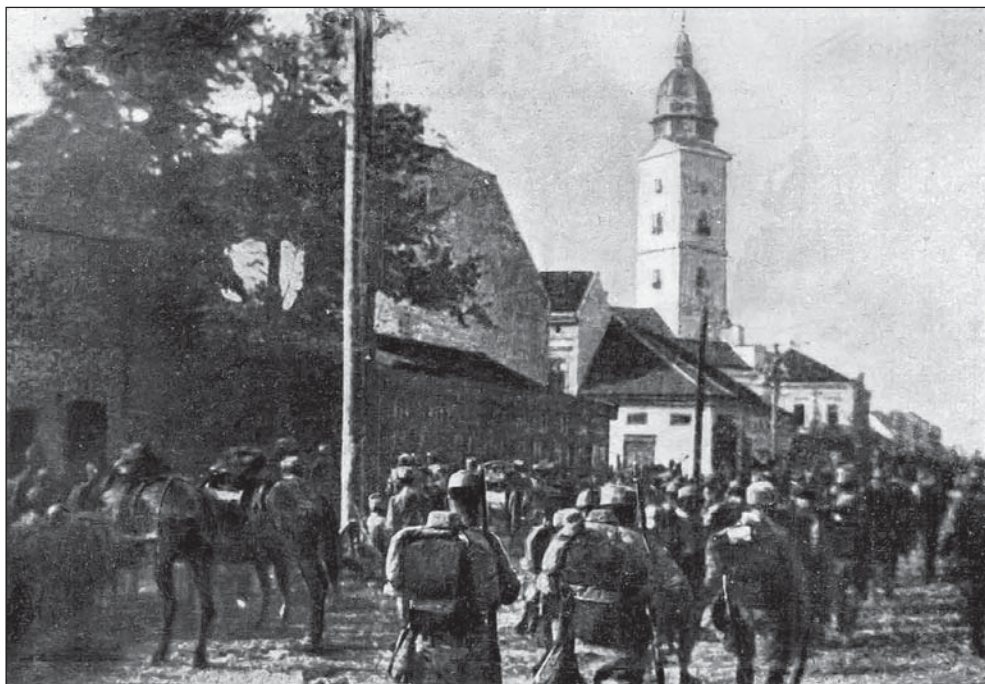
Bevonulás Sabácza

több mint egy órán át puhította a védőket – 17 órára el is foglalták a várost. Tersztyánszky, mint hadtestparancsnok, nyomban sietett is jelteni az uralkodó katonai irodájának, hogy „délután fél 6 óta a szabácsi templom tornyán a Dáni tábornok által kitűzött császári zászló lobog” 8 .