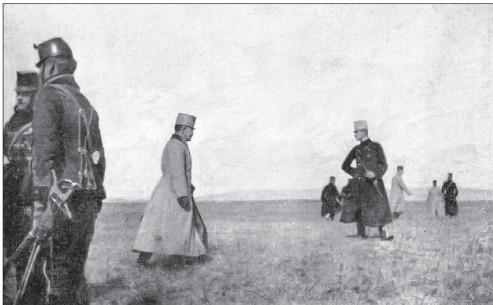
József főherceg a Szávánál

alaposan kifáradva nekiláthassanak az átkelésnek. József főherceg, a felettes 31. hadosztály parancsnoka háborús visszaemlékezései szerint: