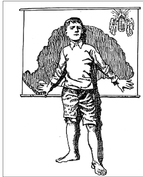
2. ábra. Kép a Magyar Misi kalandjai a vörös világban című könyvből (Mühlbeck Károly rajza)

Csak két évtized múlt el a két világháború között. Ennyi idő se a történelmi sokkémények feldolgozására, se a lábadozásra nem elég. A Trianon utáni érzelmek, indulatok, konfliktusok, reménykedések és önáltatások átívelik a korszakot. A legendák is.