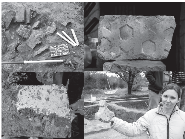
Balra fent: török téglák és faragott kövek a rablógödörben; jobbra fent: arabeszk motívumú köifaragvány; balra lent: arab betűs feliratmaradvány; jobbra lent: palmetta formájú kupoladíz.

A tudomány szempontjából erre könnyebb felelni, hiszen rengeteg kutatási feladat van vissza, beleértve a részben kiásott derviskolostor teljes feltárást, az egykori turbéki erődítményt körülölelő árok több helyen történő átvágását, az egykor keresztények által lakott városrész vagy éppen a településhez tartozó sírkertek