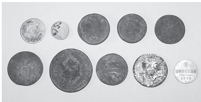
XVIII–XIX. századi érmék a turbéki templomudvarból.

Az újonnan felkutatott és elemzett források, valamint a már ismert dokumentumok újraértelmezése az Almás menti és a turbéki templomnál lévő helyszíneket szintén kizárta, és egy új területre, a turbéki–zsibóti szőlőhegyre terelte a további vizsgálatokat. A dokumentumok ugyanis a szigetvári vártól egy órányira, 4-5 kilométer távolságban, az egykor a közeli Zsibót településhez tartozó turbéki szőlőhegy egy magasabb pontján, a szőlők és a kukoricaföldek határán jelölték ki azt a területet, ahol a türbe és az azt körülvevő épületek álltak. Egy szerencsés módon fennmaradt 1738. évi tanúvallomásból pedig az is kiderült, hogyan is kell elképzelnünk Turbékot, ezt az egykor a zarándokok által sűrűn látogatott, a korabeli térképeken közepes méretű vagy jelentőségű városként ábrázolt települést: „midün az Török üdőben Turbékot Lakták az Szánczon kívül az Kereszténység, bent pediglen