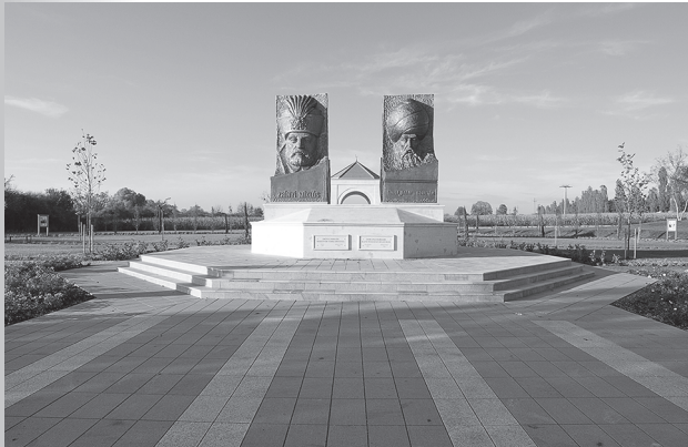
Zrínyi Miklós és Szulejmán szultán szobra, köztük a háttérben a szimbolikus sír a Magyar-Török Barátság Parkban.

A felfedező munka homlokterébe először két legendás helyszín, a szigetvári vártól északra elterülő részen az Almás-patak partja, északkeleten pedig a turbéki